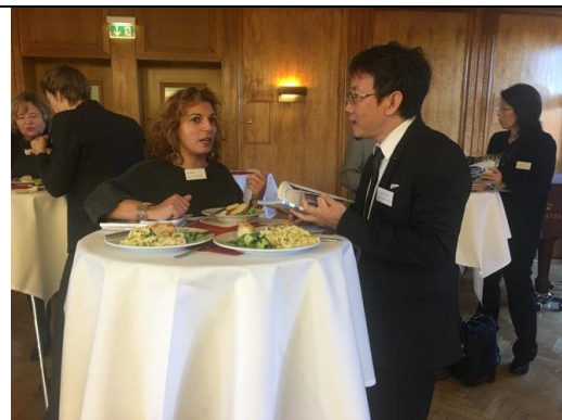
本校熊博安國際長與亞琛應用科學大學洽談與交流