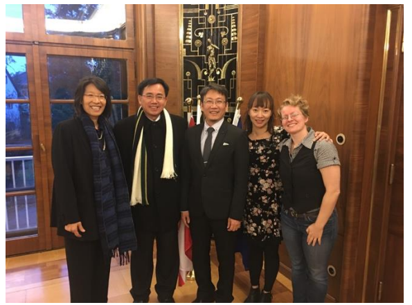
臺綜大參訪代表團於柏林自由大學合影