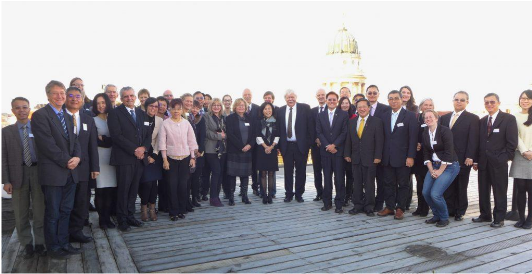
「第一屆臺德高等教育論壇」大團拍