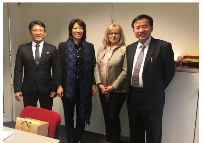
拜會柏林工業大學