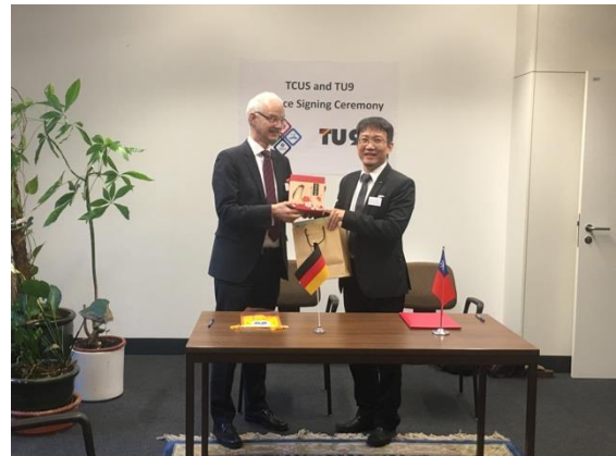
本校熊博安國際長代表致贈學校禮品