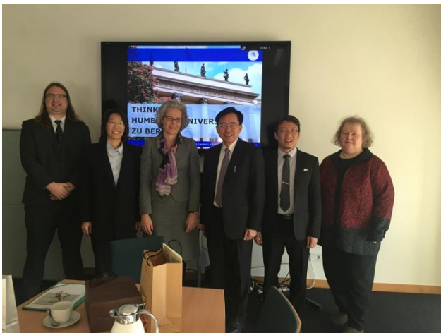
拜會柏林洪堡大學