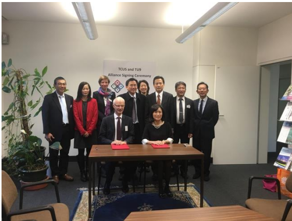
與 TU9 共同簽署合作備忘錄