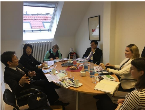
拜會柏林工業大學國際暑期學校