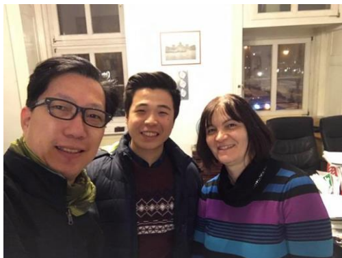
訪視匈牙利實習同學