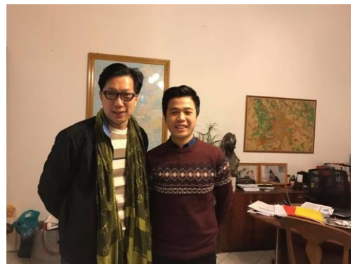
訪視匈牙利實習同學