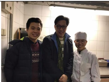
訪視匈牙利實習同學