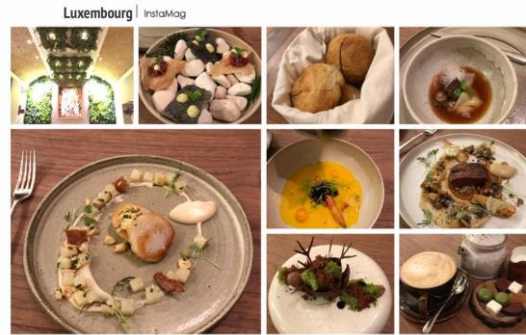
訪視同學於米其林餐廳用餐