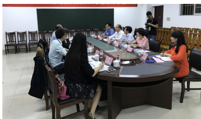
與物電學院師長進行交流座談