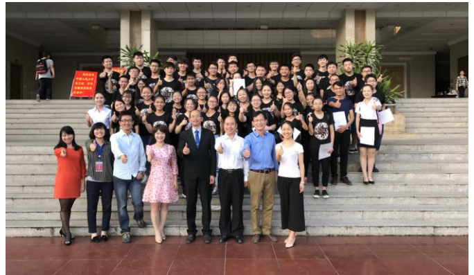
講座後與物電學院師生合影。