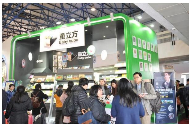
圖 9：訂貨功能經過 30 年的產業變化也隨之變化。

席訂貨會的上海東方出版交易中心常務副總經理蔡國城回憶 7 ，訂貨會變革了原有的購銷模式，對於與會的書店非常有吸引力。看樣訂貨的圖書一般是現貨，發貨速度快，折扣優惠一般比發行所(省級店)，經銷方式靈活，經銷包退的方式開始在大陸試行，首都社科圖書交易會(北京訂貨會前身)立馬顯現其強大的生命力，規模一年比一年大。