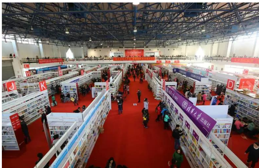
圖 10：館配是訂貨會的一大特色。

「風向標」的作用，是全國出版業的盛會，包括訂貨功能、行業前景、論壇活動、相互之間啟發等等，「一是可以理性地分析過去一年的情況，二是了解未來新一年出版新產