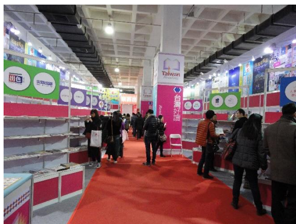
圖 5：即使通訊科技發達，訂貨會仍有其存在的價值。

據悉，中國大陸現有農村圖書館約 64 萬家(每家圖書館採購 2 千本書)，都是政府編列預算購書典藏，又大陸民眾對於優質臺版書的喜愛遠大於大陸書籍，此次藉由參與館配館的機會，讓臺版書在館配區有露出的機會，開創臺版書打開大陸各省圖書館及農家圖書館採購大門，增進臺版書在大陸銷售的機會。