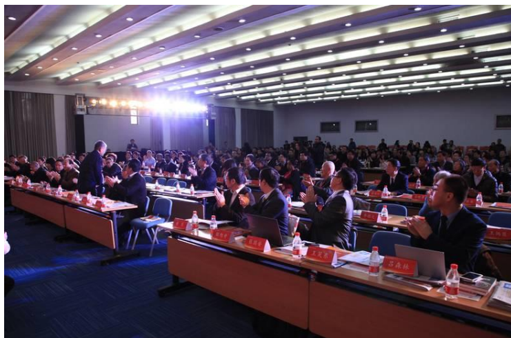
圖 11：訂貨會的重頭戲「中國出版高層論壇」可謂冠蓋雲集。

本屆訂貨會的重頭戲之一就是「北京圖書訂貨會 30 年，出版業演進邏輯與深改走向」為主題的「中國出版高層(峰)論壇」。論壇均為中共高層上對下的政策指示，或是願景規劃，但從部分人士的演講中仍可嗅出中國大陸政府對抓緊出版產業的政策更為札實，對出版產業的扶植更加具體。例如全國人大教科文衛委員會主任委員、中國出版協會理事長柳斌杰以「堅定文化自信 鑄造出版高峰」為題的演講中就提到，很快中央將發布有關中華文化傳承的重要文件。對