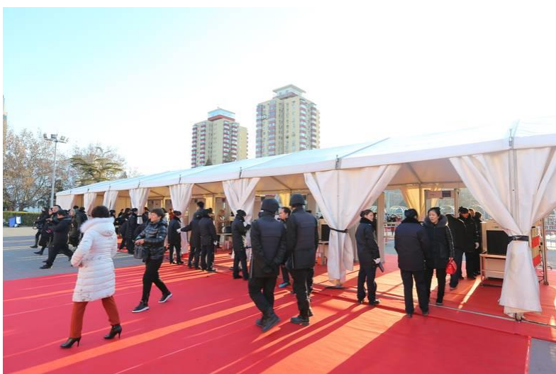
圖 2：參觀訂貨會必須通過電子安檢門。

1月12日星期四，上午9點鐘不到，中國國際展覽中心前的40米道路出現塞車情形，不是為了趕上班，這些都是參加第30屆北京圖書訂貨會的「早鳥客」，除了來自兩岸四地的出版發行商外，更多是一般民眾，因為只有這時候才能完整看到、買到兩岸四地的華文書。