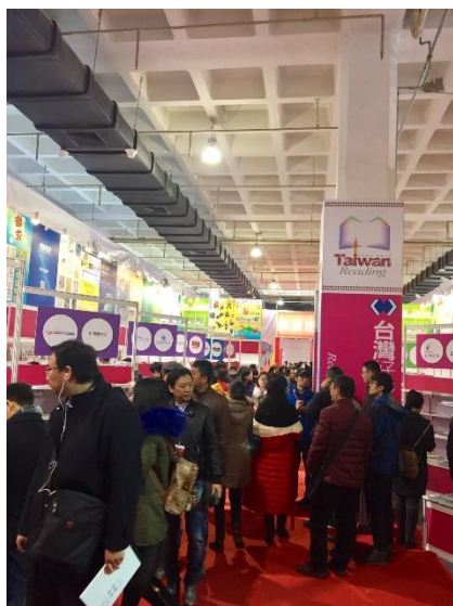
圖 4：臺灣正體字書頗受民眾好評，詢問度高。

為加深大陸讀者對臺灣的優美出版品的印象，協進會延續 2016 參展主題「台灣好讀」的設計參展，藉此展售會讓大陸與港、澳等出版業、圖書館業與讀者，由閱讀方式了解臺灣的風土民情、飲食文化與精美的文創產業。這次臺灣代表