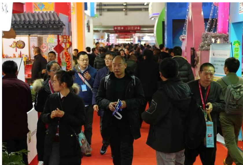
圖 7：圖書訂貨會除經銷商外，頗受民眾青睞。

商展般，卻意外地大受書店歡迎，它把傳統的以書目訂貨的方式改為「看得見、摸得著」的實物訂貨方式，使書店業務員免去「隔山買牛」之苦，解決了長期以來書店主要