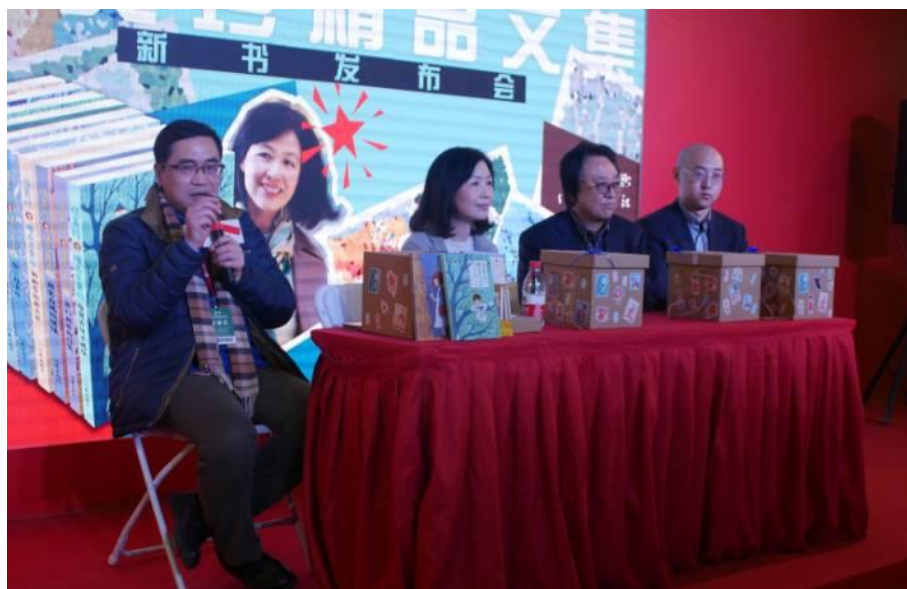
圖 18：訂貨會存在的重大功能之一就是新書發布。

北京圖書訂貨會已經走過了 30 個年頭。30 年前在中國改革開放伊始之際，中國的圖書發展方興未艾，為順應市場的需求，中國國家新聞出版廣電總局前身國家新聞出版總署決定開放圖書統購統銷政策，解決發行相關問題，圖書訂貨會就在這種時空背景下應運而生。1987 年起，圖書訂貨會的規模隨著中國出版業的發展而不斷擴大，隨著科技進步，訂貨會的功能也不斷拓展；隨著中國出版業的繁榮發展，圖書訂貨會的影響與日俱增，