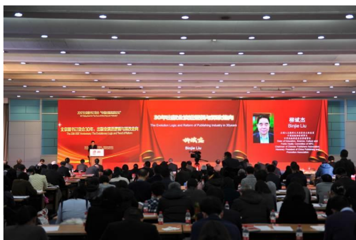
圖 12：出版論壇高層論壇多為樣板的宣傳，鮮有新意。

除了樣板式的宣稱與宣傳外，柳斌杰現場宣布國家對出版業準備釋出的利多，他指出，今年十九大召開在即，一系列利多法律政策即將實施，將給出版業帶來前所未有的機遇，他認為今(2017)年應該是出版的黃金年。另外他指出，過去出版業是單一靠國家資本，現在出版業既有國家投資，也有社會投