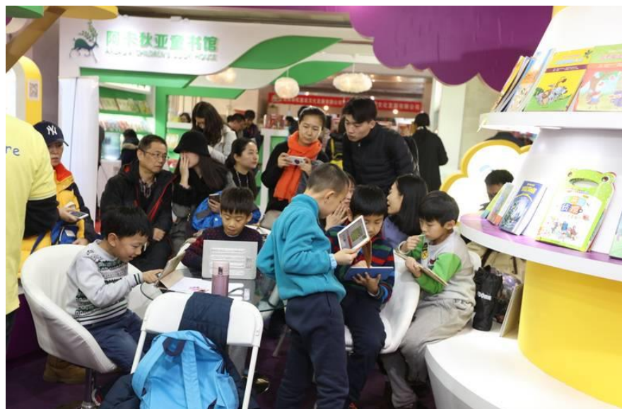
圖 17：大陸童書市場過度蓬勃，造成良莠不齊現象。

人，也就是說，每年約有 1,800 萬新生兒誕生，這還是這兩年解禁後的數字，未來可望更多，而且這些新生兒的購書能力將在 2-3 年後顯現，屆時中國的童書市場勢