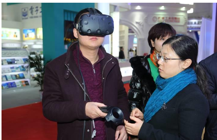
圖 14：民眾在現場親身體驗 AR、VR 的新奇。

這種「計畫出版」在民主國家不但沒有市場，也令人不可思議，但在極權的中國大陸，是出版界年度大事，市場不是問題，一聲令下，再冷門的主題書也有數十萬到數百萬本的銷量。然而，不容忽視的是，在計畫出版項目下，偶爾也有極具市場性及趨勢性的主題，例如，人工智能和機器學習可望成為