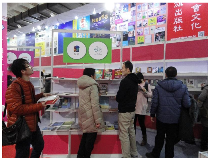
圖 6：北京圖書訂貨會今年邁入第 30 年。

根據筆者現場觀察及隨機訪問出版社人員發現，現今因網路等通訊方式發達，訂貨、版權交易、其他合作等往來，已無須靠面對面方式，而且不定時，幾乎