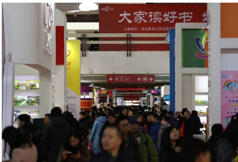
圖 8：民眾爭先恐後在訂貨會上搶新鮮、搶文化。

初訂貨會功能非常強，有些規模較小的書店，全年一半的訂貨量都在此訂貨會上完成，是當時新華書店安排全年貨源的很重要的會議，是訂貨重要的通道，各個書店都非常重視。每年訂貨會晚上手工彙