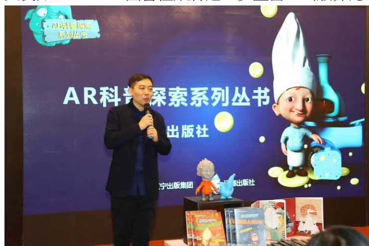
圖 15：業者在現場介紹自家 AR 系列叢書。

又例如，AR+VR 圖書種類將進一步豐富。出版界認為，2017 年以後，AR 的同胞兄弟 VR 對企業來說