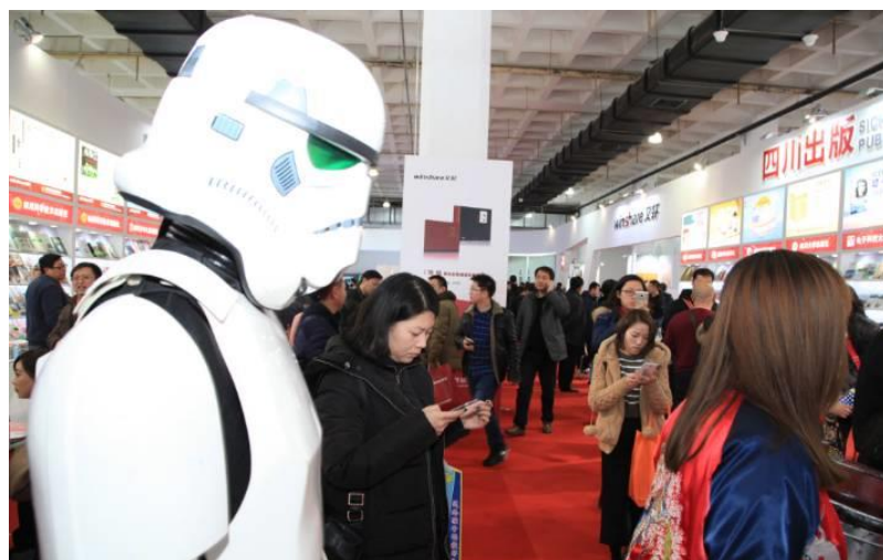
圖 13：VR+AR 是 2017 年選題重點。

是個典型的「計畫出版」。2016 年 6 月，中共中央宣部和國家新聞出版廣電總局發布 2016 年主題出版重點選題，共計 120 種，含 96 種圖書和 24 種音像電子出版物。12 月，國家新聞出版廣電總局發布《關於報送 2017