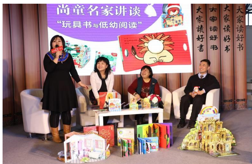
圖 16：由於一胎化解禁，大陸童書市場蓬勃發展。

今年北京圖書訂貨會人潮比起去年並無成長，但光臨童書展位的人潮洶湧，從未間斷，來自大陸各地的經銷商和親子擠爆少兒類圖書展館。根據中國青年網記者引述一份報告數據指出 11 ，在本屆訂貨會某第三方機構發布的一份調查報告指出，少兒類圖書以28.84%的同比增長率把其他領域的圖書遠遠拋在後方，成為出版整體市場增長的最主要推動力量。光是中國少年兒童新聞出版總社今年就準備了超過300種類的圖書參展，內容涵蓋了文學、科普、動漫、繪