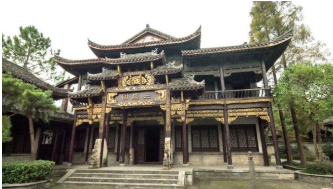
圖三：勝強基地外景建物