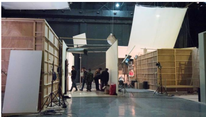
圖五：勝強基地內景棚作業情形