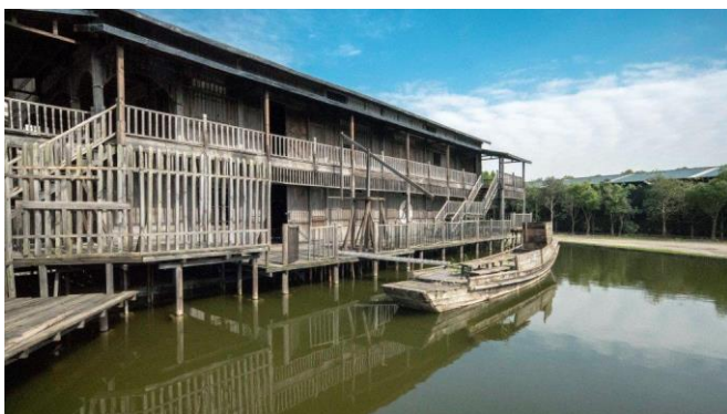
圖八:勝強基地電影「黃飛鴻之英雄有夢」外景實景