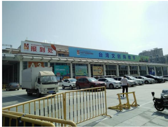
圖十八：廈門文博會報到處