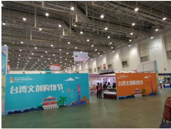
圖二十一：廈門文博會展覽會場