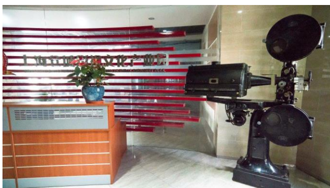
圖十一:倉城影視園區一角