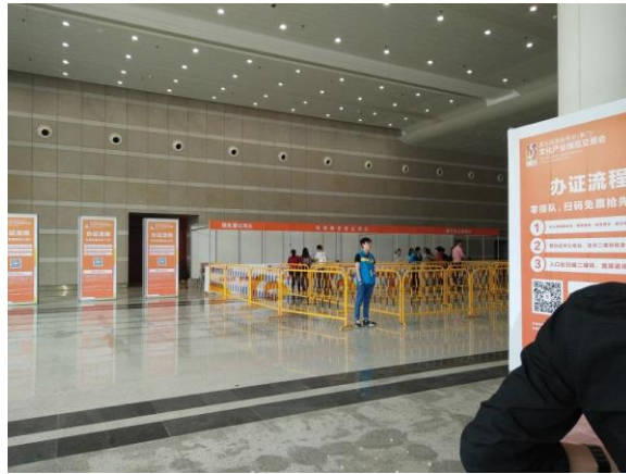
圖十九：廈門文博會入口處