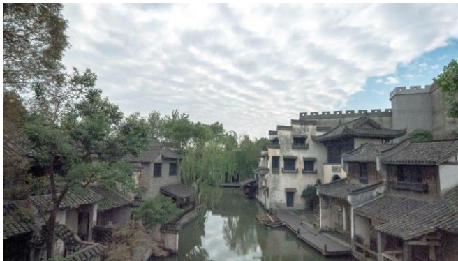
圖四：勝強基地外景江南水鄉街