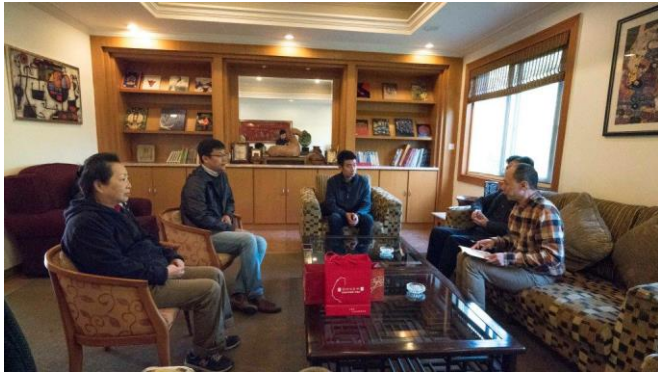
圖二：拜會勝強影視基地