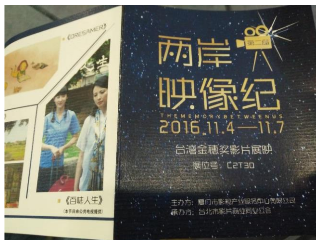
圖二十五：兩岸映像紀電影館摺頁