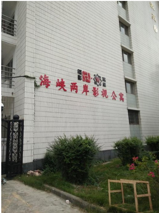
圖十七：海峽兩岸影視公寓