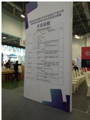
圖二十三：大會議程