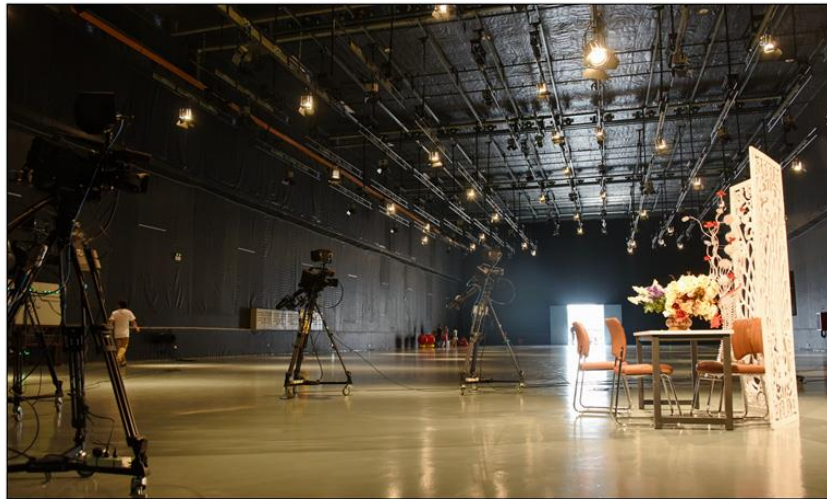
圖十三：海峽兩岸影視製作（漳州）基地室內攝影棚。

漳州基地分為兩期，第一期目前已經完成，多以室內搭景為主，基地面積佔地 8600 平方公尺，目前已完成第一期建造作業，內有醫院場景與 2 座先進室內攝影棚，分別佔地 1500 平方公尺，搭配全套高畫質影像製作器材，並有服裝間、化妝間、播控間、編輯室、錄音室、道具間及辦公室，每月可以接待 2 到 3 組劇組。第二期將搭設監獄及各種不易覓得之都會區拍攝場景，待全部建成後，每年可接待 40 組以上劇組