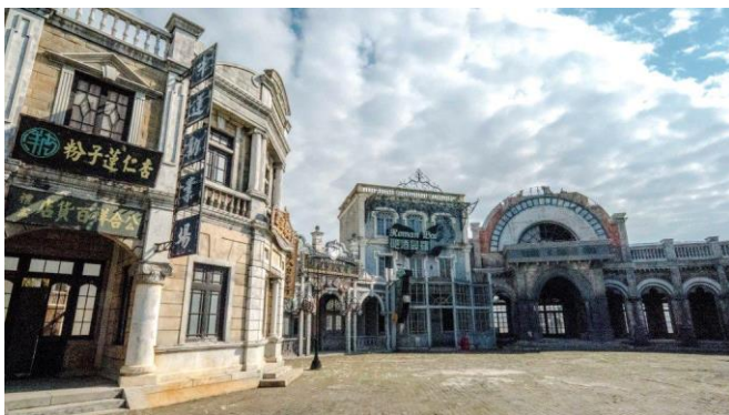
圖七:勝強基地電影「十月圍城」外景實景