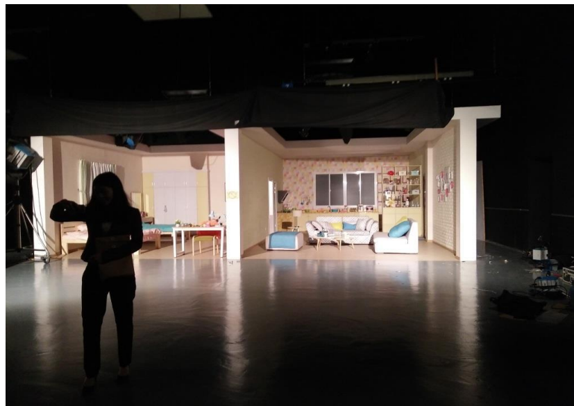
圖十四：拍攝劇組於室內攝影棚搭建場景