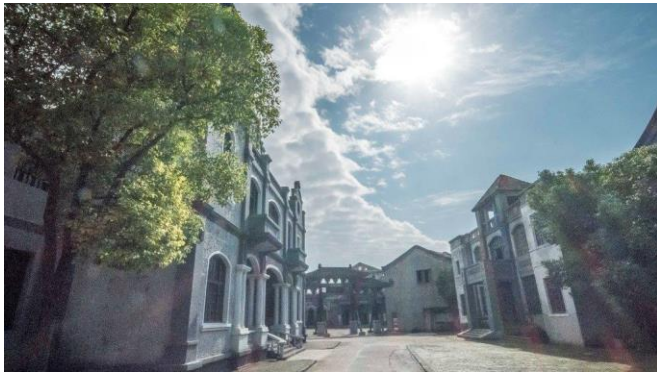
圖六:勝強基地外景老上海街