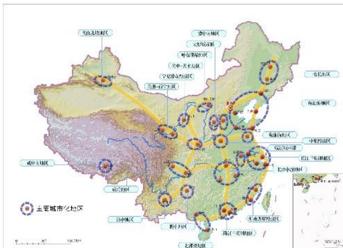
图 4 “两横三纵”城市化战略格局