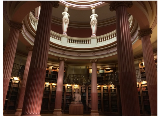
吉美博物館創辦人艾米爾·吉美（Emile Guimet）（一八三六-一九一八）

吉美先生的年代為法國第二帝國拿破崙三世（Napoléon III）執政時代，他在家族事業穩定發展後開始遊歷異國。一八六五到六六年間探索埃時參觀的埃及第一個博物館（Musée de Boulaq）與古埃及神殿，對他探索古埃及文化歷史與信仰極具能發，日後的希臘、土耳其、羅馬尼亞、阿爾及利亞、突尼西亞等國之旅亦豐富了他的收藏。一八七六年，法國公共教育部指派吉美先生遠征研究各國宗教，他將公司經營託付同仁，展開環球探索美國費城、舊金山、日本、中國沿海城市、印度南部、孟買、西貢、新加坡、葉門及地中海等地。遊歷返回里昂後決定建造一個博物館已展示運返法國的收藏。一七八九年十一月二十日，建築師 Jules Chatron 以埃及 de Boulaq 博物館為藍本的里昂吉美博物館（Musée Guimet de Lyon）開幕。一八八二年吉美先生將未完工的里昂吉美博物館搬遷到巴黎。一八八四年，依照舊館的十九世紀新古典主義風格外觀出資興建一個大三倍的新館。一八八九年，他以終生館長的身份和法國總統（Sadi Carnot, 1837-1894）共同為巴黎吉美博物館新館開幕。一九二八年，此座位在巴黎的亞洲文化地標建築升格為國立機構，並在一九四五年更名為為「亞洲藝術博物館」（Musée national des arts asiatiques-Guimet）。