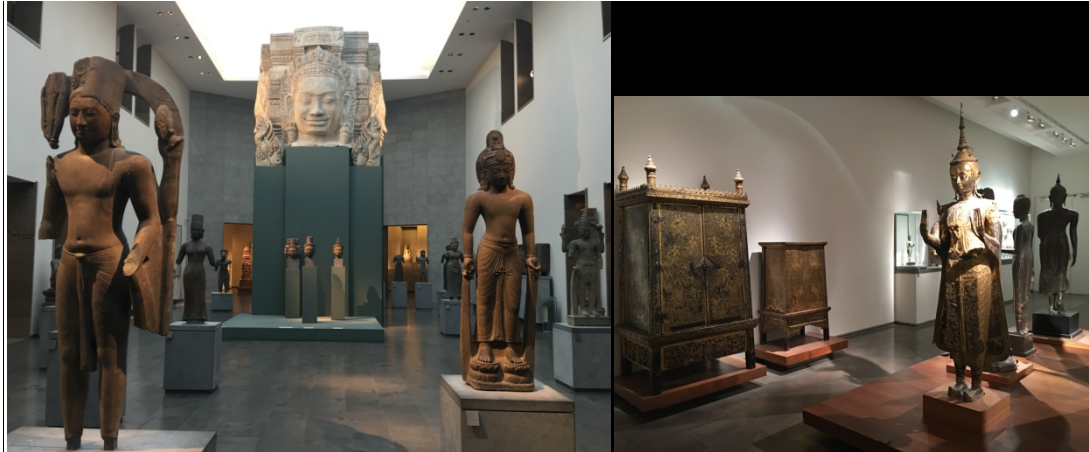
柬埔寨及東南亞展廳

吉美博物館的典藏源自一八八四年吉美先生捐贈國家的個人收藏，十九世紀末法國政府探險隊帶回及文化部整合之文物。目前吉美博物館的典藏包括東南亞、中亞、中國、韓國、日本、阿富汗及基斯坦、喜馬拉雅的藝術和宗教文物。