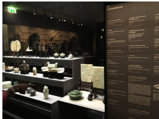
國立楓丹白露宮博物館 (Musée national du château de Fontainebleau)