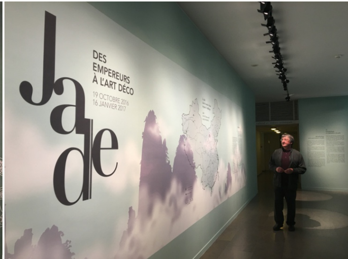
「玉—從帝王尊榮到裝飾風的藝術」特展海報