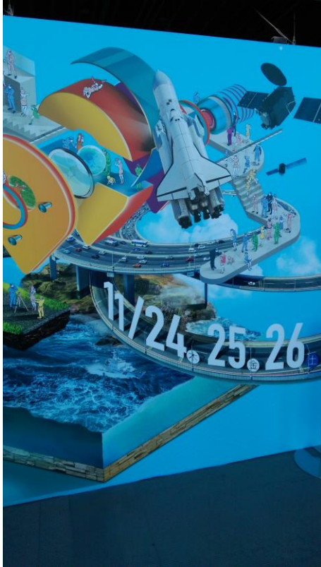
圖 5 空間情報展呈現測繪應用