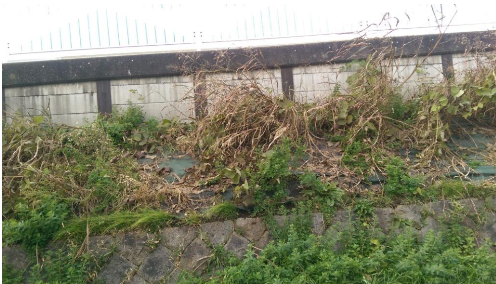
圖 7 埼玉縣邊坡自然現況