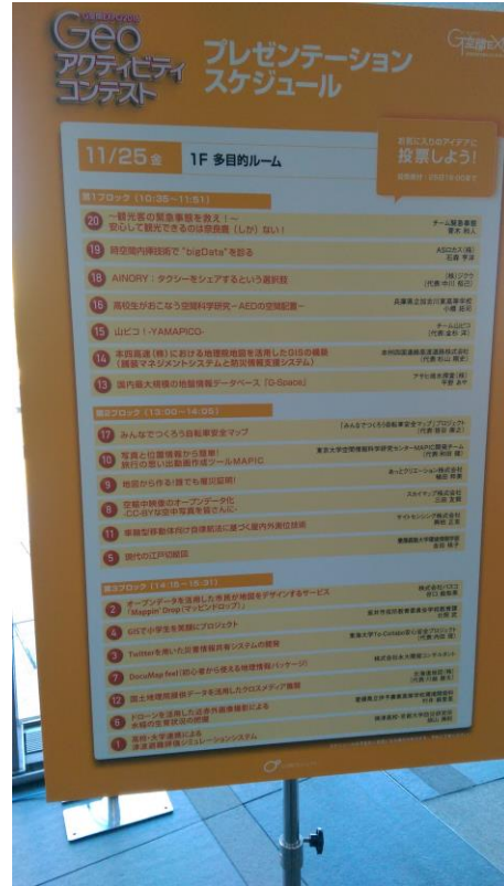
圖 6 空間情報展成果発表各項議題