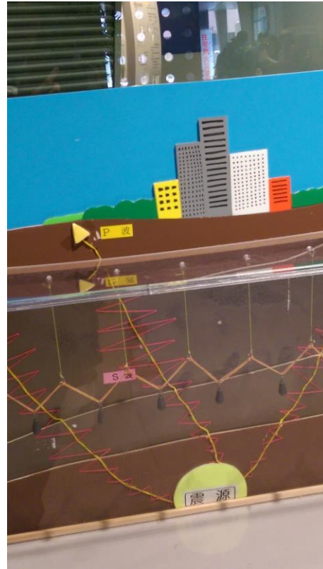
圖 17 地震震坡 P 波 S 波傳遞振動變化