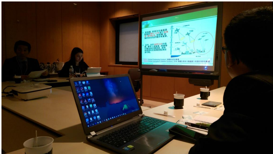
圖 4 於國際航業株式會社 GPS 技術經驗交流