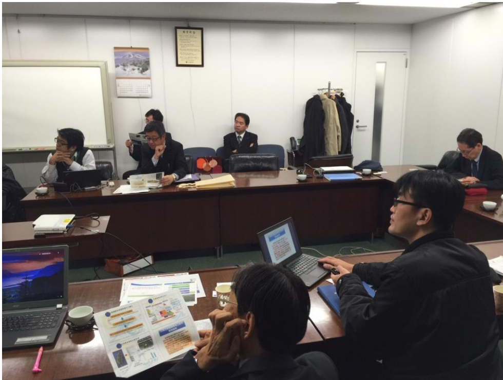
圖 1 與亞洲測量株式會社防災經驗交流