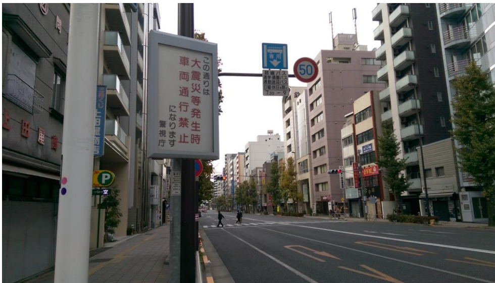
圖 18 大地震緊急救援路線禁止通行標示