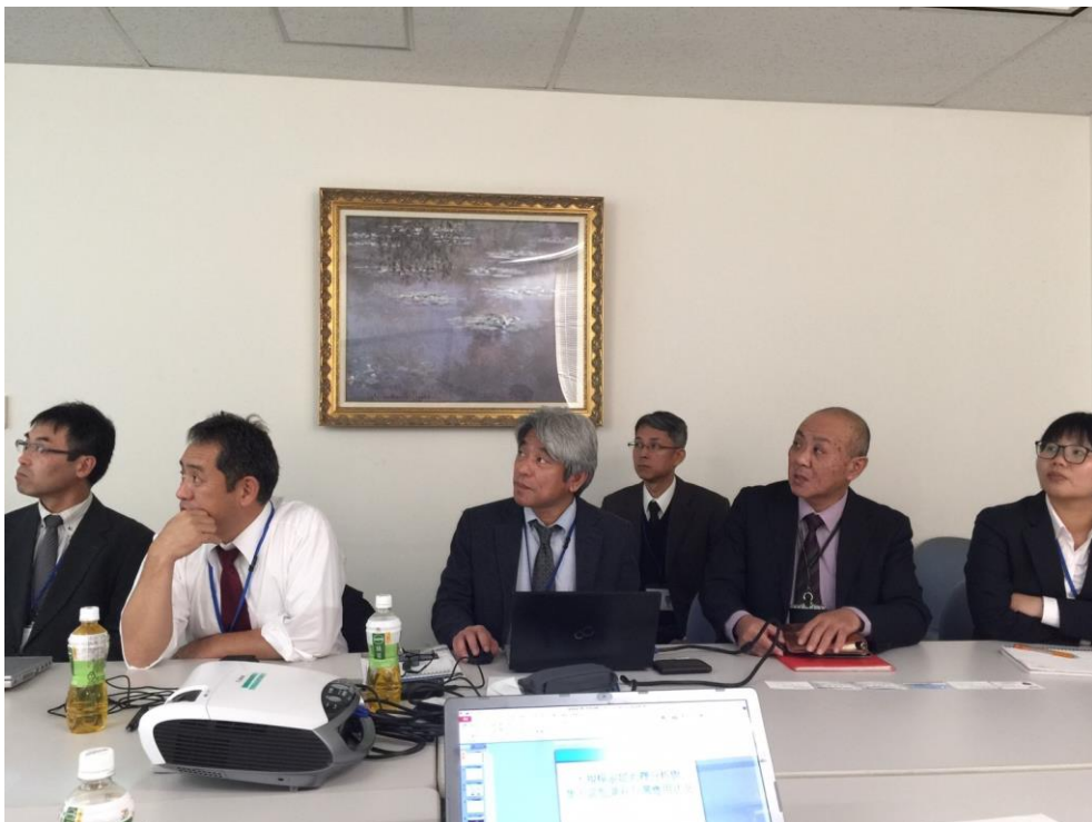
圖 3 與亞洲測量株式會社防災經驗交流