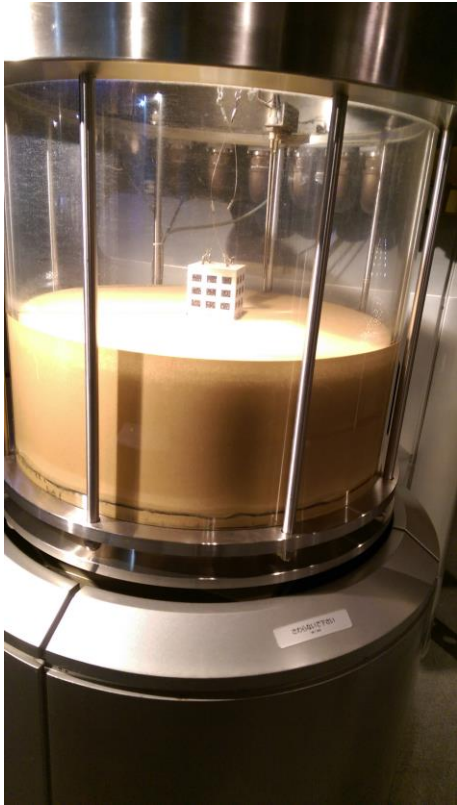
圖 16 土壤液化致建物傾倒模擬