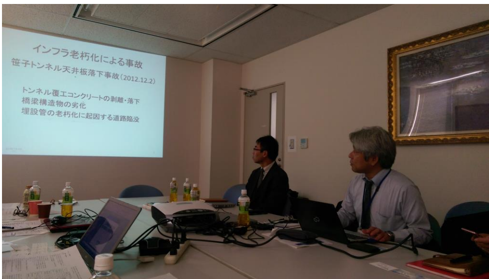
圖 9 日本針對設施永續經營之重視