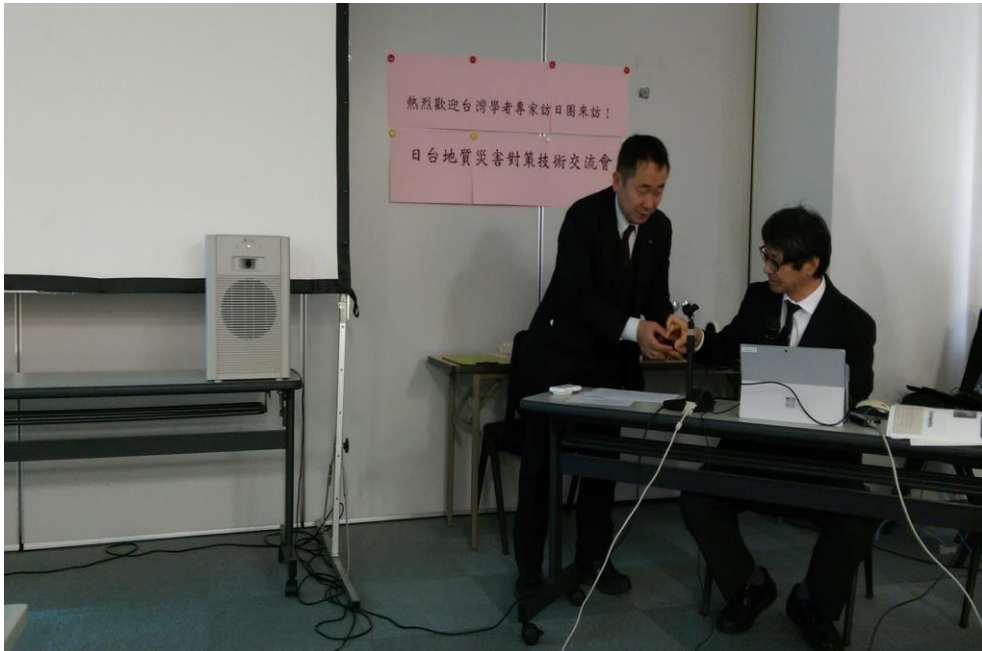
圖 2 國土防災株式會社進行地質災害對策技術交流會