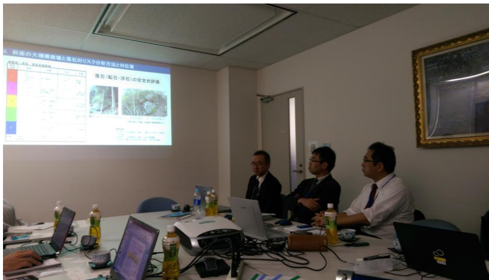
圖 11 落石防治經驗交流