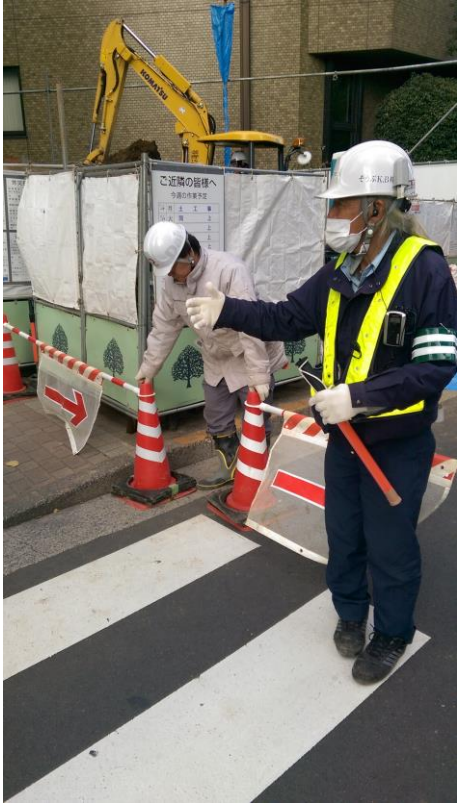
圖 12 工區管制