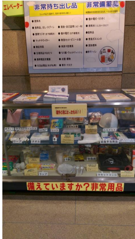
圖 15 緊急避難必需用品