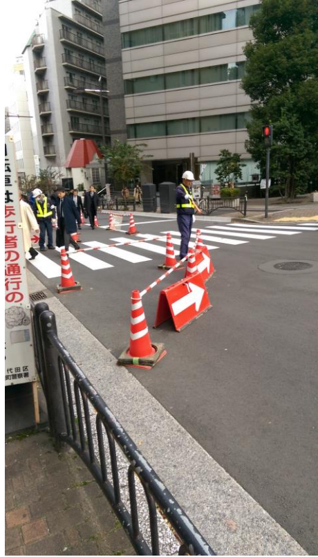
圖 13 替代路線引導