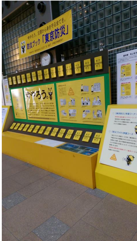
圖 14 東京都防災手冊及防災地圖