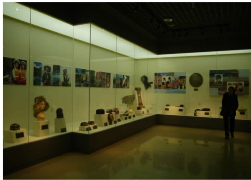
圖 19:民族博物館服飾文化展廳一角