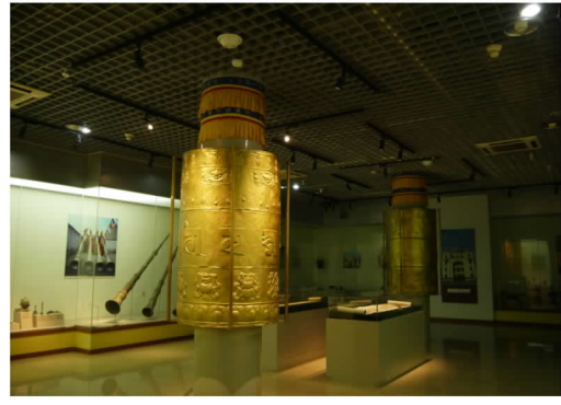
圖 18:民族博物館宗教文化展廳一角