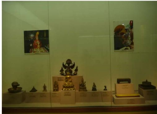
圖 17:民族博物館展出佛像