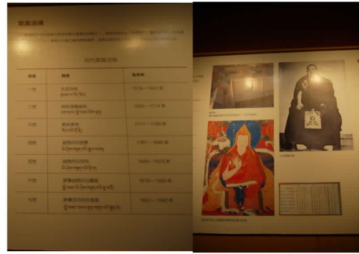
圖 7: 蒙藏委員會委員長吳忠信主持十四世達賴喇嘛坐床檔案