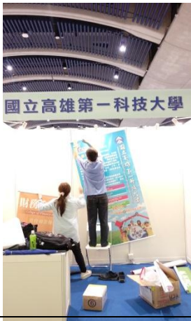
第一天 10/20 教育展展前 場佈