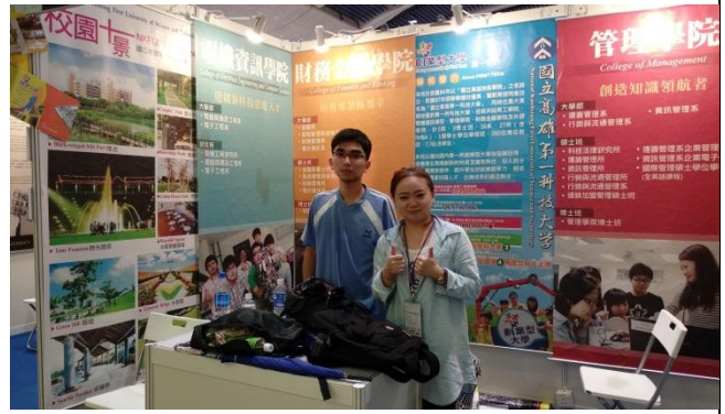
第一天 10/20 教育展展前場佈