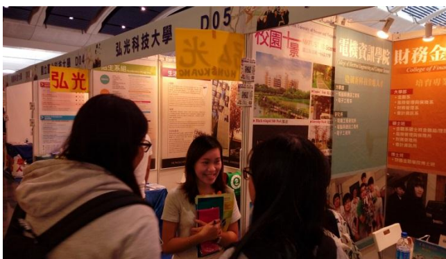
教育展現場人潮絡繹不絕