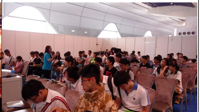
本校宣傳講座時間