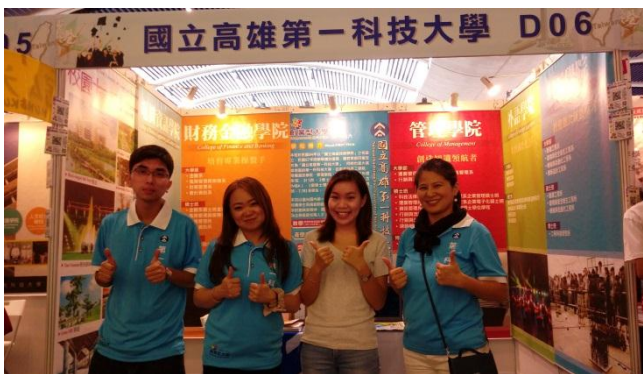
專業宣傳形象，展現第一活力