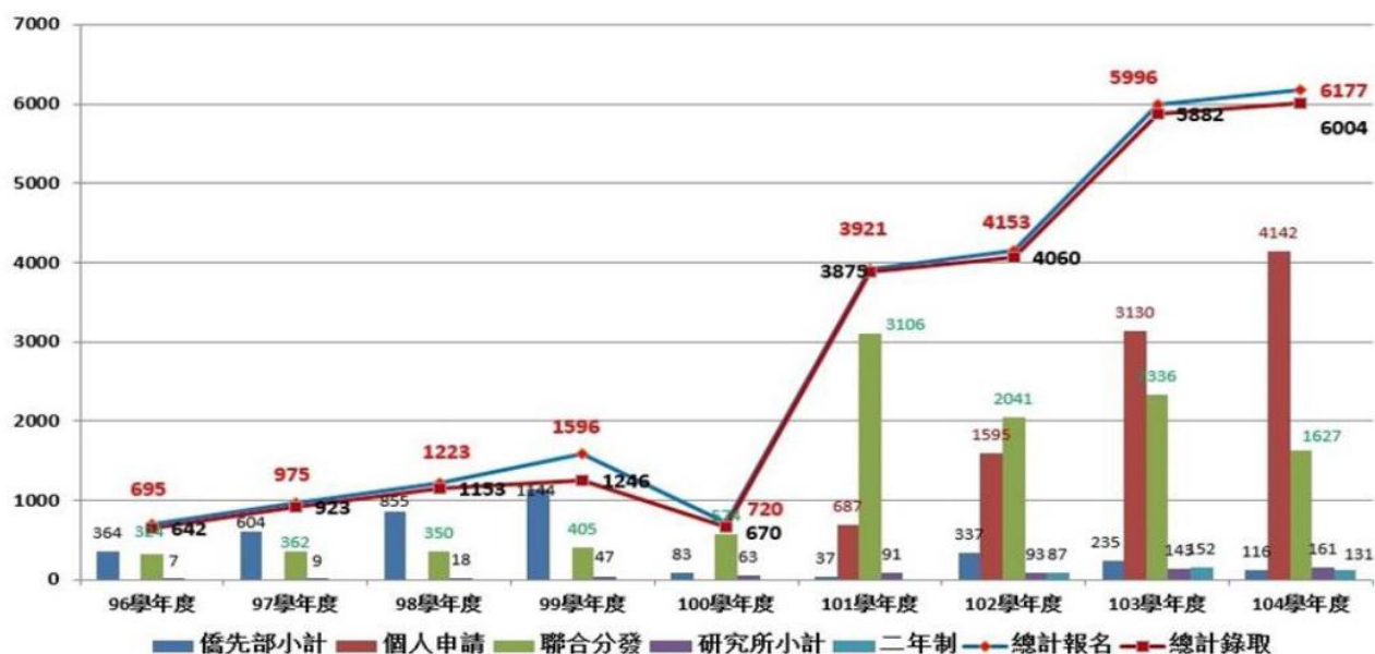
近 9 年來香港報名暨錄取海外聯招會人數

又據悉，香港每年約有 7 萬名中學生畢業，而香港各大學所提供的名額僅可容納約 18%，大多數中學畢業生無法在港繼續升學，轉而向其他國家地區尋求升學的機會。因此，自 101 學年度起報名來台就學人數大幅成長，歷年香港各學制報名及錄取人數如下圖。