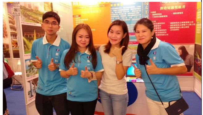
來展場幫助畢業港生