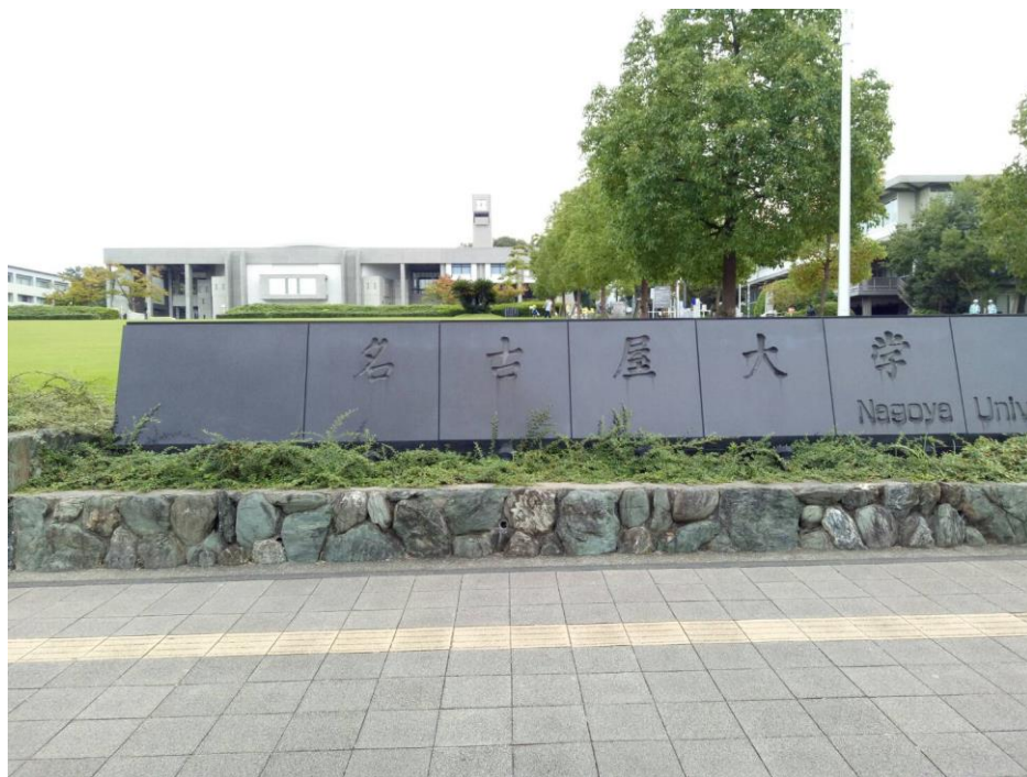
名古屋大學大門及豐田講堂