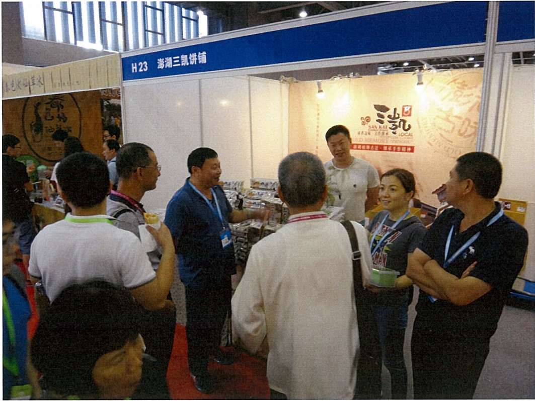
澎湖傳統手作餅店-三凱餅舖共襄參與