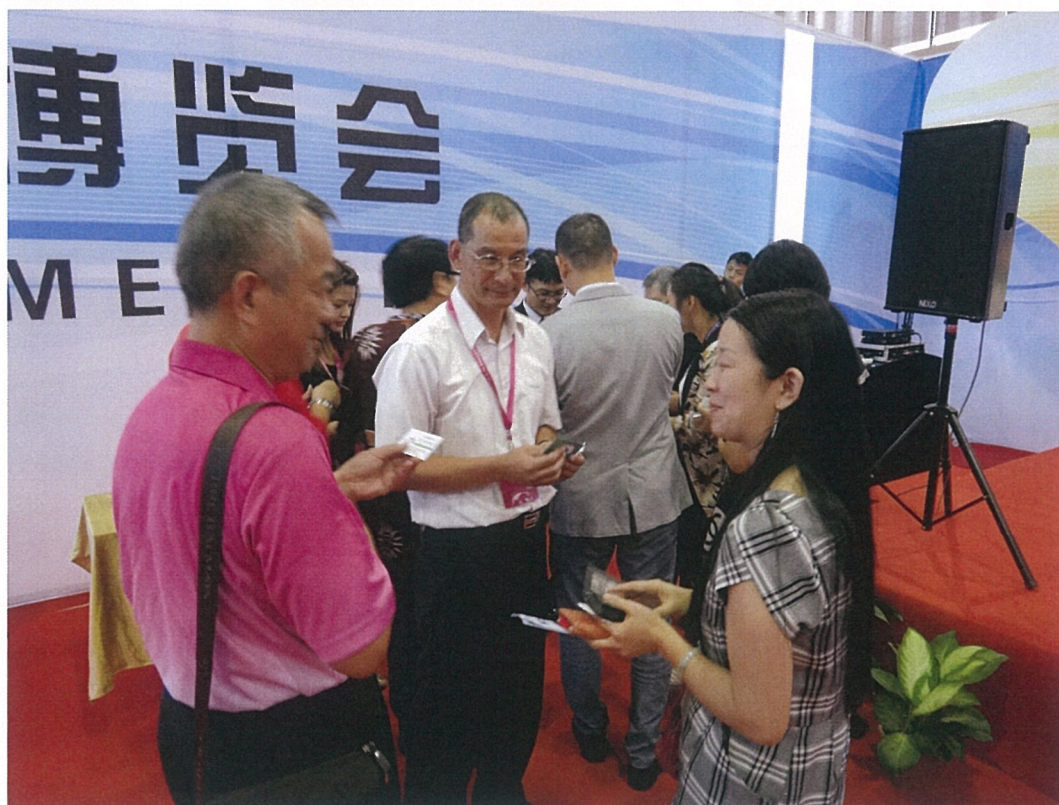
與會旅行社業者代表互留名片，洽詢澎湖旅遊模式及行程內容