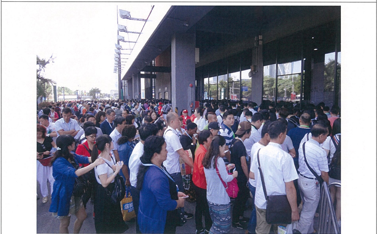
排隊等候進館參觀人潮