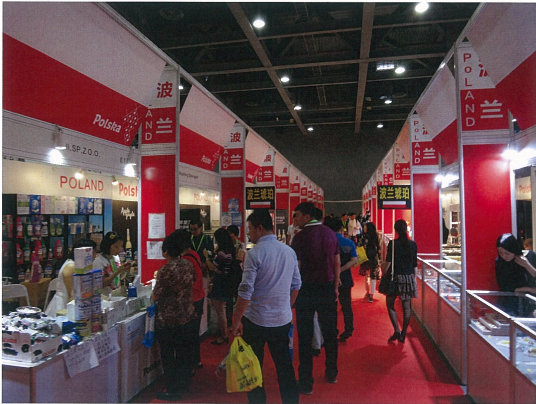
境外主題展-波蘭展區