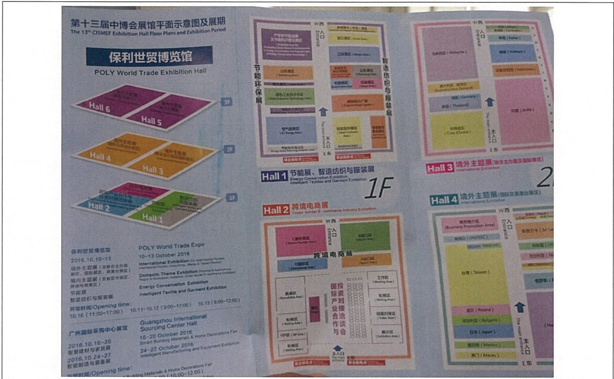
第十三屆中國國際中小企業博覽會展館示意圖