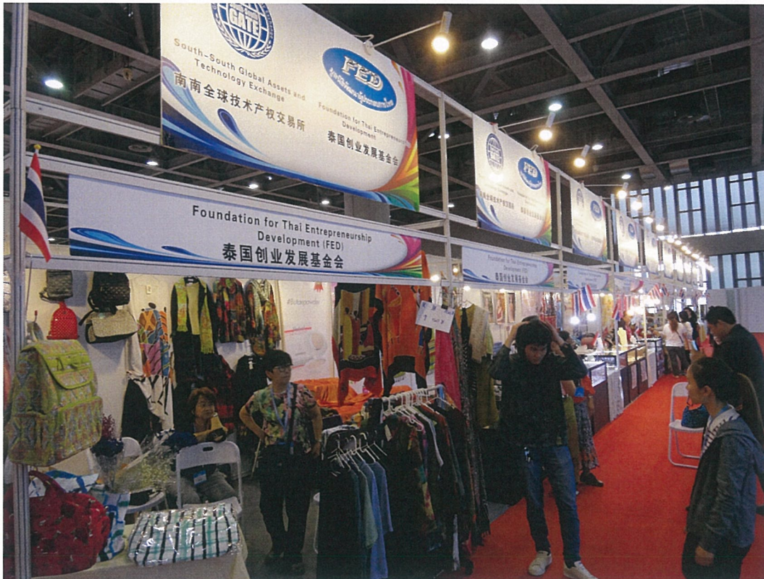
境外主題展-泰國展區