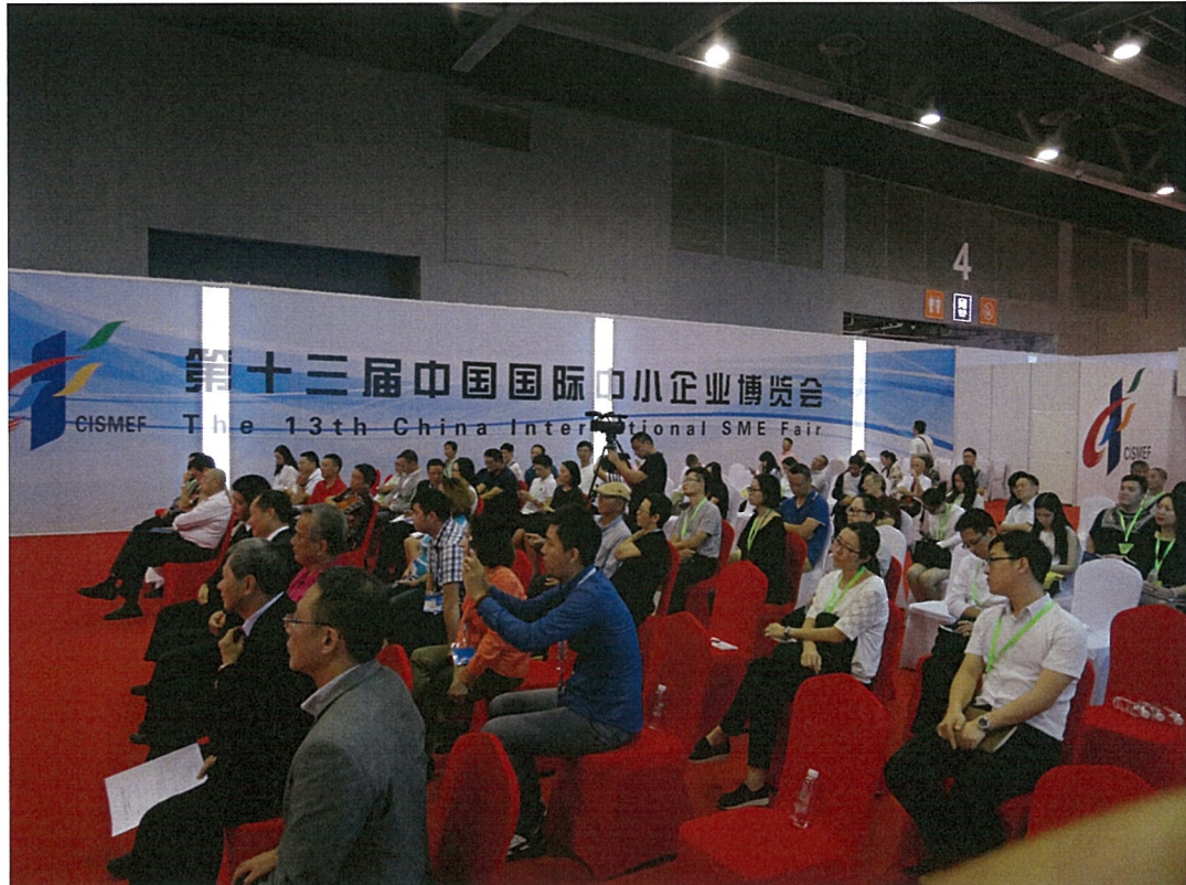
現場參加廠商及媒體朋友座無虛席