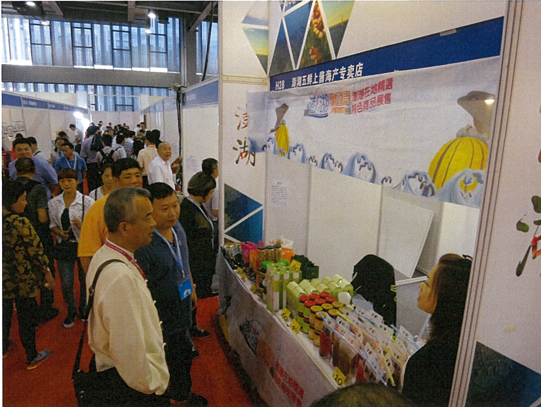
澎湖展區-澎湖紅果生技公司