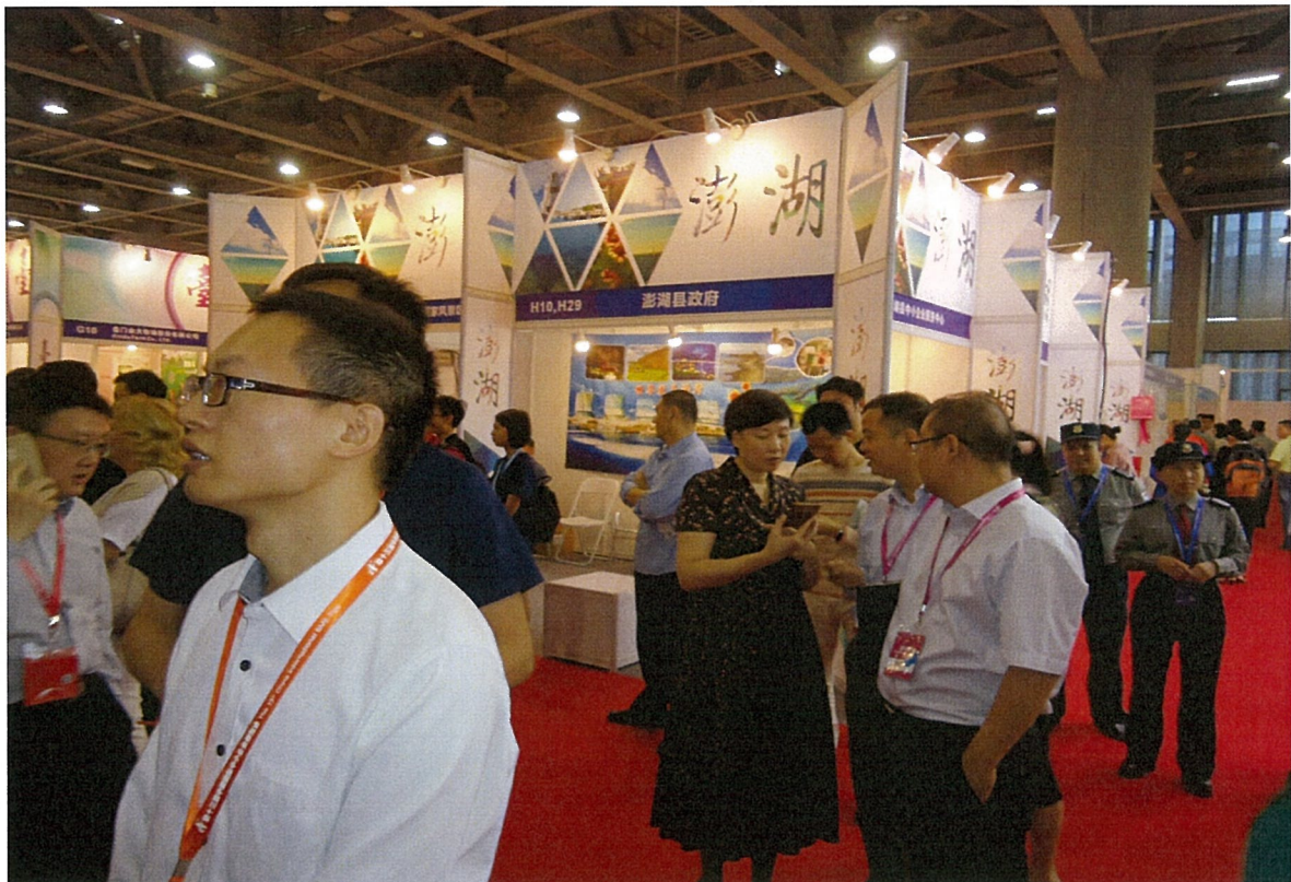
澎湖布置展区参观人潮如炙