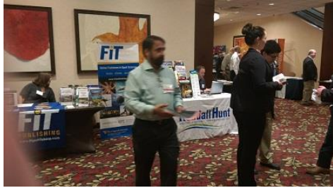
研討會贊助書商之櫃台