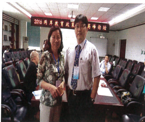
圖 1. 與西北大學教授學術意見交流後合影