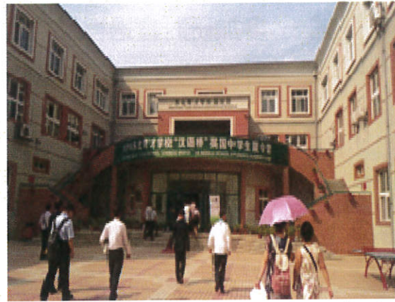
圖 4.參訪東北育才教育集團 國際部學校