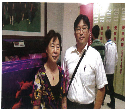
圖 2. 參訪瀋陽市渾南新區第二小學與校長合影

在參與本次研討會主題：2016 兩岸教育政策改革高峰論壇，其中筆者認為有關於台灣學者提出年實施十二國教後期中等學校免試特招入制度之變革；當地學者依其國家教育之國中小學執行體制存在的問題、原因及其對策提出最新研究，值得作為國內中小學教育現況研究的比較與參考。