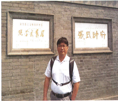
圖 3.參訪瀋陽張氏帥府