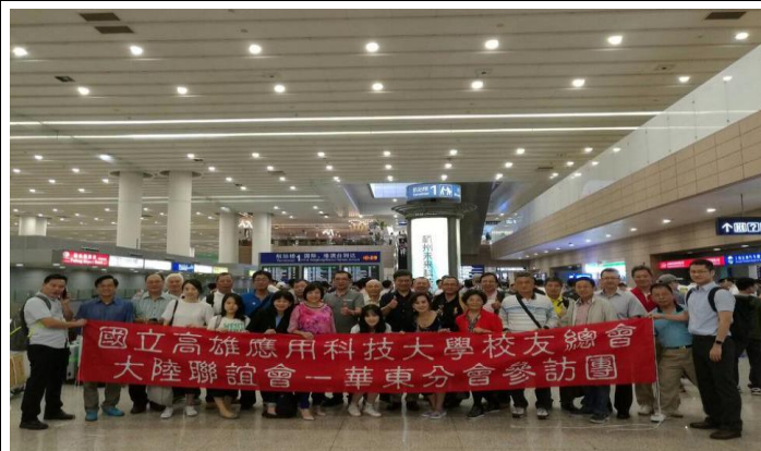
活動說明:參訪團與華東地區校友於機場合影