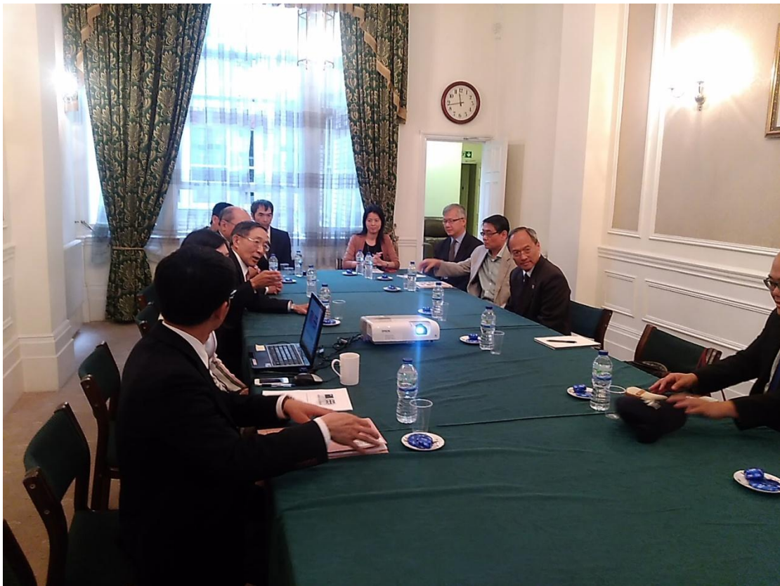
圖 4：拜會駐英國代表處並聽取簡報，期許英國地區僑務工作推展順利。