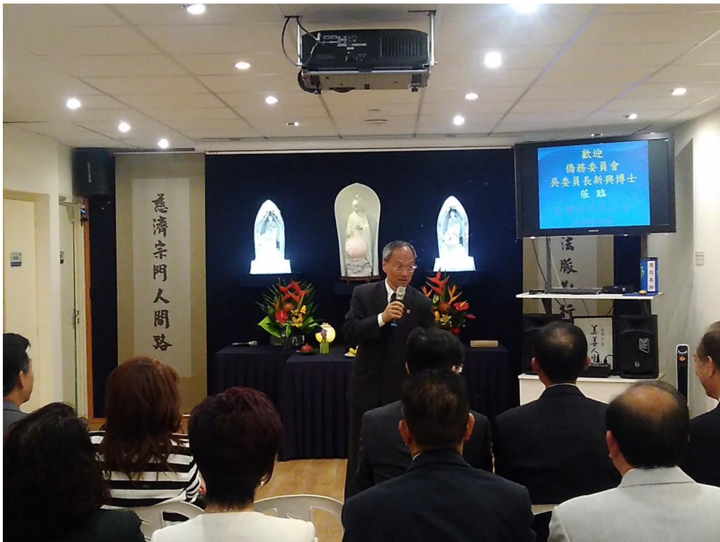
圖 2：拜會慈濟基金會法國聯絡處致詞時，肯定慈濟社會服務的大愛精神。