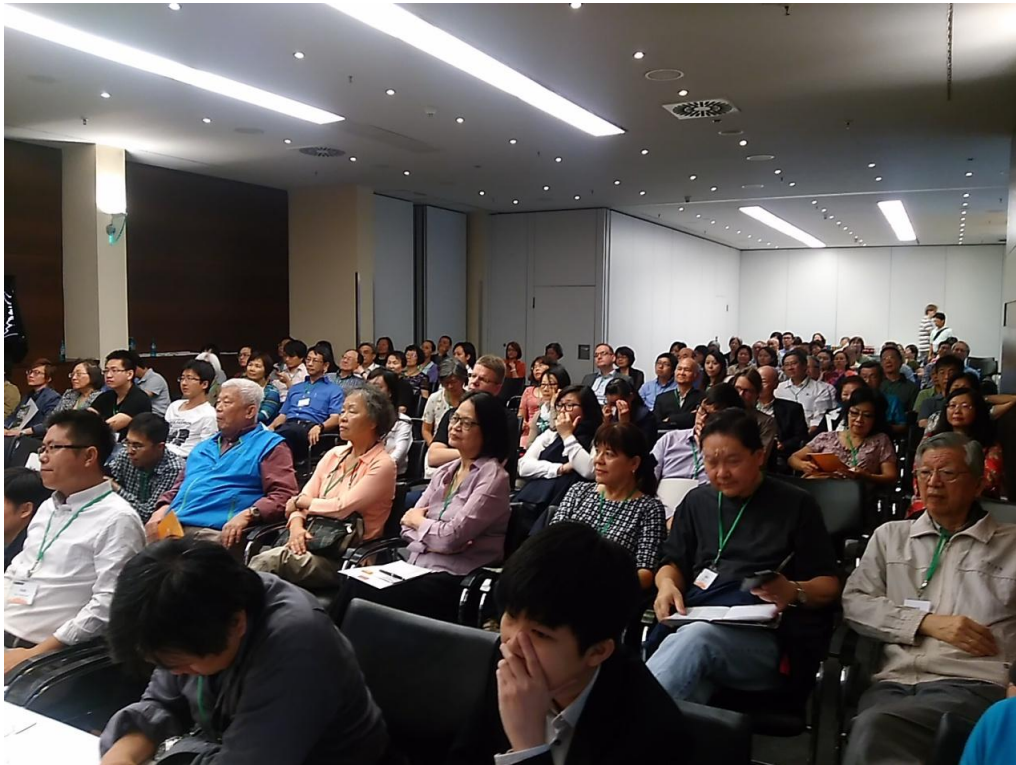
圖 1：出席「歐洲臺灣協會聯合會第 46 屆年會」人員聚精會神聆聽演講。