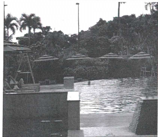
Mahaina Hotel 設施