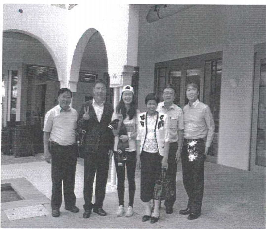
Mahaina Hotel 訪視學生