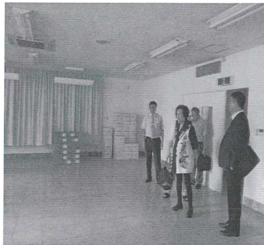
河崎會長介紹設施