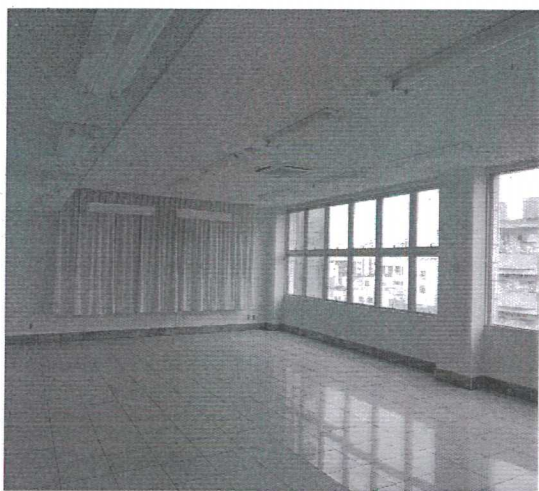
日本光伸集團琉球設施