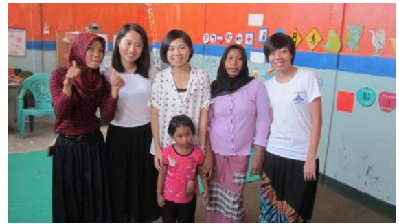
幼兒園的家長十分尊重老師，包括亦擔任教導工作的實習學生。