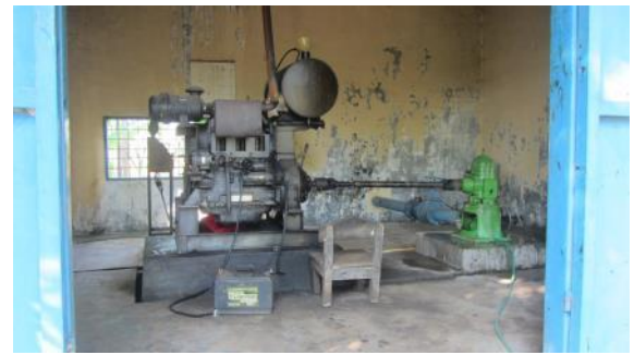
農場的源是透過深水井抽水而得，由於節電節水，資源十分寶貴。