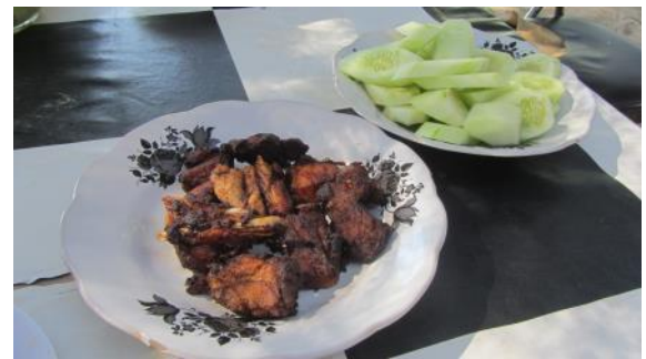
農場常見的食物--雞肉與小黃瓜。