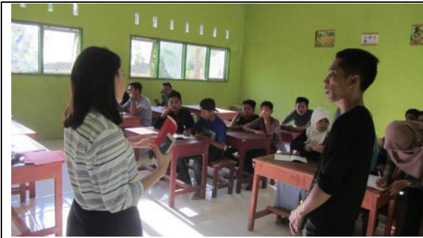
實習學生帶領農場年輕人瞭解華人文化的教學，右為協助翻譯的年輕人。