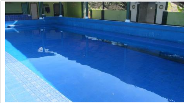
農場建造的游泳池，供應周邊貧苦的孩童，得以免費享受。