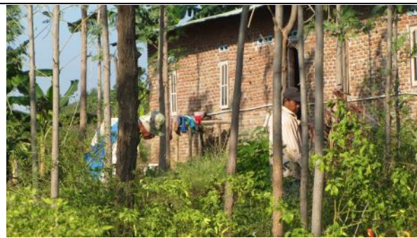
農場實施有機農作，工作者為當地居民。