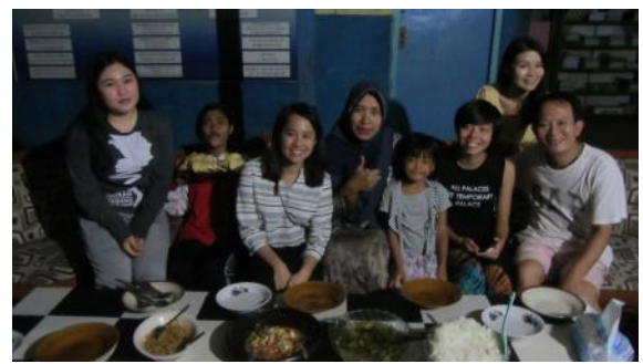
農場的客廳也是餐廳，是招待客人的重要地點。