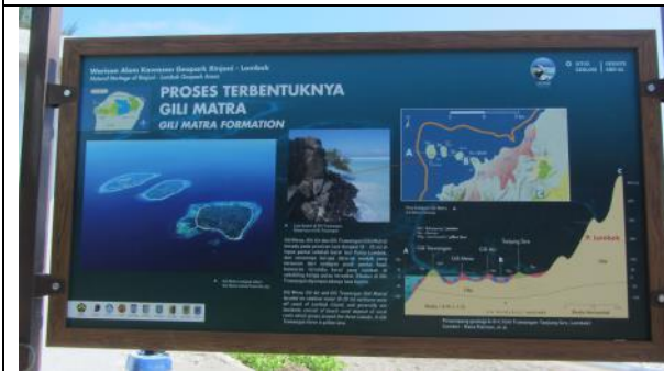
龍目島著名的渡假勝地為東北角的三個小島(Three Gilis)。