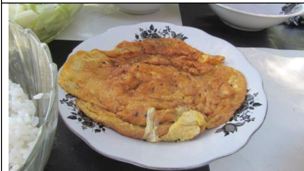
農場習慣烹煮農場生產的雞蛋，供貴賓食用。