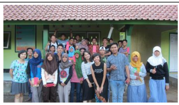
上完課，全員歡樂合影。