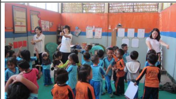
實習學生帶領農場幼兒瞭解華人文化的教學，透過音樂與唱跳。