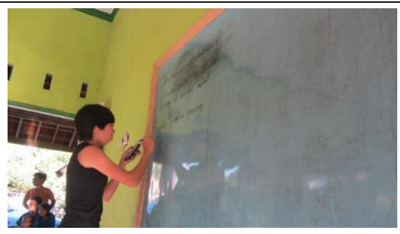
實習學生嘗試將印尼文寫在黑板，讓學習者理解。