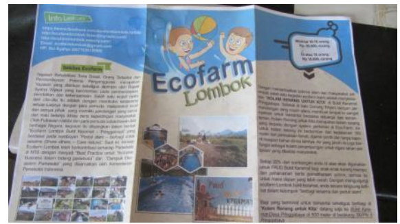
Eco farm 的英文摺頁。此農場已名列著名自助旅遊網站 tripadvisor 中。