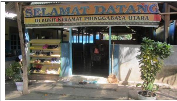
Eco farm 的正面，寫著印尼文“歡迎光臨”的字眼。