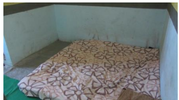
房間內部陳設十分簡單，實習學生也是住宿類似的生活環境，對台灣的學生來稍有刻苦，但體驗刻苦更是難得。