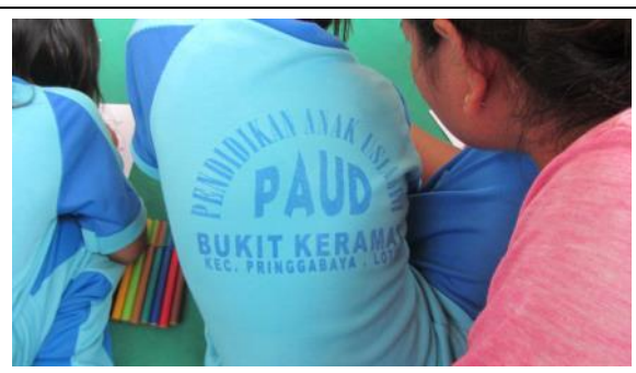
農場內的幼兒園是農場免費提供周邊貧苦孩子學習的場所，非常受到家長與孩子的喜愛。