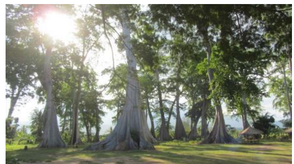
農場附近的觀光景點--- Lian tree 園區。