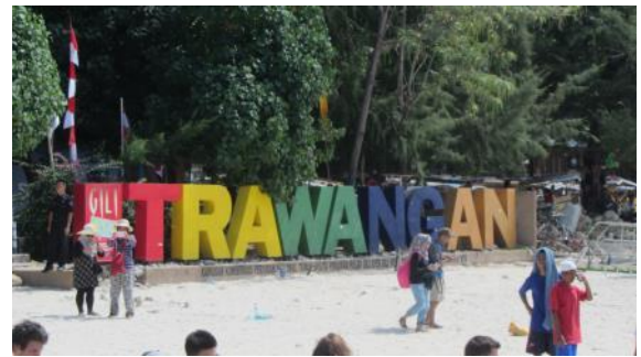
三座小島中最熱門的景點---Gili Yrawangan，遊客如織。