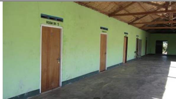
農場的房間可供體驗原始(Pro=poor)旅遊的遊客住宿。