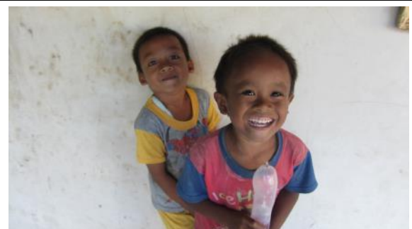
天真無邪的孩童，在農場中找到他們的依賴與方向。