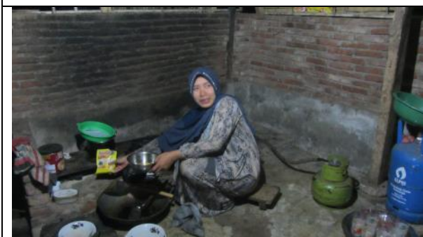
農場簡易的廚房，表達著龍目島生活狀的寫照。