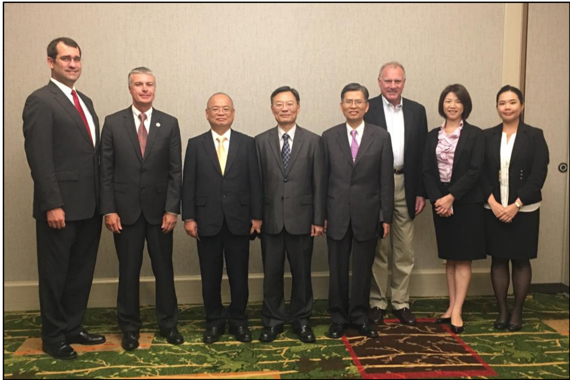
台灣代表團參加 2016 全美州檢察長夏季年會合影

全美州檢察長協會對於台灣代表團一向十分友好，今年在開幕儀式上，會長 Marty 即請全體代表團起立接受大的歡迎，並一如以往地在第一天會議的下午，安排對代表團的歡迎儀式，本代表團被安排緊臨在主桌旁，除桌上立有中華民國國旗外，並將另一中華民國國旗併列在美國各州州旗旁，且放在美國國旗之後即排列第二，足見對我代表團之友好及重視。會長先感謝代表團遠道而來參加會議，並強調與台灣的友好關係一直是 NAAG 非常珍惜的，也深信這份友誼會隨著雙方的交流與互訪而更加穩固。總長也感謝會長對於代表團的禮遇款待，以及每年誠摯地邀請我方與會，讓我們有機會能夠了解美國當今的法律議題、重要政策及未來展望，最後雙方互相也交換禮物並合影留念。