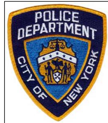
紐約市警局的臂章

紐約市警局下轄多個特殊職能部門，包括戰術行動小隊、警犬培訓(K-9)、港口巡邏、空中支援、拆彈小組、反恐、罪犯情報、打黑、緝毒、公共運輸以及房屋管理。紐約市警局擁有豐富的犯罪現場調查及實驗室分析資源，另外還有專門協助打擊電腦犯罪的網路小組，其總部設在紐約警察局廣場(One Police Plaza)，設置打擊犯罪的電腦網絡，用以協助警探完成調查的巨大搜尋引擎和資料庫。紐約市警局對自己的任務期許，就是「執法、維和、減少恐慌，並提供一個安全的環境」(Enforce the laws, preserve the peace, reduce fear and provide for a safe environment)。