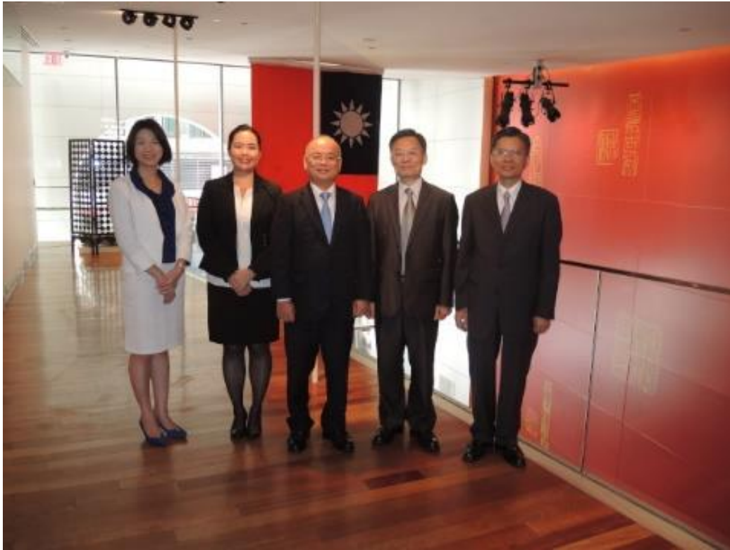
代表團於駐紐約台北經濟文化辦事處合影

總長在訪談間表示，紐約之行收穫頗豐，他期待在夏季年會中與更多州之州檢察長、法律人士交流，為完善台灣法務制度取經。今年年會主題為「社區互動與個人隱私保護」，而這也是目前台灣法務部面臨的問題。「隨著時代變遷，越來越多人重視個人隱私保護，台灣有『個人資料保護法』，但細則如何規定，怎樣能與『政府資訊公開法』相互平衡，都是目前我們面臨的問題。總長表示，年會上，美國各州檢察長、法律人士都會分享在保護個人隱私與公開信息方便如何取捨、兩全的經驗，相信值得台灣加以借鑒 8 。