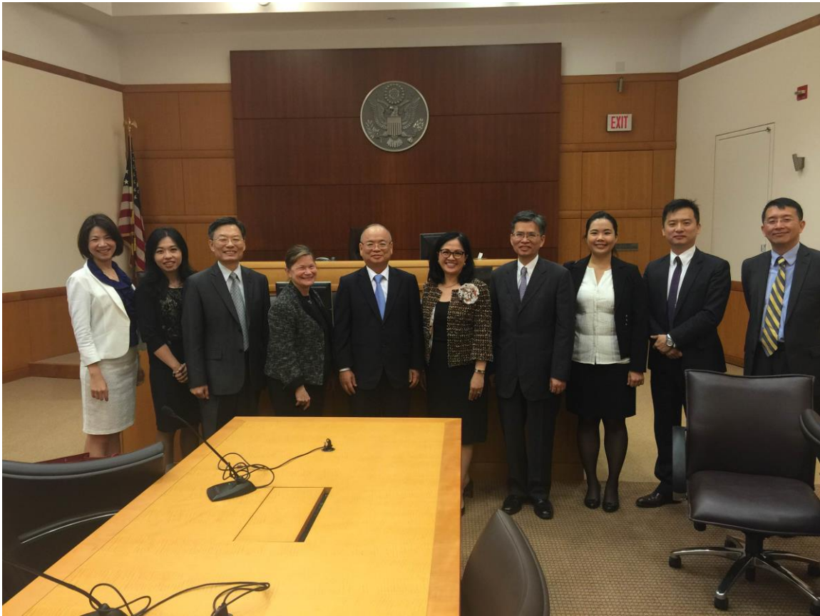
代表團在紐約聯邦東區法院與華裔法官郭佩宇合影

當然，上述兩種法官的工作內容仍有些許差異，例如某些特定重大案件依照法律規定僅能由憲法法官審理，而治安法官則負責核發搜索票及決定羈押、交保等程序。郭法官分享由於近年來美國監獄大幅超收，已經不堪負荷，所以當她在決定是否要羈押一個人的時候，需要考量到非常多層面，包括考量被告是否確有羈押必要，是否有其他替代方案，例如電子監控等。此外，她也會避免讓被告僅因為無法支付交保金而被羈押，因為她認任何人都不能因為貧窮而失去自由，但這也不代表任由被告自行離去，而是以其他方式，例如上述電子監控或是其他配套措施加以監控其行動。