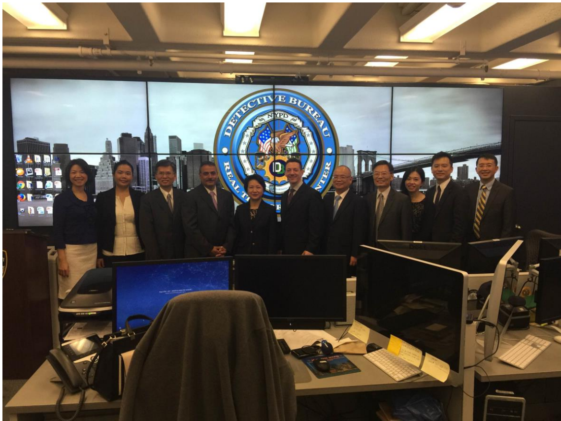
代表團在紐約市警局 Facial Recognition Unit 合影

此外，社交軟體上的照片，像是 FACEBOOK 、INSTAGRAM 等，也可以透過照片修復技術，進而連結至與嫌疑人關係親密的家人或朋友，以此方式尋找並鎖定特定嫌疑人。不過，講者強調，藉由此種技術模擬所得到的照片，只能作為用來特定嫌疑人的輔助手段，並無法作為可以合法逮捕的相當事由(probable cause)，警方還需要蒐集其他的證據才能對嫌疑人進行逮捕。