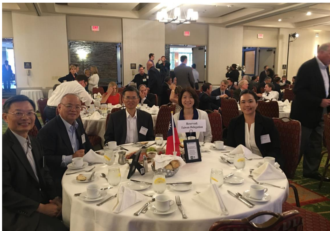
台灣代表團參加 2016 全美州檢察長夏季年會合影

我國檢察首長受邀參加全美州檢察長協會夏季年會已有多年歷史，雙方長期以來互動良好，除我方檢察首長組團赴美參加夏季年會外，歷年來約每兩年亦有多位美國州檢察長來台訪問。每年參加全美州檢察長夏季年會時，我方代表團均得藉此機會瞭解美國當前最受關切之新興犯罪、關心之議題、打擊犯罪最新對策及美國最高法院判決分析等等，並順道參訪檢察機關、法院、矯治及警察機關等業務相關機關，觀摩借鏡，交換意見，實有助於我國檢察首長拓展國際視野，並得以觀摩認識雙方檢察業務之異同及政策走向，更可進行意見交流，建立兩國司法人員聯繫管道，誠為寶貴之經驗。