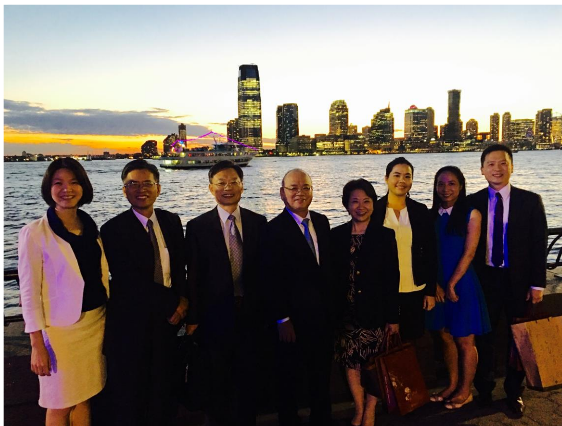
代表團於餐廳外河畔合影

陪審團做完了事實的認定，也就是認定被告是有罪或是無罪後，縱算被告是可以上訴的，實務上二審是很少會推翻一審事實認定的結果，除非是有明顯法律上之違誤。因為陪審團的權利是來自於憲法及全體人民，不能僅因法官一人之力而全面否決此結果。透過此次的餐敘及本日下午參訪法院的座談，可以發現陪審團制度在美國確屬該司法制度之精神堡壘，或許沒有一個制度是完美的，但美國選擇以陪審團制度為中心，所有的配套措施就全部以此制度的精神作為考量。但陪審團制度實際上在審理一個案件時是需要花費大量的人力、金錢及時間，因此真正進入到陪審團的案件僅占全部案件的百分之一或二，但在這個制度下，大家就傾全力去審理此百分之一或二的案件。或許現在無法斷言陪審團制度是否真的比較好，但從美國實行此制度百年後的現在來看，可以說一個制度之存續，是需要多方的思考及配套措施始能完成，而在設計制度的過程中，必須要堅持的是該制度的精神－在陪審團制度中就是讓人民審理並認定事實的概念，而非僅是擷取某個部分即實行，如此一來失敗的機率也會更大。