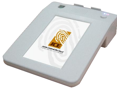
1.- Dispositivo para el Registro de Concurrentes (DRC)

En las Elecciones del 2016, se instalarán equipos que permitirían automatizar los procesos que realizan los miembros de la mesa.