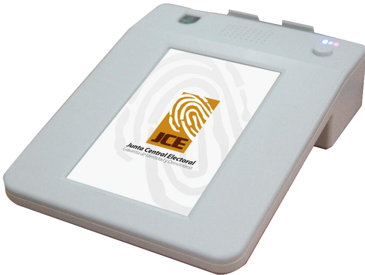
Dispositivos Registro de Concurrentes DRC

Cada mesa electoral tendrá una unidad de verificación de huellas, que permitirá de forma ágil validar los datos del ciudadano en el padrón electoral.