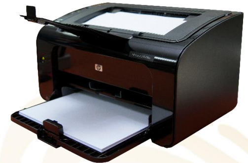
3.- Impresora de Relaciones de Votación de Resultados