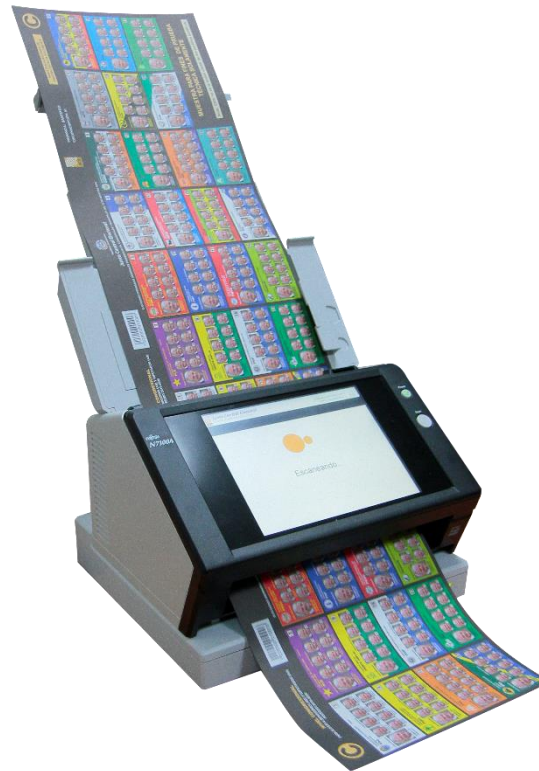
2.- Unidades de Conteo de Votos Automatizado (CVA)