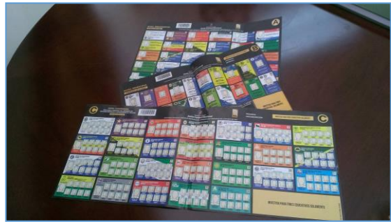
本次選舉每位國內選民可領到 3 張選票

採絕對多數 2 輪投票制，若第一輪投票無候選人獲得半數以上選票，則於 1 個月後舉行第 2 輪投票，由第 1 輪選舉中得票前 2 名之候