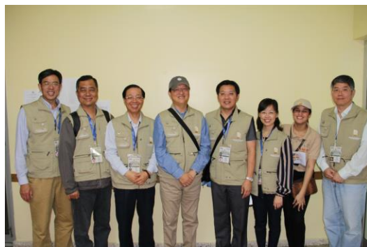
我國觀選團代表前往投票所觀察

下午返回住宿飯店，晚間參觀聖多明哥市境內開票所之開票情形，並前往設置於 Hotel Dominican Fiesta 的中央選情中心參觀。