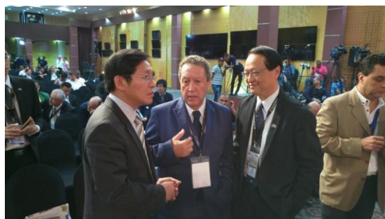
陳副主任委員(左 1)與瓜地馬拉前總統 Vinicio Cerezo(中)意見交流

駐多明尼加共和國大使館湯大使繼仁為專業與熱忱兼具的外交官，在湯大使領導下，駐館同仁均展現主動積極之態度，並與多國相關機關人員互動密切，可見外交工作的成功推展。此行觀選期間湯大使不僅親自陪同參與相關活動，並於選前安排觀選團代表拜會多國最高選舉法庭主席