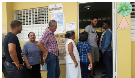
民眾排隊等候進入投票所投票

本次多明尼加共和國大選，係合併舉行總統、副總統、國會議員、中美洲議會議員、地方政