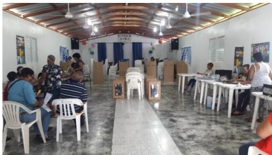
設置於教堂內的 2 個投票所(左右各 1)

多明尼加共和國前次國會議員選舉於 2010 年舉行，前次總統選舉於 2012 年舉行，為使國會議員與總統、地方公職等選舉於同一年舉行，將國會議員選舉延後