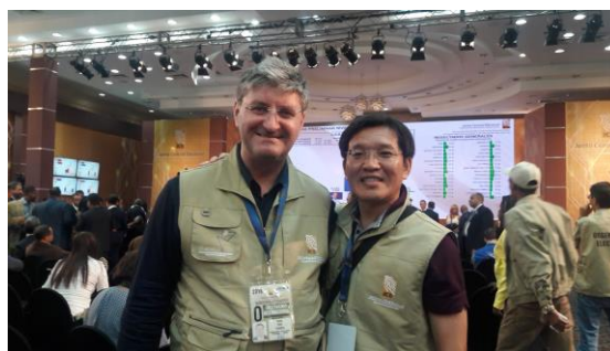
陳副主任委員與羅馬尼亞選舉委員會處長合影

而多明尼加共和國中央選舉委員會現為 A-WEB 主席國官署，本會為 A-WEB 會員，並與多國中央選舉委員會擁有良好之互動關係，本次該會舉辦國際觀選活動，計有來自世界各國約百餘名觀選代表參加，均住宿於 Renaissance Santo Domingo Jaragua Hotel，本會觀選代表或於飯店大廳、或於會議現場、或於用餐餐廳、或於中央選情中心，均積極與他國選舉管理機關代表進行意見交換，藉此建立人脈，加強與非邦交國選務機關間