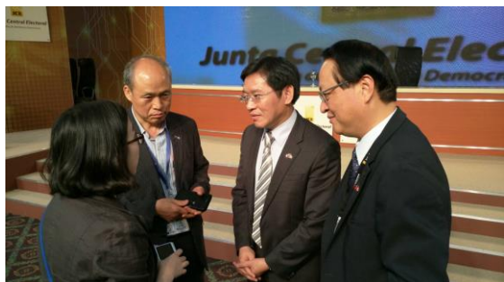
陳副主任委員(右2)與 A-WEB 秘書處尹處長(左2)意見交流

A-WEB 係我國以「Central Election Commission, Taiwan, R.O.C」名義加入之國際性選舉組織，依據 A-WEB 會章，其成立目的不僅在於會員間資訊之分享，也期望透過對話及實際行動，共同致力推動國際