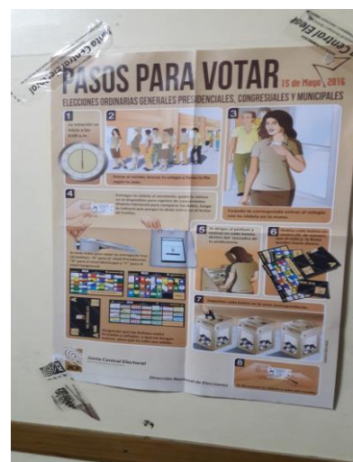
張貼於投票所外之投票指南