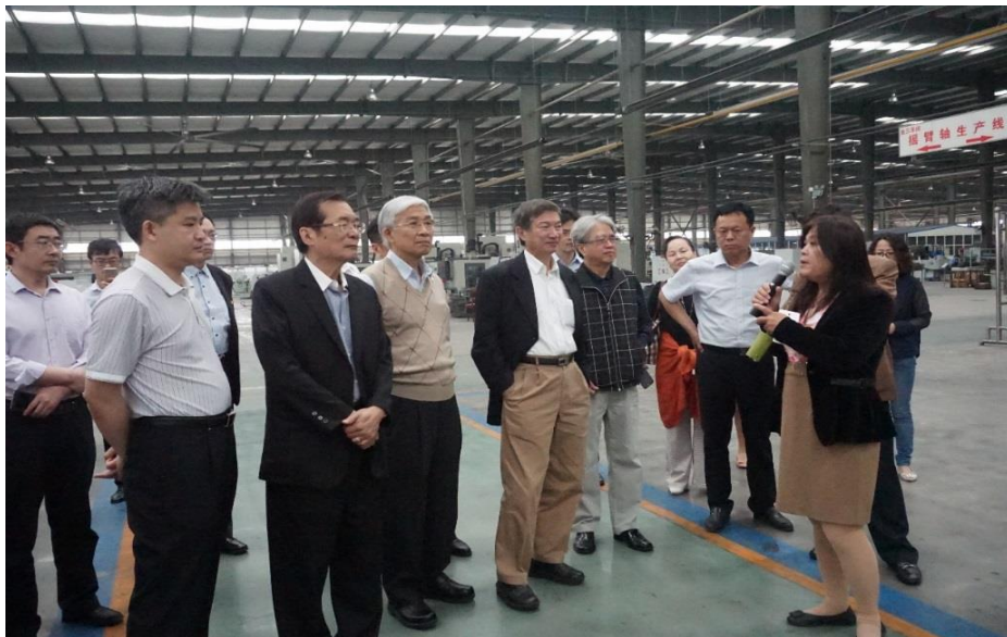
參觀河北四達電機 重型特種電機廠房