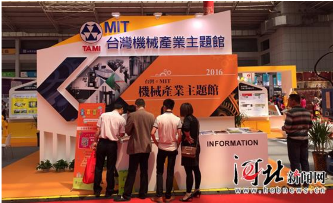
邯鄲臺灣名品博覽會中機械產業主題館