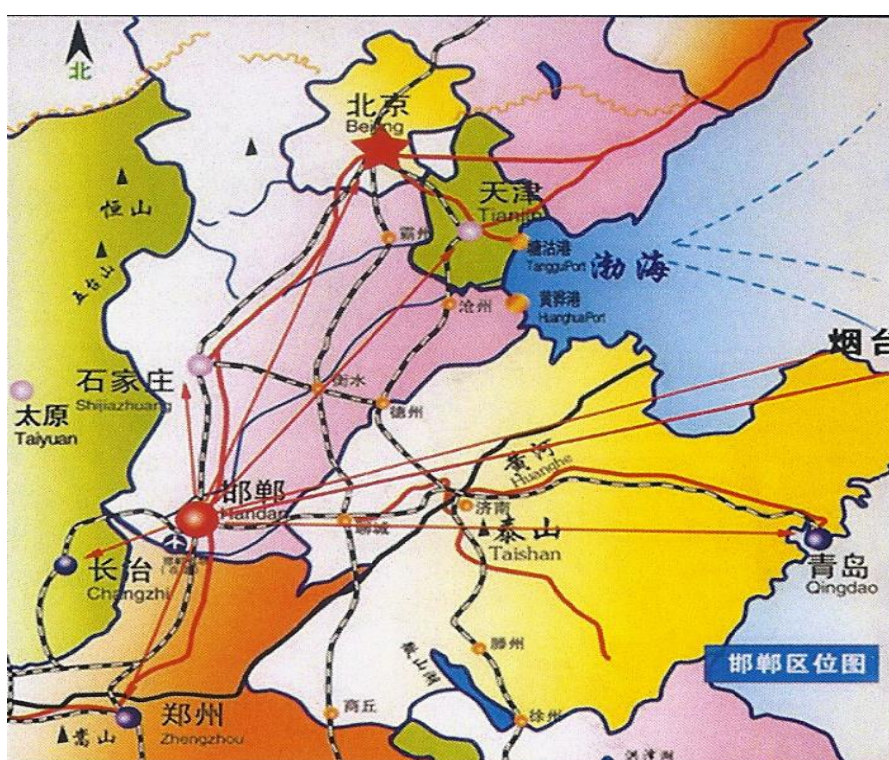
圖三 邯鄲市的地區 交通位置圖

2012 年中國大陸國務院明確提出邯鄲成為在中原經濟區內具有重要影響力的中心城市，邯鄲市總面積 1.2 萬平方公里，人口 1,100 萬，位在河北省南部，是河北、山東、山西及河南四省之交匯處，與石家莊、太原、濟南、鄭州等四個省會的距離約 200 公里，與北京、天津的距離約 450 公里，是四省交界區唯一具有海陸空立體式交通樞紐城市，地理位置優越，為中國大陸三大經濟圈（長三角經濟圈、珠三角經濟圈及環渤海經濟圈）所環繞，被定為「京津冀區域性中心城市」及中原經濟區（包括 4 省 13 市）與環渤海等經濟區域合作交流的北部門戶（詳圖三）。