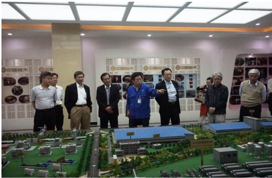
參觀中國恒天邯鄲 紡織機械有限公司