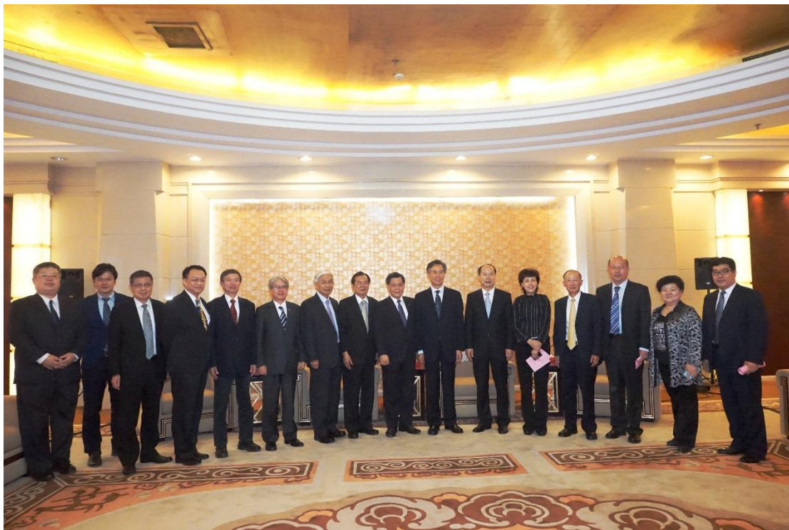
經貿團團員與河北省及邯鄲市領導等座談會後合影