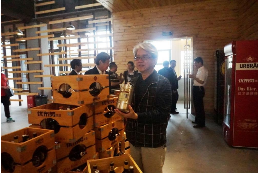
參觀優布勞（中國）啤酒有限公司