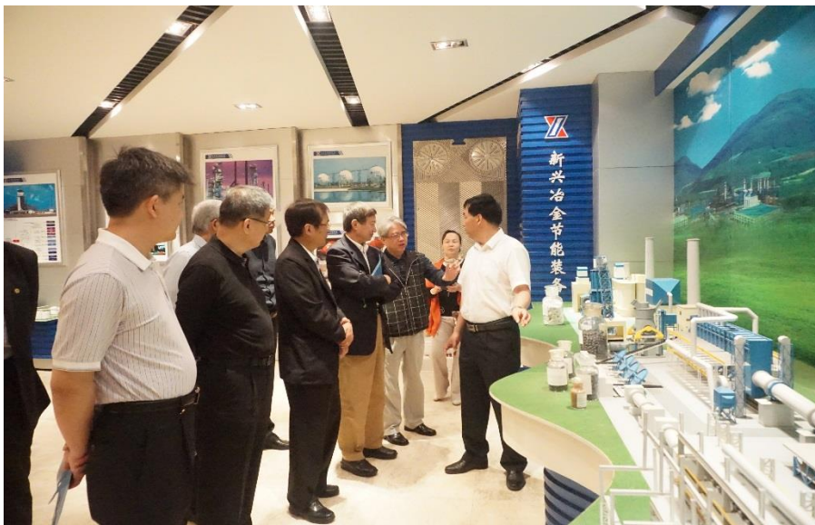
聽取新興能源裝 備股份有限公司 介紹該公司生產 設備