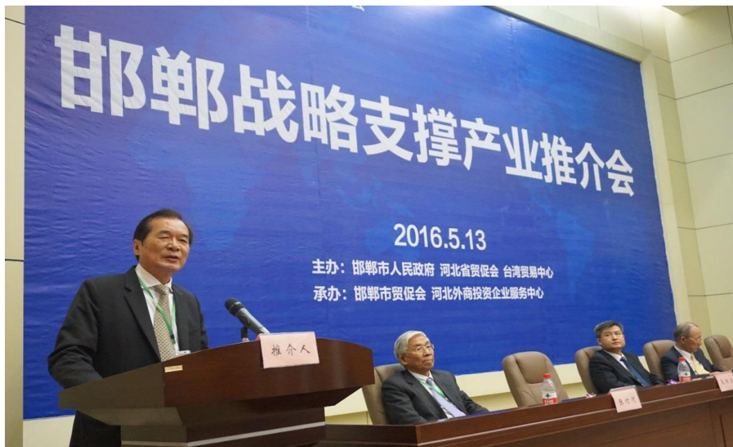
邯鄲戰略支撐產業推介會由臺灣機械工業同業公會名譽理事長徐秀滄致詞

由邯鄲市經濟技術開發區管委會及邯鄲市商務委共同舉辦之「邯鄲戰略支撐產業推介會」，邀請臺灣機械工業同業公會徐秀滄名譽理事長致詞，邯鄲市委常委、副市長王進江主持，河北邯鄲經濟技術開發區管委會副主任李文凱及中國國際商會邢臺商會秘書長焦連群介紹開發區產業發展重點及招商引資政策說明。