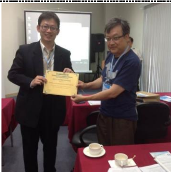
與議程主持人合影