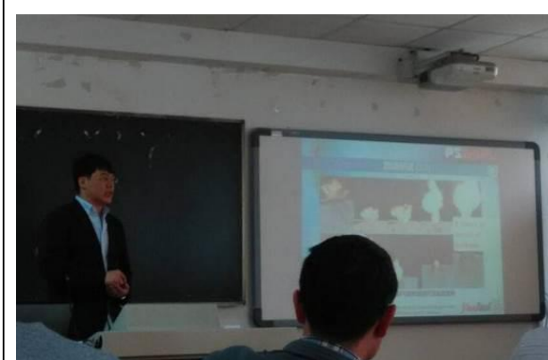
於南京工業大學進行學術報告 2