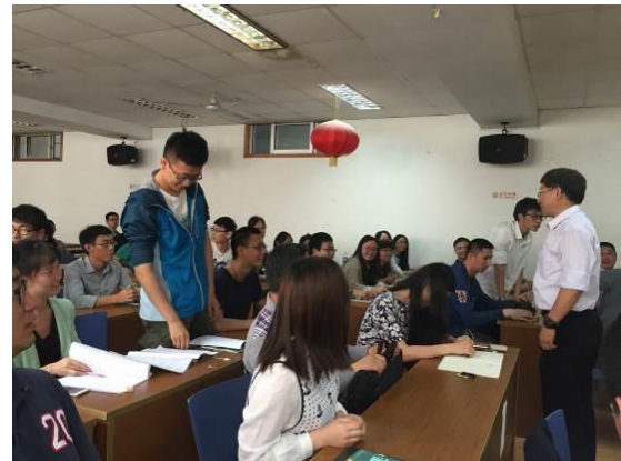
於南京工業大學進行學術報告 3