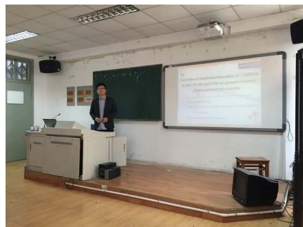
於南京工業大學進行學術報告 1