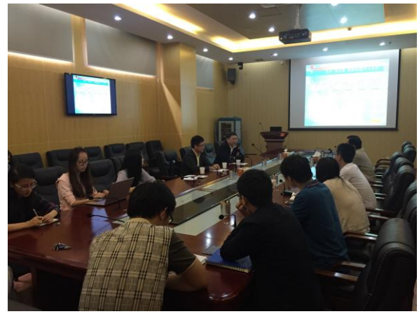
與中國科學技術大學進行學術交流