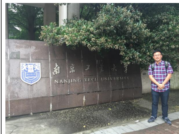
參訪南京工業大學