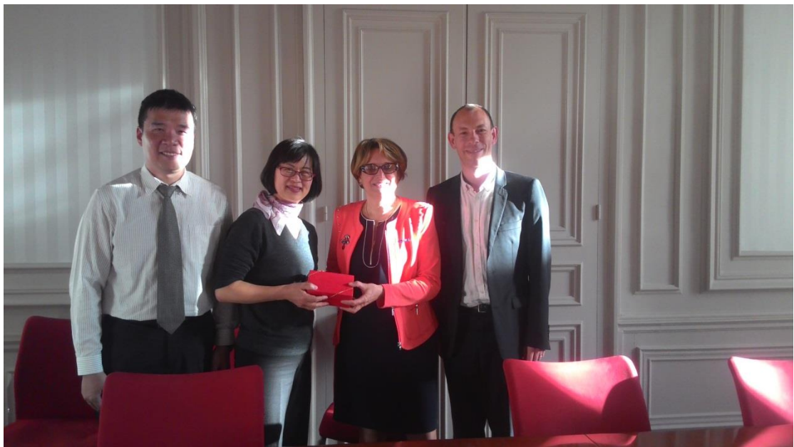
5月3日拜會法國全國家庭協會聯盟 (UNAF)