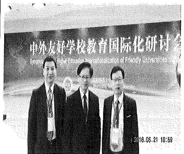
參加瀋陽師範大學教育國際化研討會