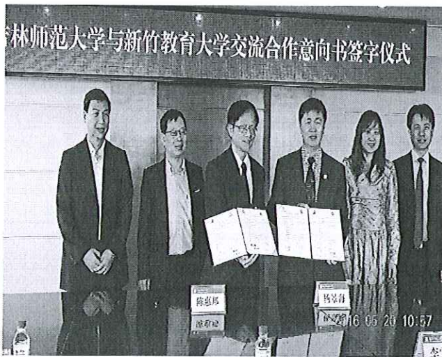
陳惠邦校長與吉林師範大學校長簽約合影