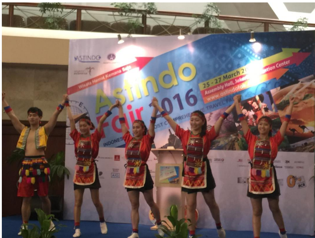
本局表演團體於大會開幕表演