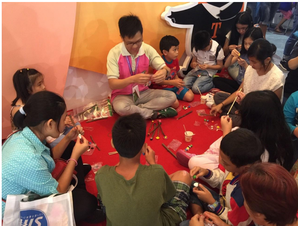
休閒農業發展協會現場 DIY 教學