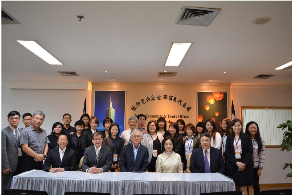
代表團拜會駐印尼台北經濟貿易代表處