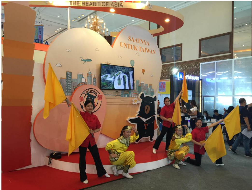
臺灣館主舞台表演