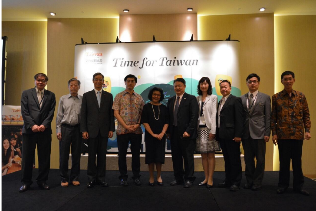
業者餐會與會貴賓