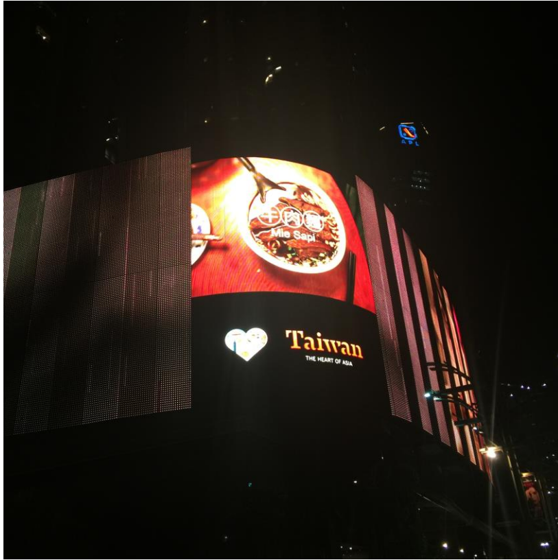
蘭花廣場大型戶外廣告