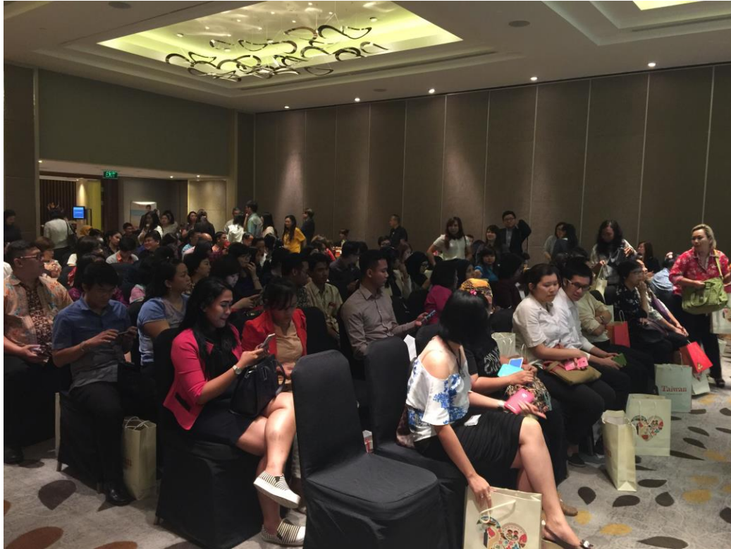
當地業者熱烈參與推廣會