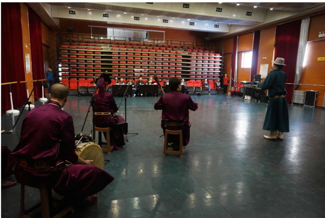
內蒙古自治區赤峰市巴林右旗審看烏蘭牧騎歌舞團來臺演出節目