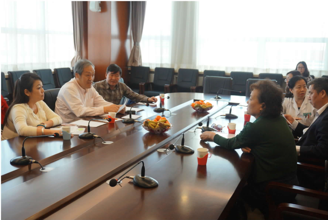
內蒙古自治區人民醫院商談本年臺灣醫療團前往內蒙古自治區交流計畫