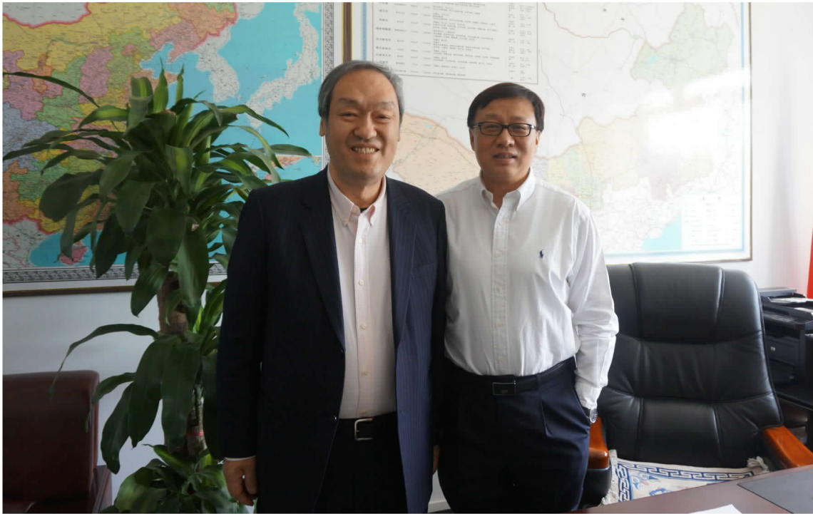
拜會內蒙古自治區政府衛生和計劃生育委員會歐陽曉暉主任