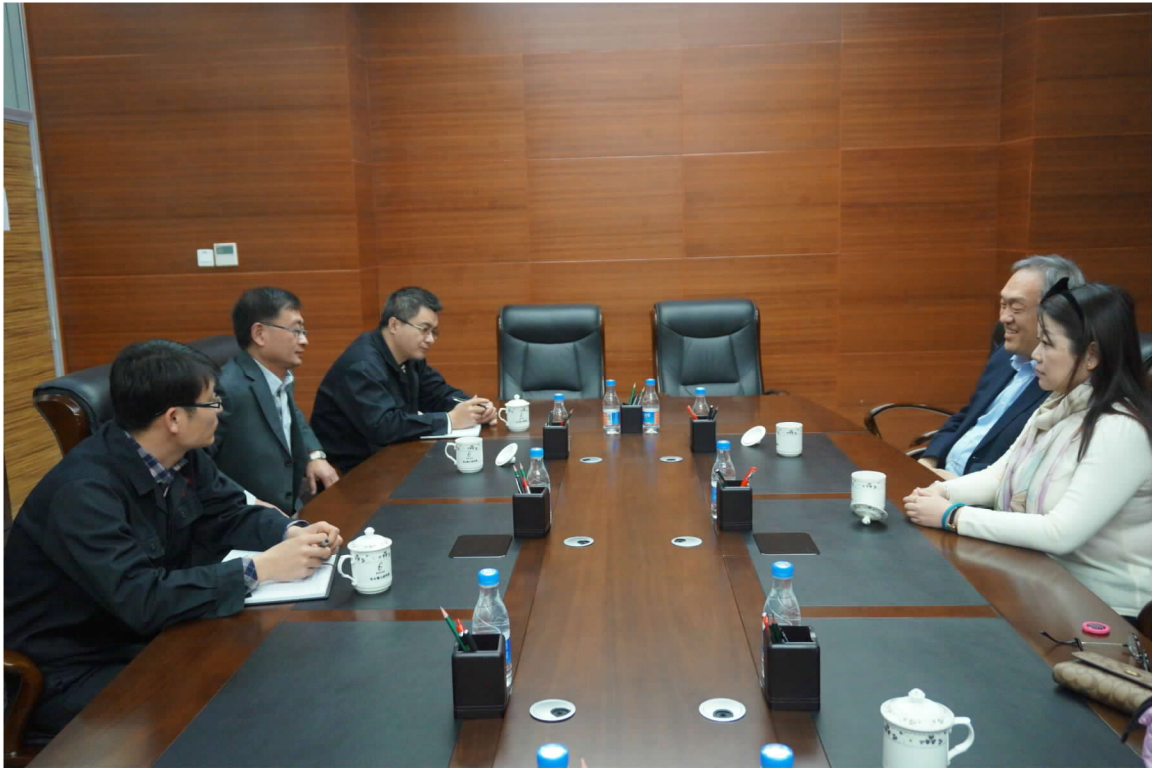
拜會包頭稀土研究院商討兩地未來合作事宜