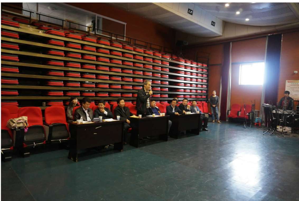
審看烏蘭牧騎歌舞團來臺演出節目試演完畢，本會海中雄處長提出意見