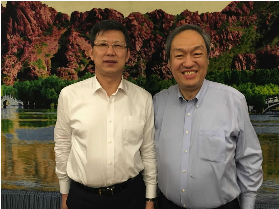
拜會內蒙古自治區赤峰市政府孟憲東市長