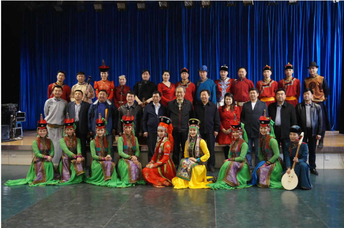
烏蘭牧騎歌舞團來臺表演節目試演結束後，演員與審看人員合影留念