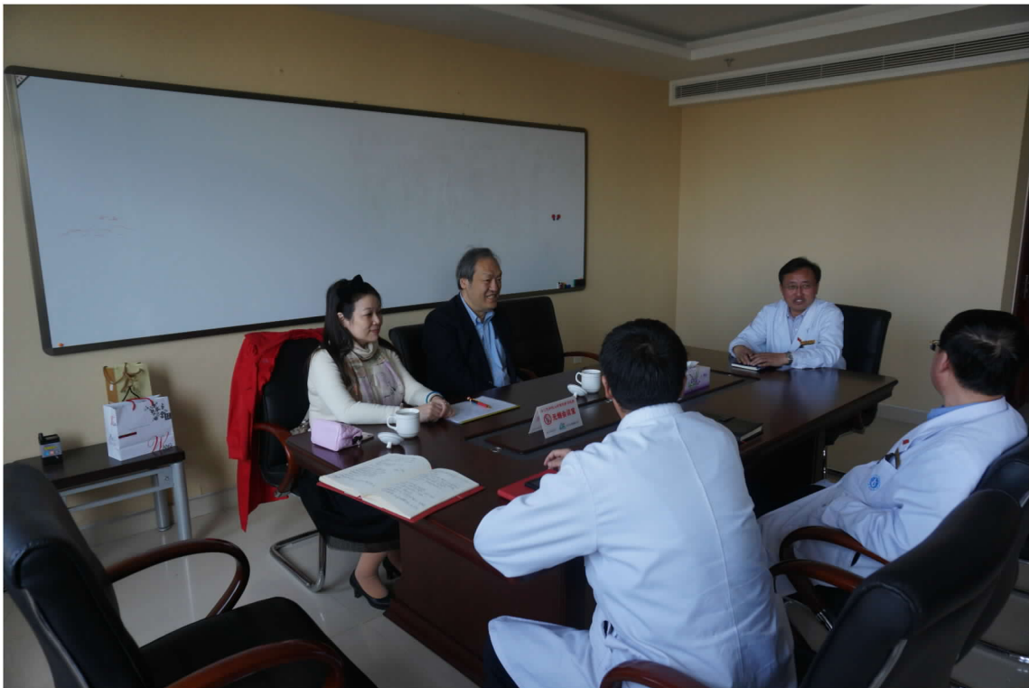
包頭市包鋼醫院商談該院醫師來臺觀摩見習事宜