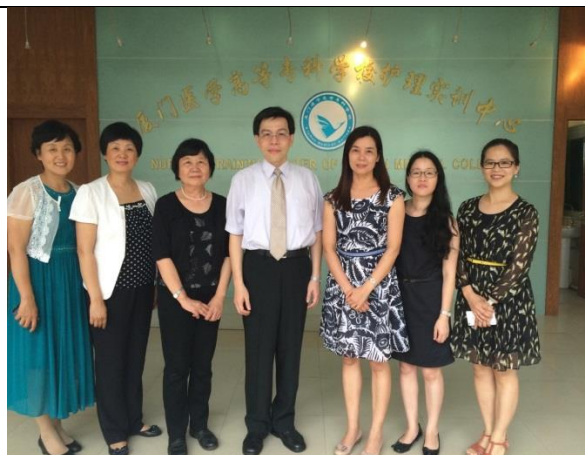
圖 4：廈門醫高專護理實驗中心