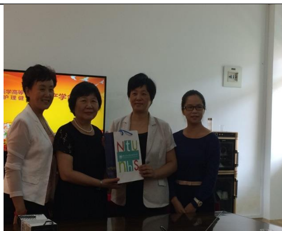
圖 2：與廈門醫高專院長等合影