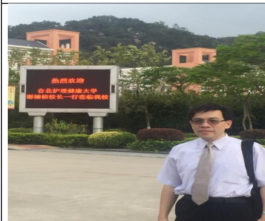
圖 3：廈門醫高專校景