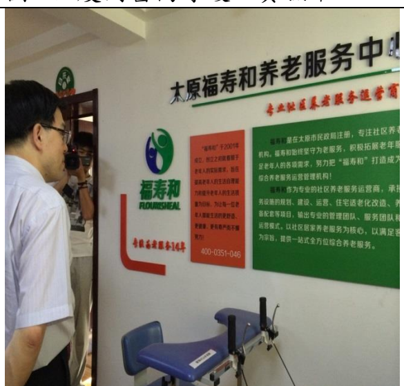
圖 6：山西太原長照機構參訪