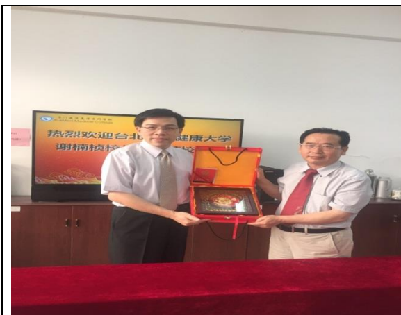
圖 1：拜會廈門醫高專校長