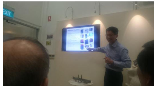
(圖八)南洋理工大學解說