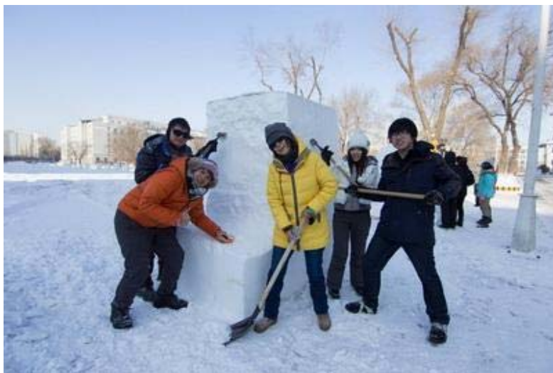
(▲團員辛苦雕刻的過程)