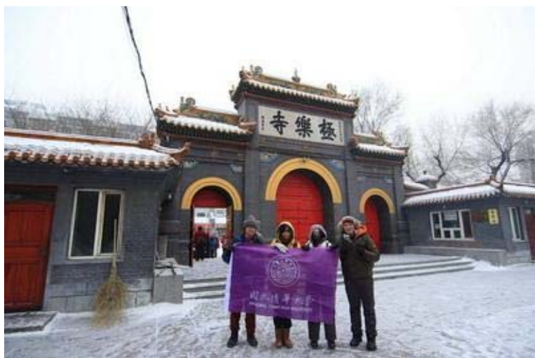
(▲東北四大名寺之一—極樂寺)