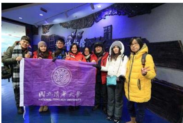
(▲哈工程船舶博物館)