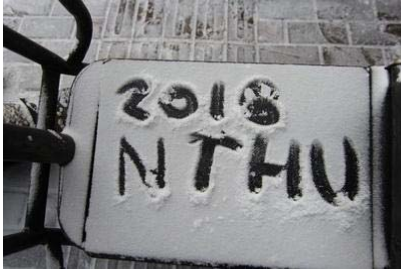
(▲團員們在雪上留下清華的影子)