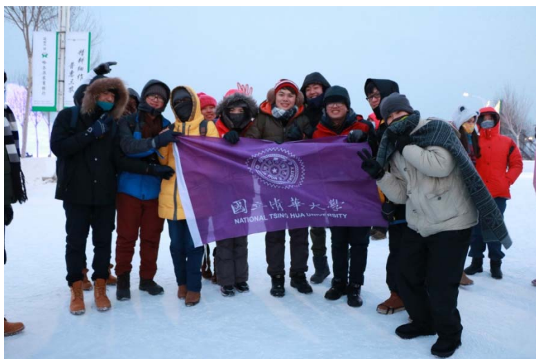
(▲各校團員們與校旗的合影)