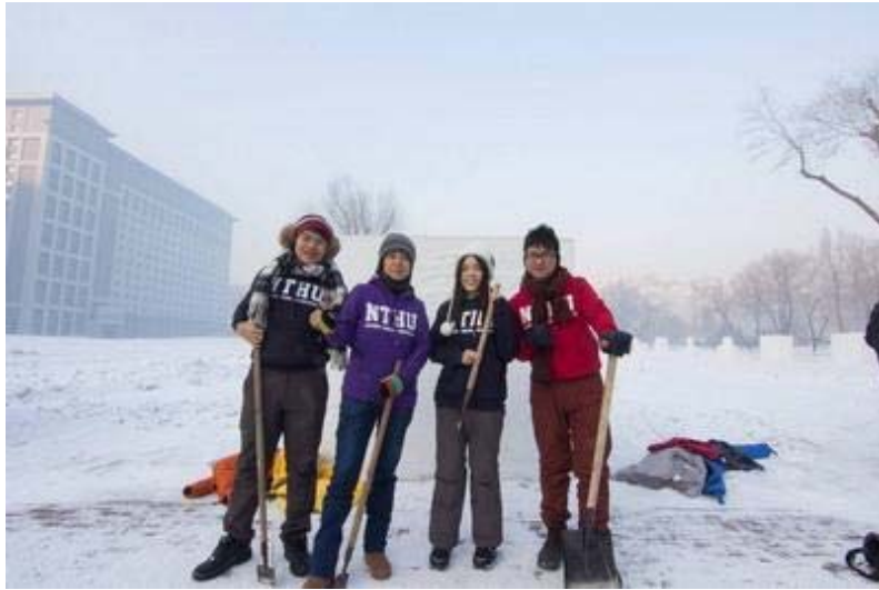
(▲雪雕開工前的合影)