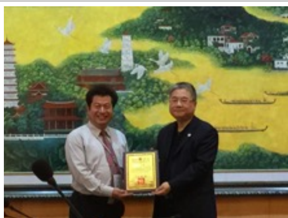
金大董樂院長與福州大學交換紀念品