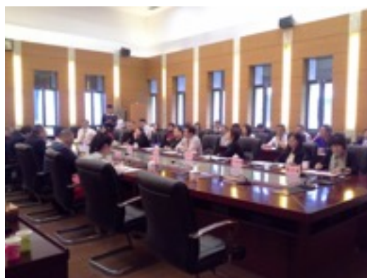
廈門大學會議交流