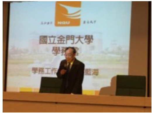
金門大學黃校長致詞