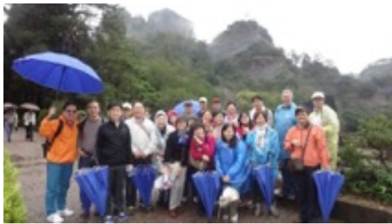
武夷山天游峰前合影