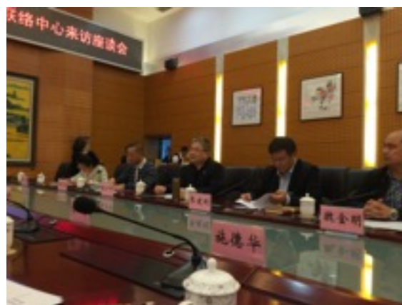
與福州大學交流會議