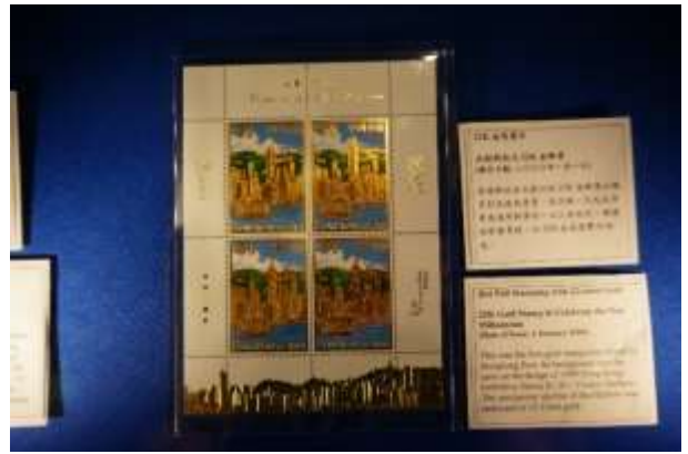
圖 70：特別效果郵票(十)