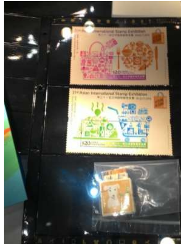
圖 52：香港郵品展示櫃(六)