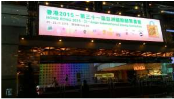
圖 7：香港國際會議中心入口處 (標示郵展招牌)