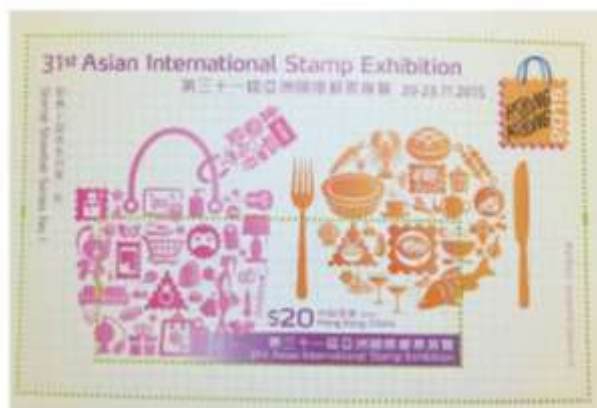
圖 3：郵展郵票第一號