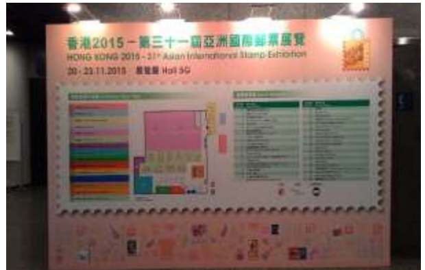
圖 10：香港國際會議中心大廳 (標示郵展活動節目)