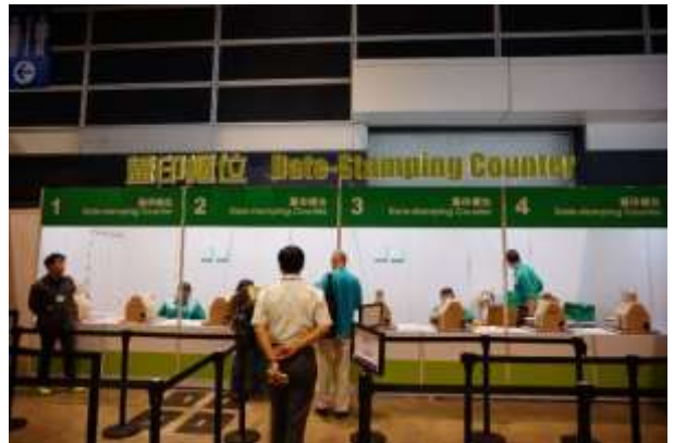
圖 40：香港郵政臨時郵局(蓋印櫃位)