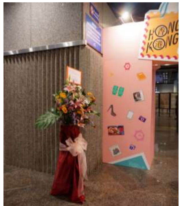
圖 20：5G 展場出入口處(二)唯一的花束