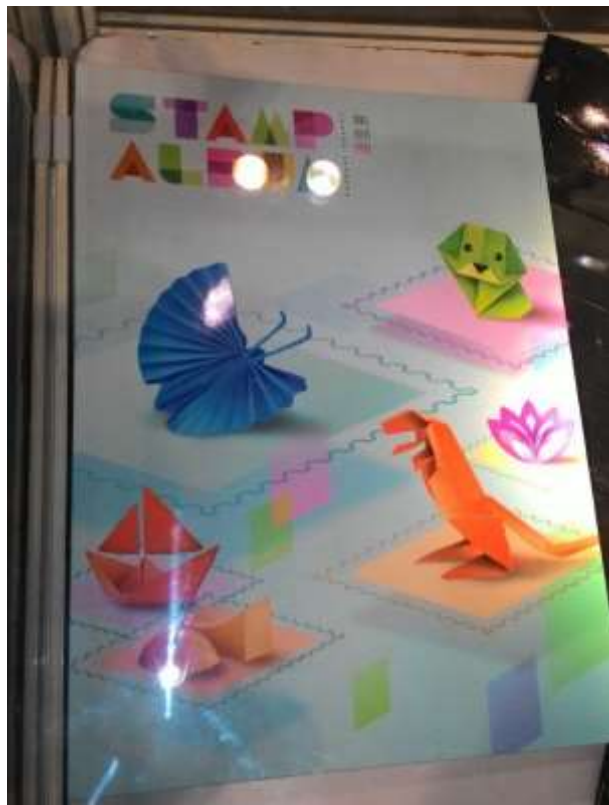
圖 51：香港郵品展示櫃(五)