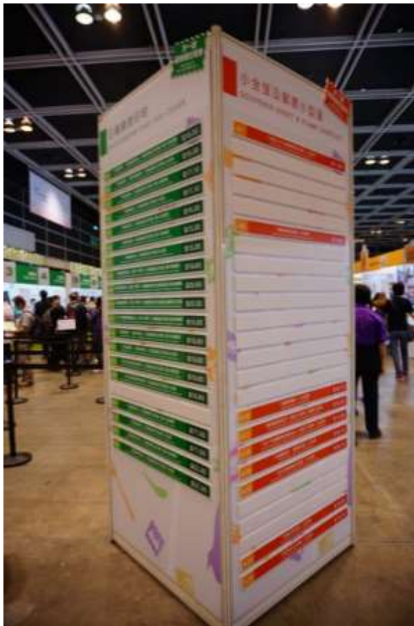
圖 45：香港郵政銷售票品公告柱(一)