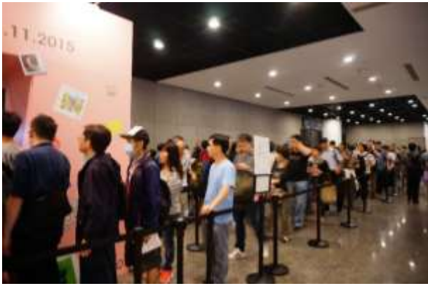
圖 23：郵票發行日展場外排隊情形