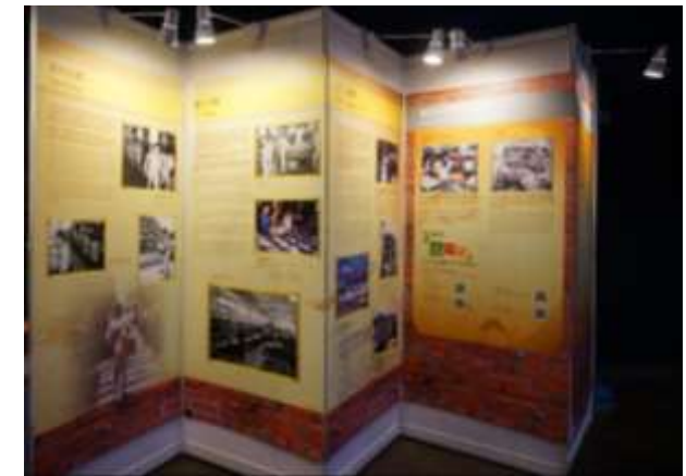
圖 26：展場入口處展示香港的歷史介紹(二)