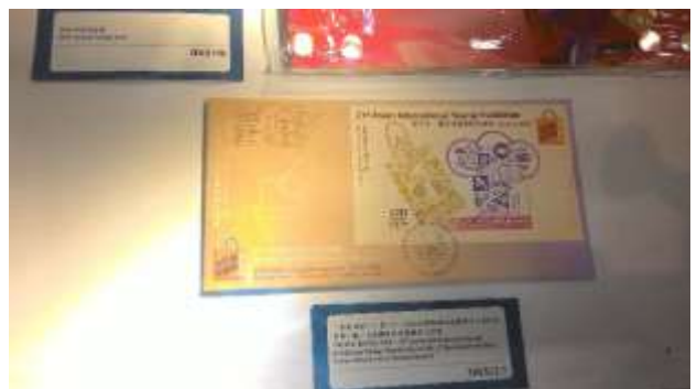
圖 54：香港郵品展示櫃(八)