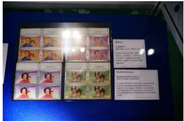
圖 64：特別效果郵票(四)