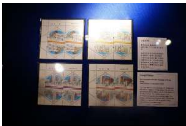
圖 65：特別效果郵票(五)