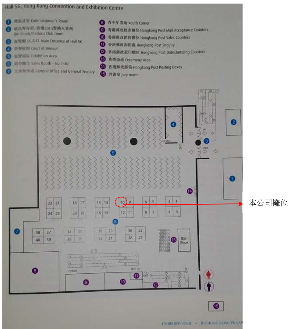
(展場平面圖：香港亞展資料)

香港郵政於展場最左側設有投寄櫃位、銷售櫃位、蓋銷櫃位、郵品展示區及詢問處。除競賽類郵集展示區、榮譽展示區、攤位區外，另有青少年園地及演講區(典禮場地)等。展場未設郵資票出售機，不似我國 104 年 4 月之亞洲國際郵展設置多部，讓集郵人士趨之若鶩，常現排隊人龍。各區配置簡圖如下：