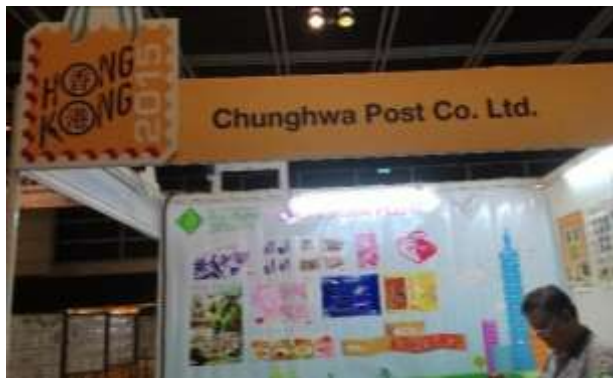
圖 15：本公司攤位布置 (三)