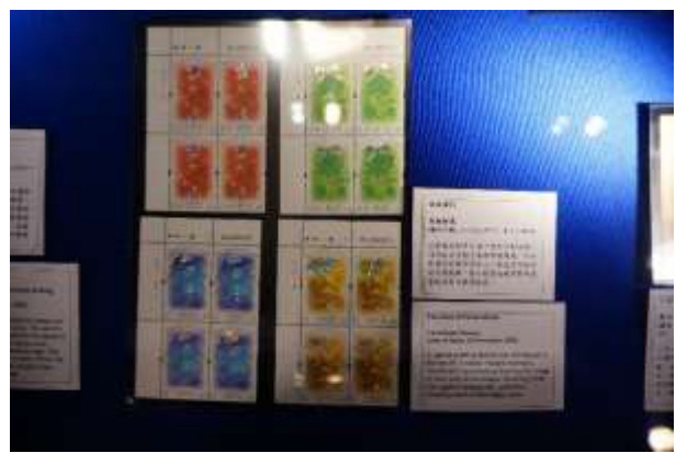
圖 66：特別效果郵票(六)