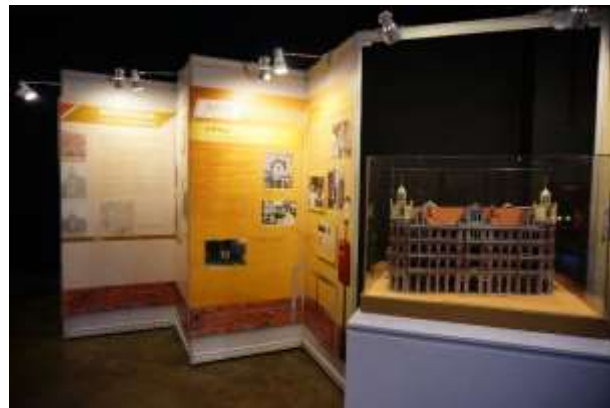
圖 25：展場入口處展示香港的歷史介紹(一)