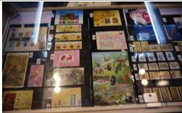
圖 17：本公司攤位銷售的郵品(一)