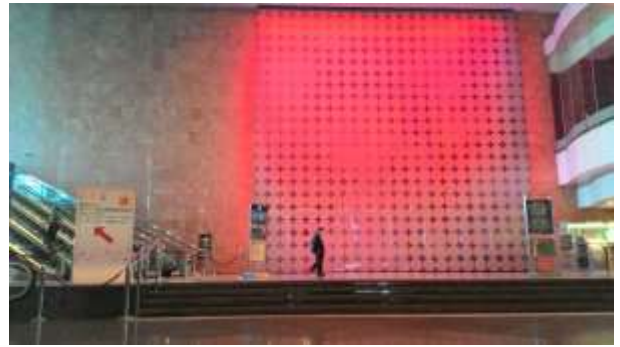
圖 8：香港國際會議中心大廳 (標示郵展方向)