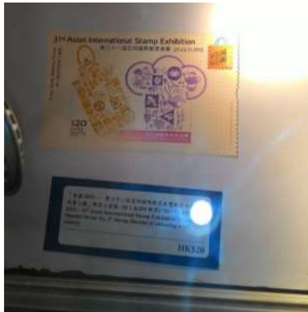
圖 49：香港郵品展示櫃(三)