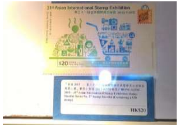
圖 48：香港郵品展示櫃(二)