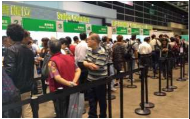
圖 24：展場內銷售排隊情形