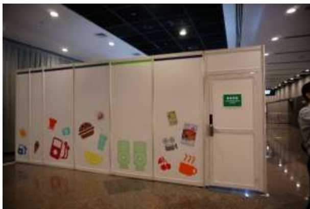
圖 11：徵集委員室(在 5G 展場外)