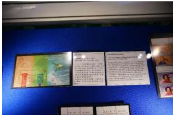
圖 63：特別效果郵票(三)