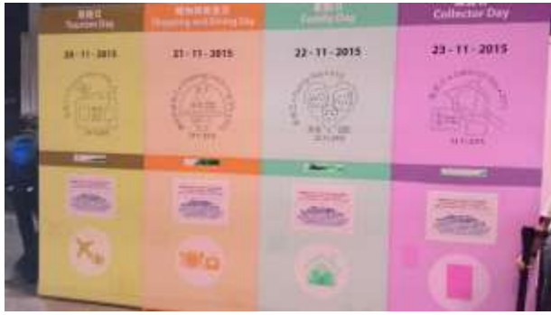
圖 43：每日郵戳介紹看板