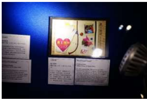
圖 67：特別效果郵票(七)