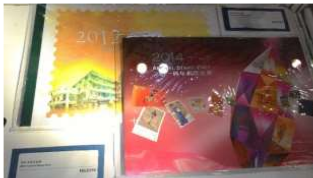
圖 53：香港郵品展示櫃(七)