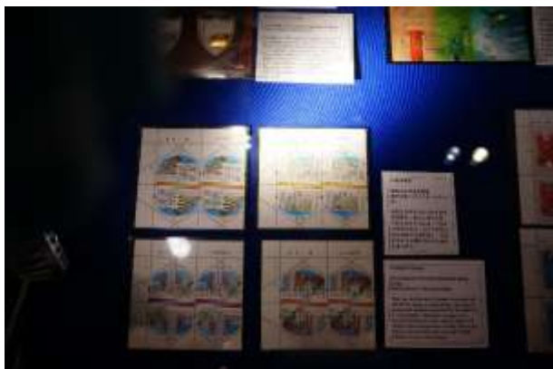
圖 61：特別效果郵票(一)