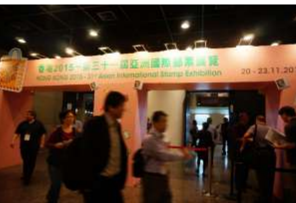
圖 21：5G 展場出入口處(三)