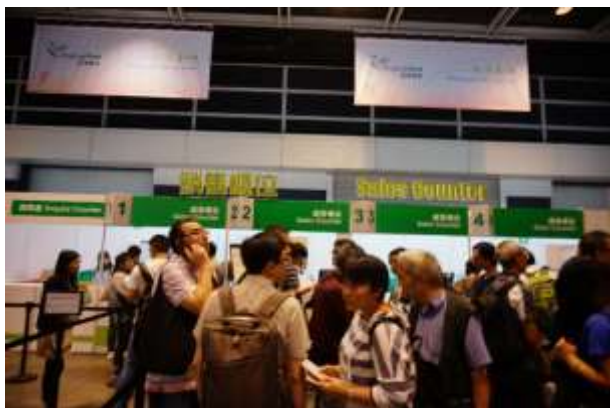
圖 41：香港郵政臨時郵局(銷售櫃位)