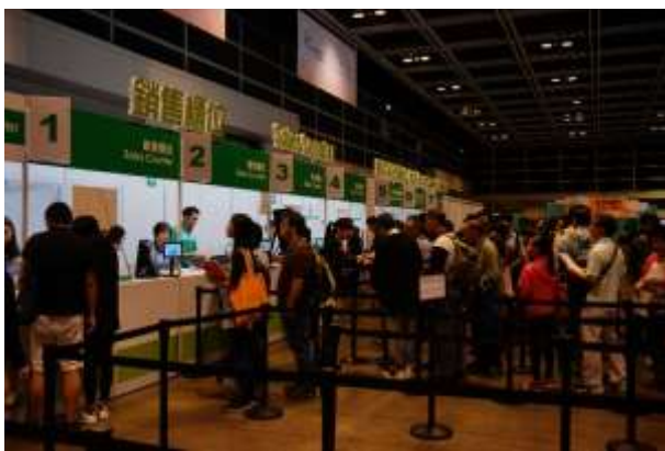
圖 81：香港民眾購票交寄排隊情形