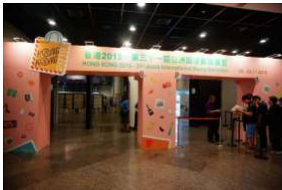
圖 19：5G 展場出入口處(一)