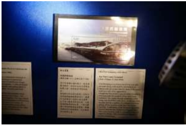
圖 69：特別效果郵票(九)