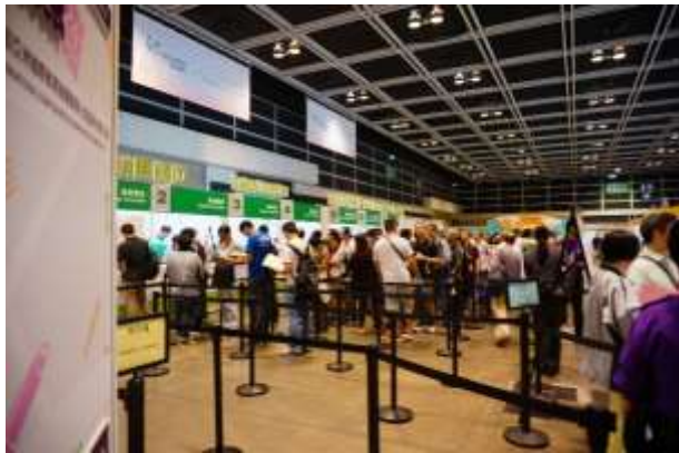
圖 39：香港郵政臨時郵局(公眾排隊處)