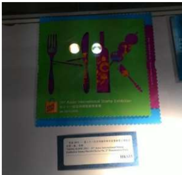
圖 47：香港郵品展示櫃(一)