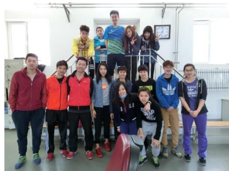
圖 14：本校羽球選手與北京交通大學羽球選手合影留念