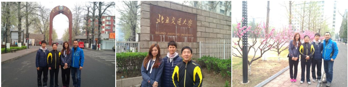
圖 13：隊職員於交通大學校園合影留念