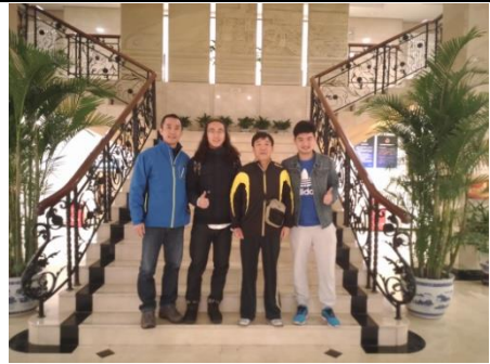
圖 10：首都體院交換生合影留念