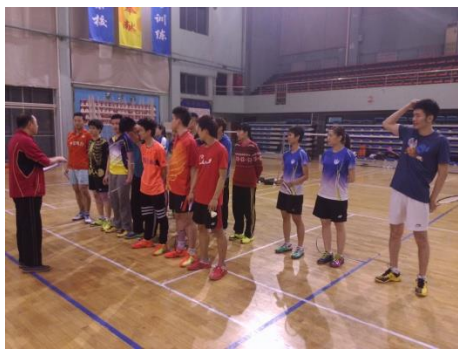
圖 7：集合說明訓練重點