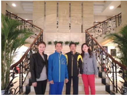
圖 9：北京體大交換生合影留念