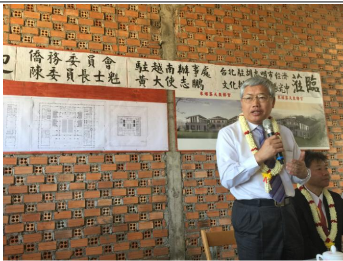
1207 委員長訪視天聚佛宮僑校並致詞