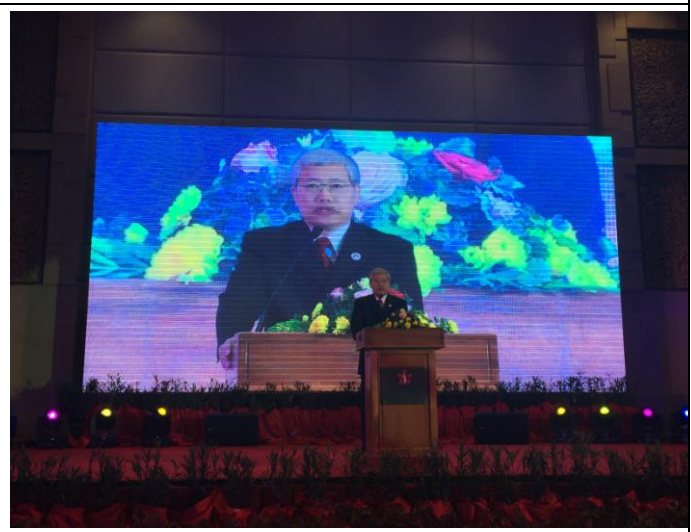
1206 委員長主持僑委會惜別晚宴致詞