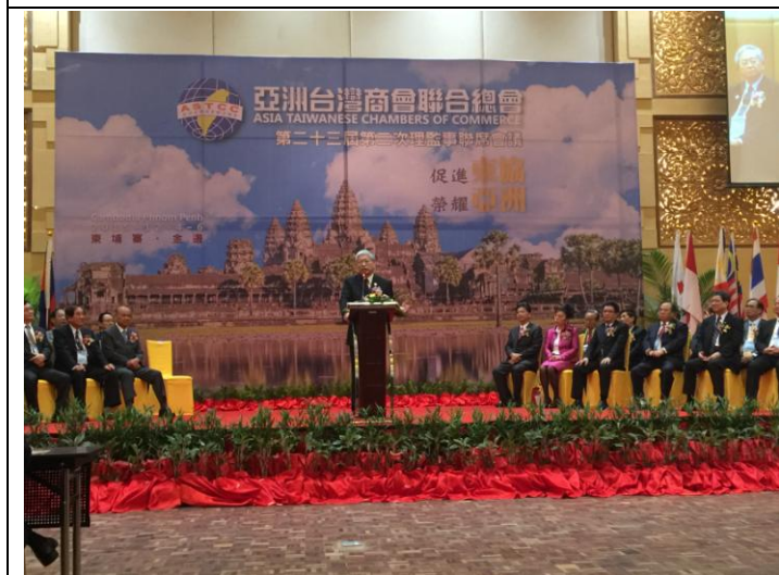
1205 委員長開幕典禮致詞