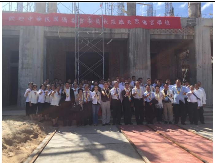
1207 全體人員在天聚佛宮僑校工地前合影留念