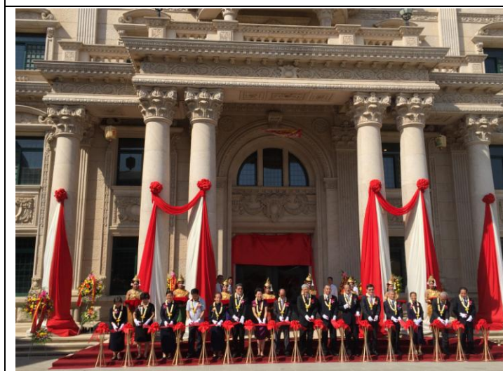
1206 委員長出席一貫道天鎮道院開壇剪綵典禮