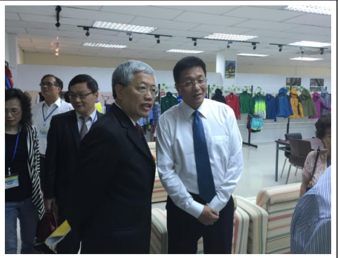
1206 委員長實地瞭解崑洲產品