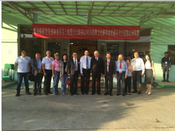
1206 委員長與崑洲集團員工合影