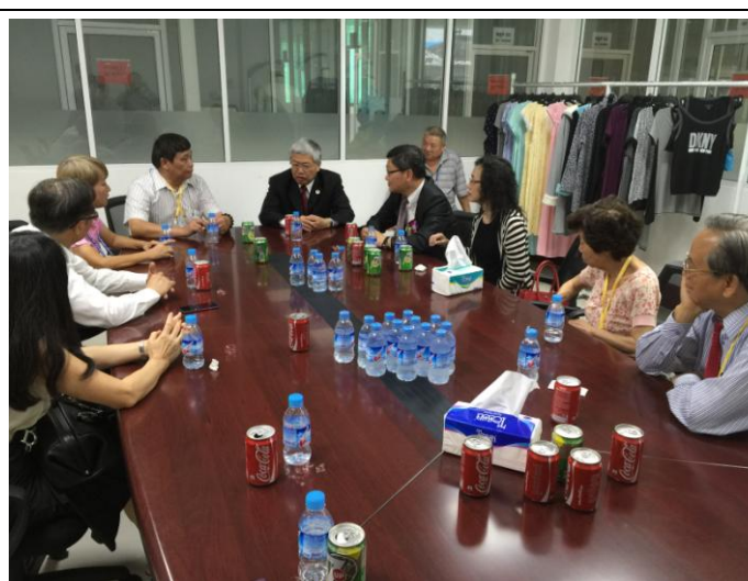
1206 委員長參訪僑營事業並舉行座談