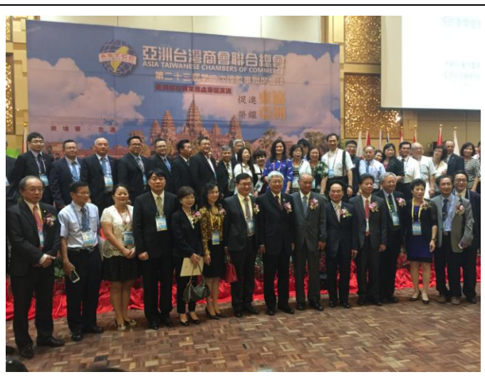
1205 開幕典禮後合影留念