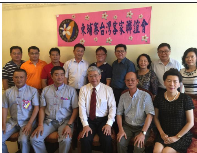
1205 委員長與客家會合影留念