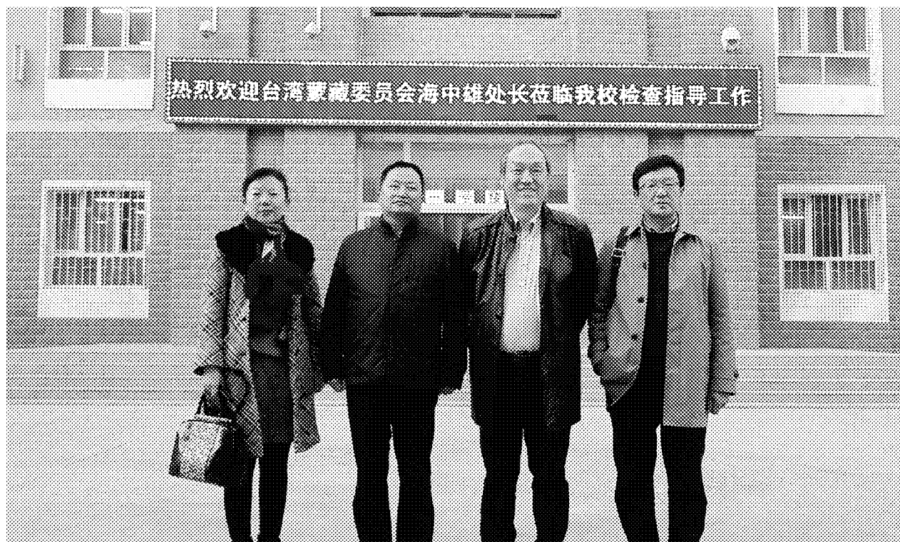
參訪新疆巴州民族學校留影