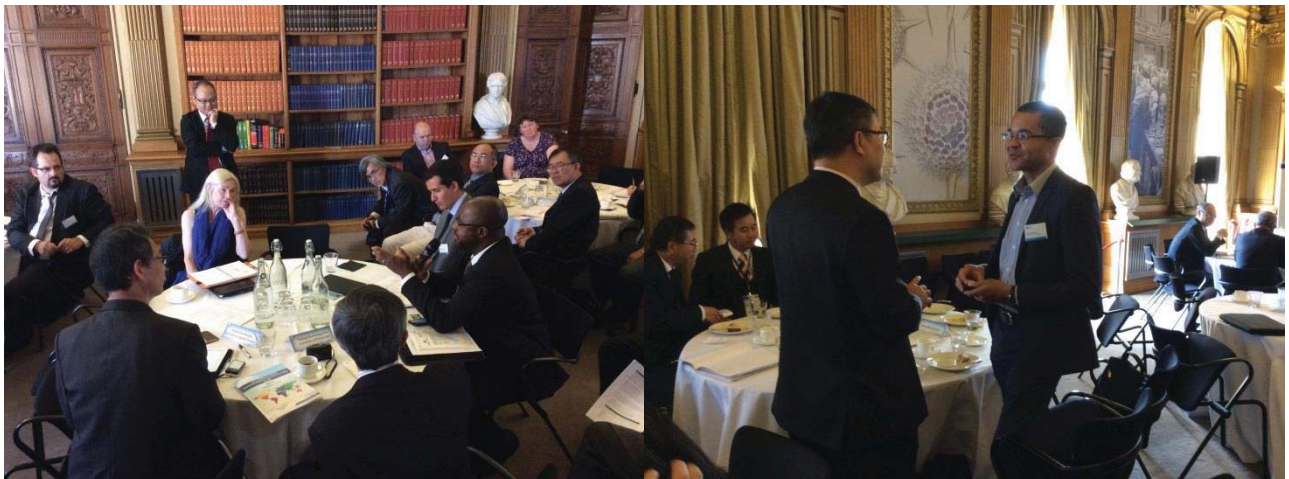
圓桌論壇熱烈討論情形