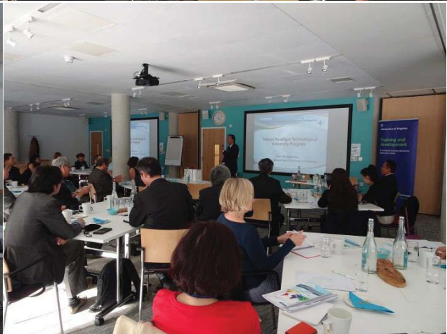
考察團與 University of Brighton 交流情形