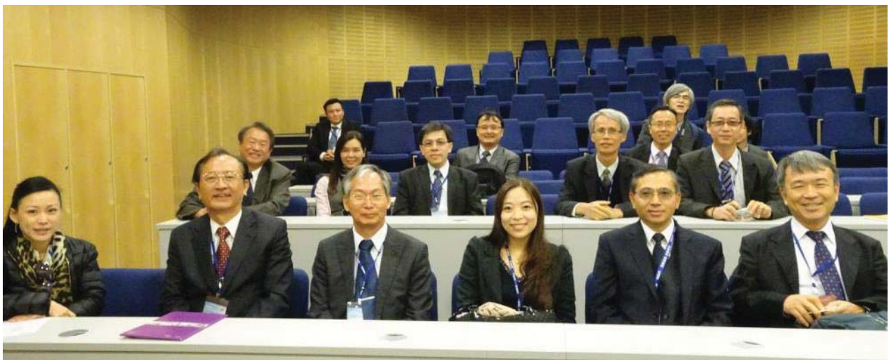
參訪團團員們參觀參觀生物科技實驗室