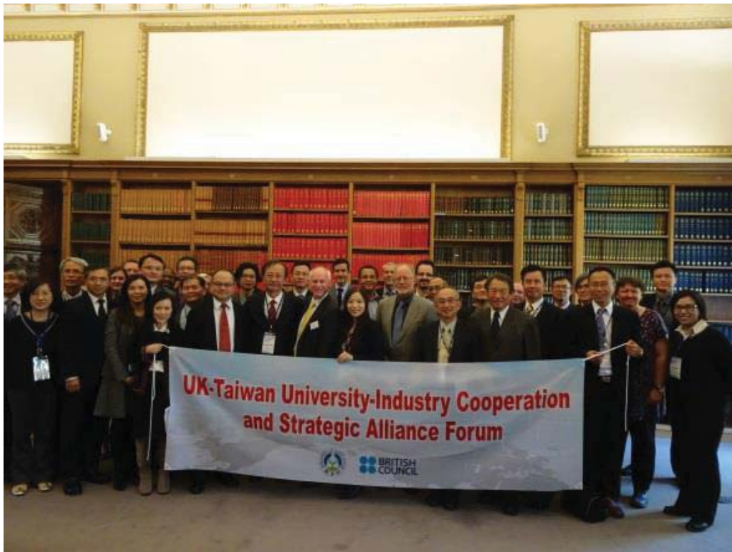
實務教學產學合作暨策略聯盟運作機制論壇大合影(右)