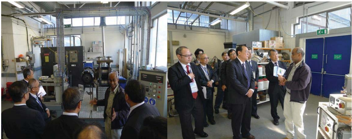
高階固化科技研究實驗室參觀