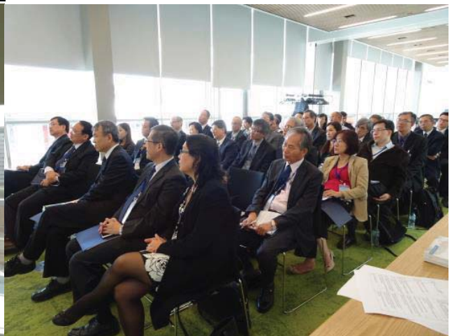
參訪團與 Birmingham City University 交流情形