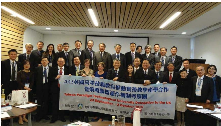
考察團與 The Education & Training Foundation 大合照