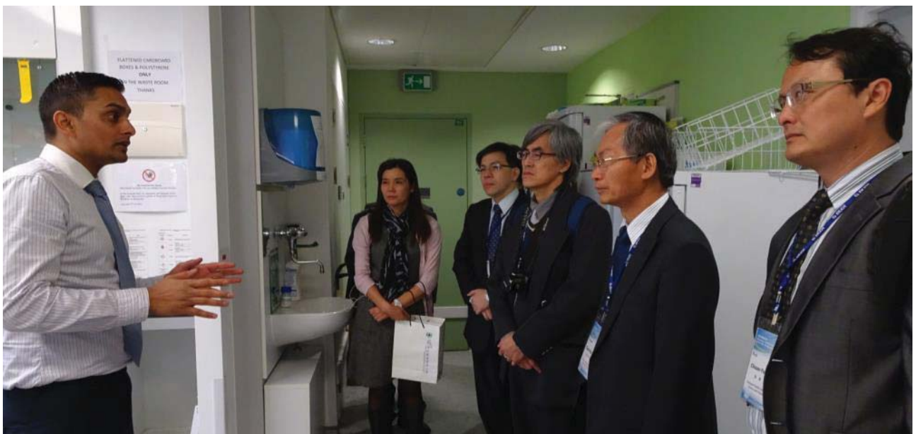
參訪團團員們參觀參觀實驗室