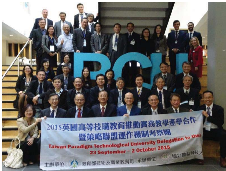
參訪 Birmingham City University 合影