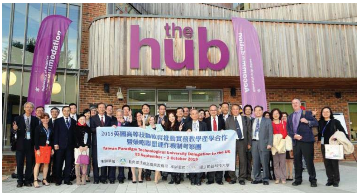
考察團於 University of Brighton 大合照