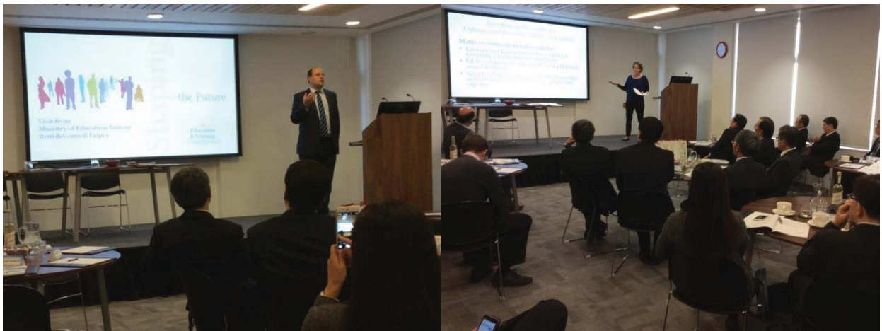
參訪團與 The Education & Training Foundation 交流情形