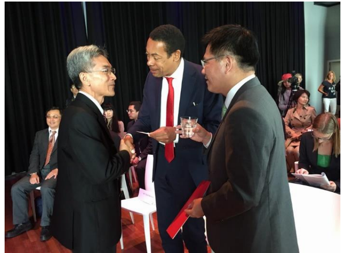
薛校長與台中市市長林佳龍及阿密爾市市長 Franc Weerwind 致意