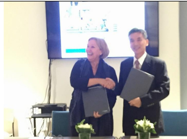
與海牙應用科技大學(The Hague University of Applied Sciences)簽約