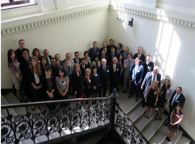
第二屆臺灣-匈牙利校長圓桌論壇與會人士