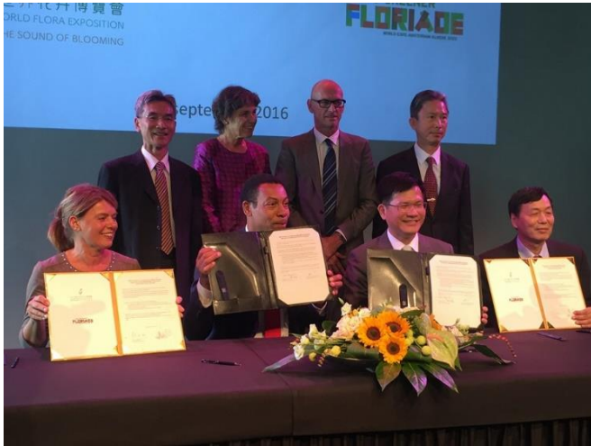
參加台中市市長與阿密爾市市長簽署花博 意向書典禮