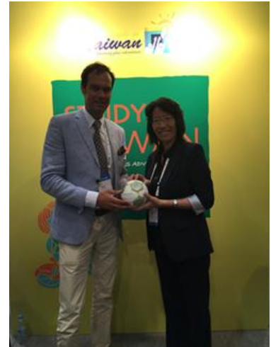
與海牙應用科學大學會談