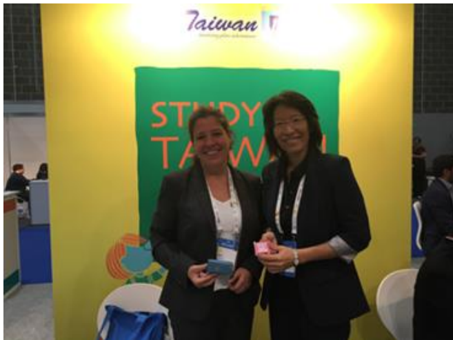
與德國杜賓根大學會談