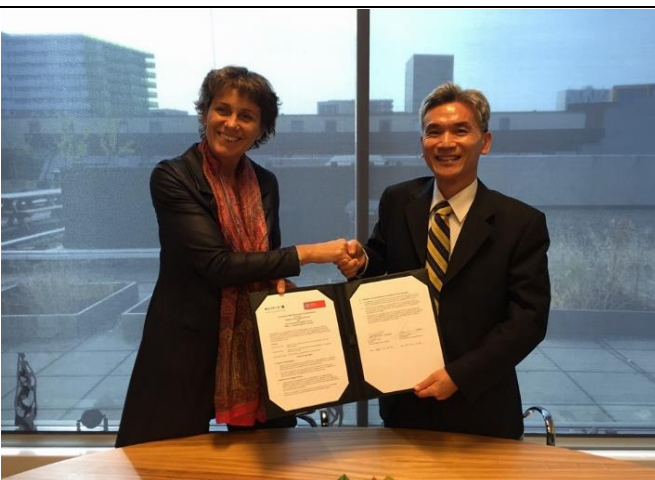
意爾瑞思應用科技大學(Aeres University of Applied Sciences)簽約