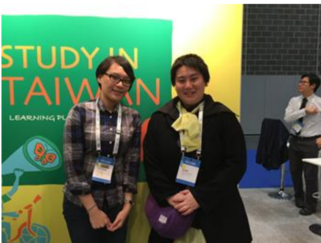
與日本名古屋大學會談