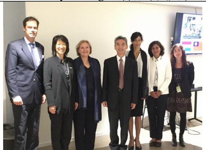
海牙應用科技大學(The Hague University of Applied Sciences)出席簽約人員