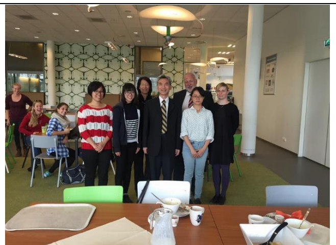
與本校現於意爾瑞思應用科技大學(Aeres University of Applied Sciences)交換的三位 同學見面