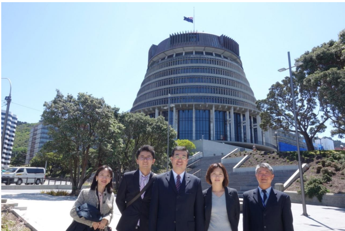
104 年 11 月 18 日市政參觀紐西蘭蜂巢建築之國會大廈