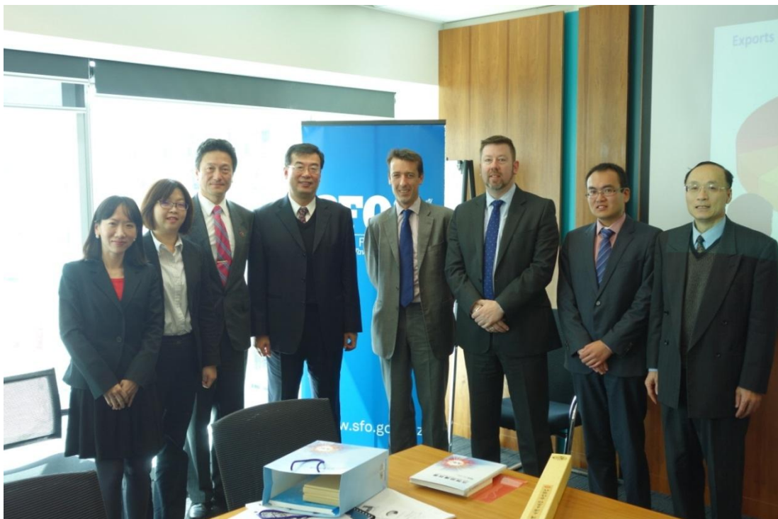
104年11月20日日本署訪團與辦事處同仁共同參訪奧克蘭嚴重詐欺辦公室(SFO)