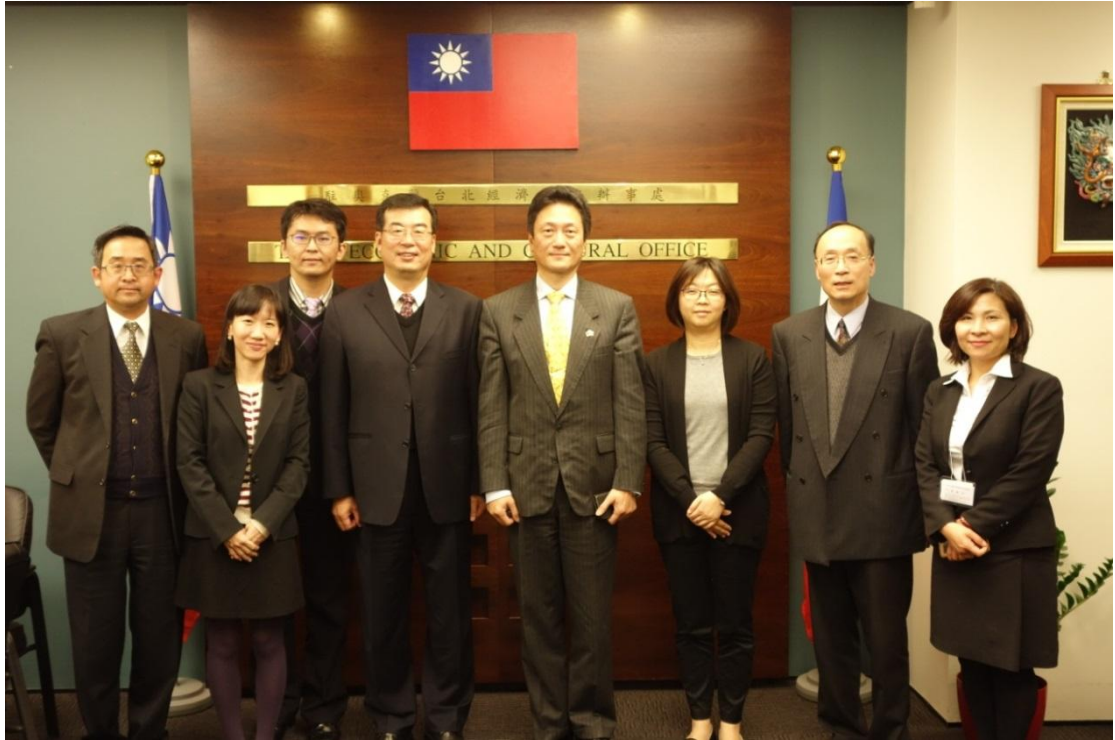
104年11月19日賴署長哲雄率團與駐奧克蘭台北經濟文化辦事處同仁合影