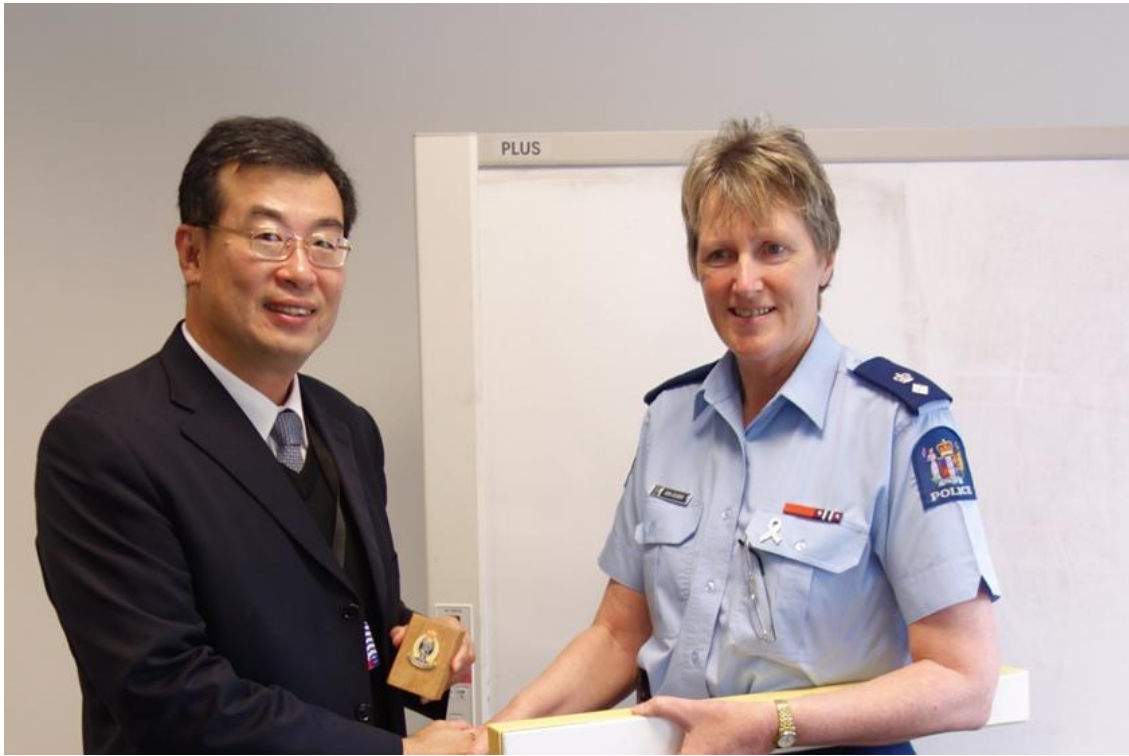
104 年 11 月 18 日賴署長與中央警察總部督察長合影