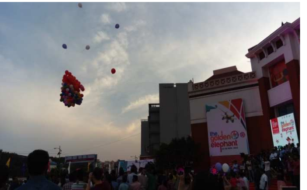
圖十: 光的表演圖十一: 會議廳外氣球起飛儀式