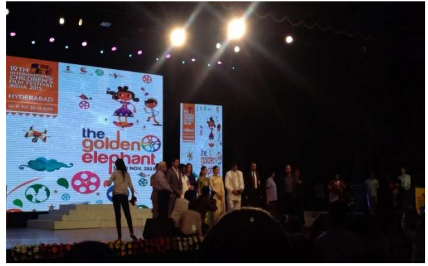
圖 4: 沙畫表演 圖 5: 點火儀式