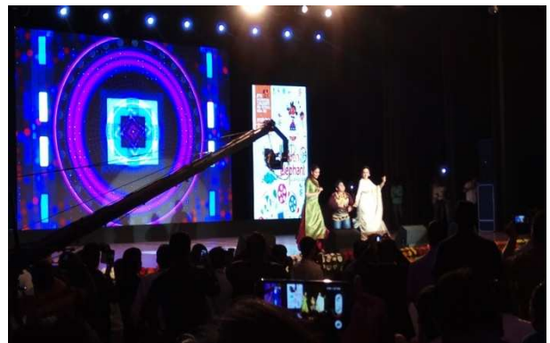
圖 6 現代舞蹈表演圖 7: 即興表演