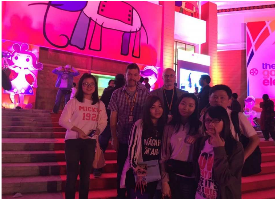
圖二：2015 國際印度兒童影展(ICFFI)開幕式會場合影