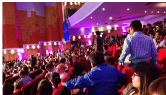
圖一：國際印度兒童影展(ICFFI)會場