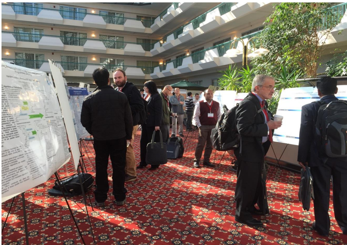
照片2：研習會會場俯視圖