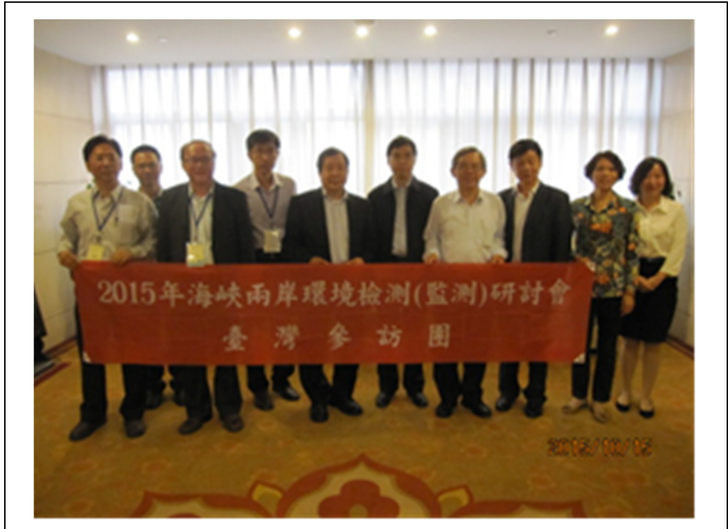
圖 17 南京市研討會成員合影