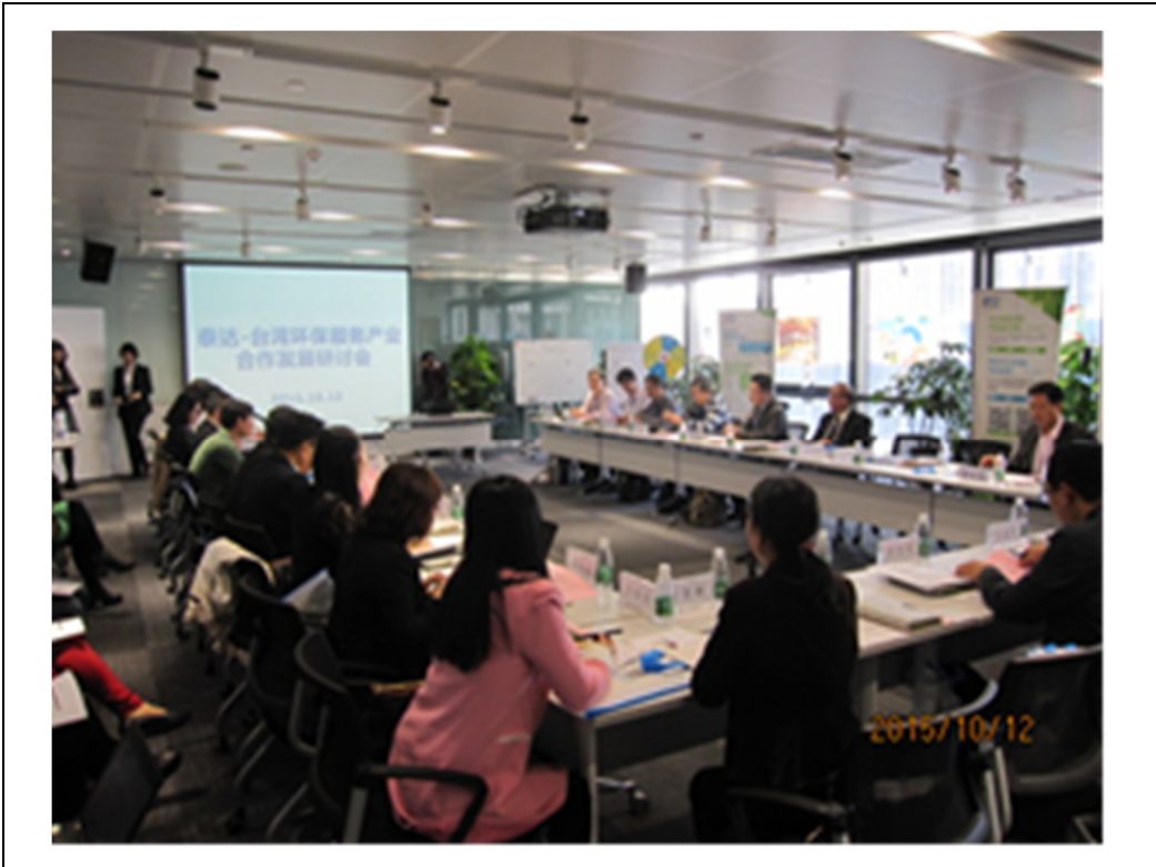
圖 2 天津研討會議題簡報情形