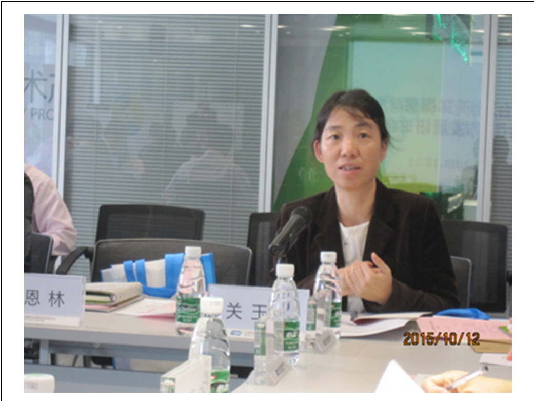
圖 4 天津研討會與會討論情形