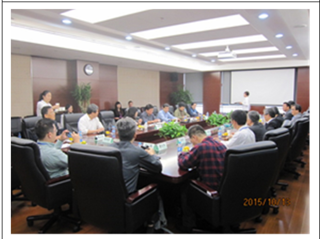
圖 8 上海市環境監測中心座談會情形