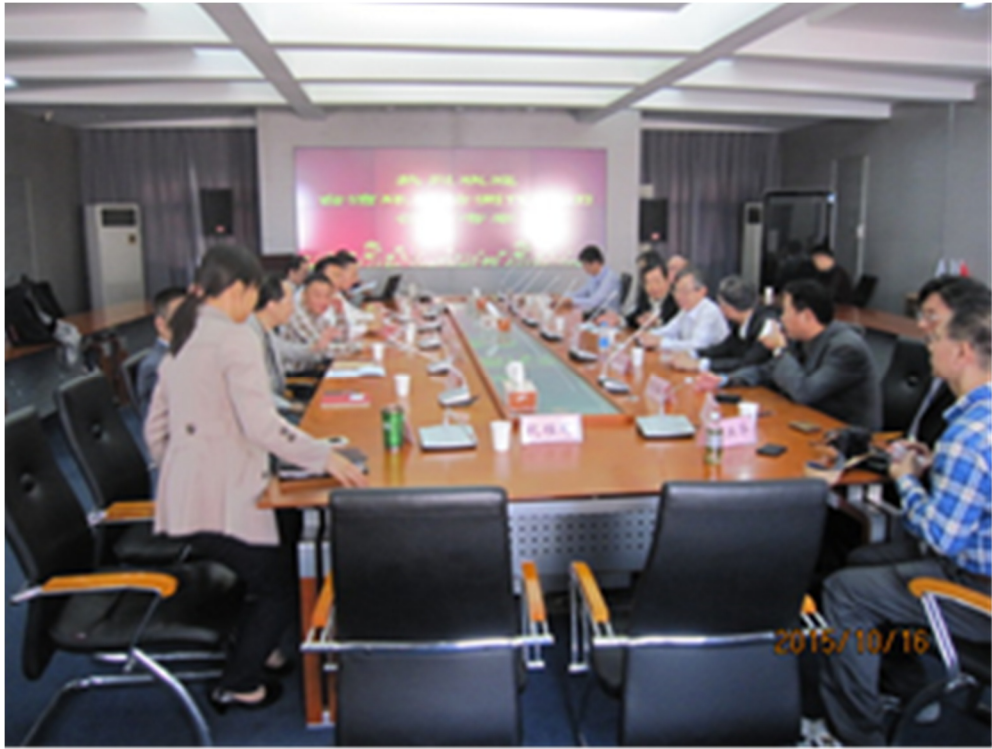
圖 22 南京市環境監測中心座談會