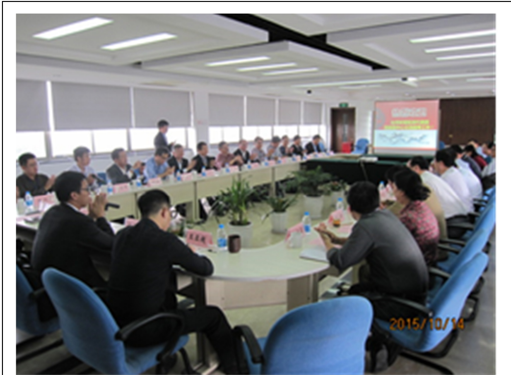
圖 14 蘇州市環境監測中心座談會