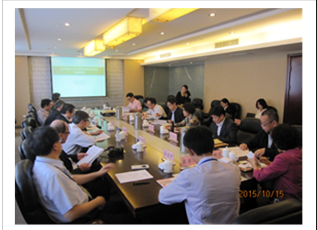
圖 18 江蘇省環境經濟技術國際合作中心座談會