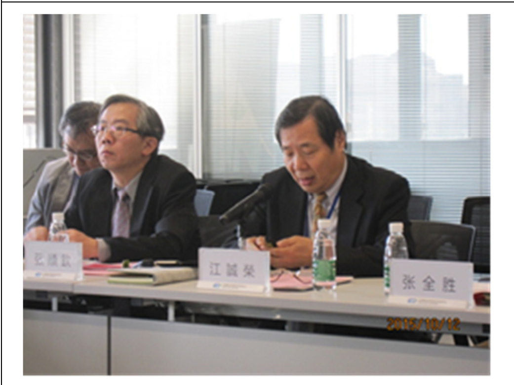
圖 3 天津研討會議題簡報情形