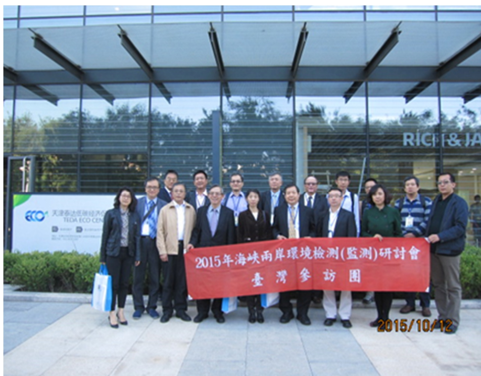
圖 1 天津研討會成員合影