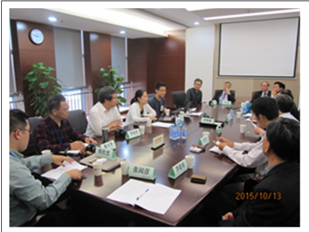
圖 9 下午上海市環境監測中心座談會