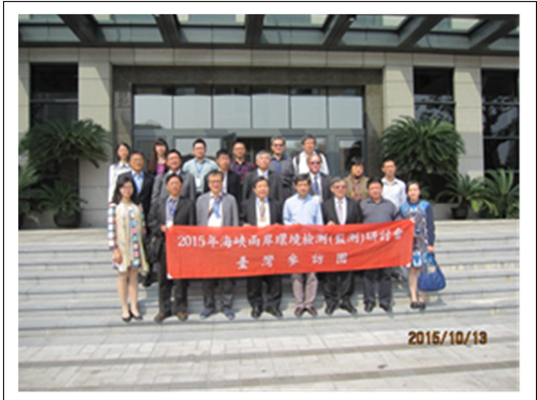
圖 7 上海市環境監測中心前合影