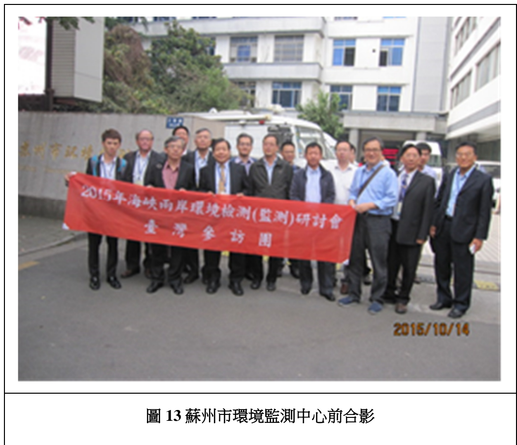
圖 13 蘇州市環境監測中心前合影