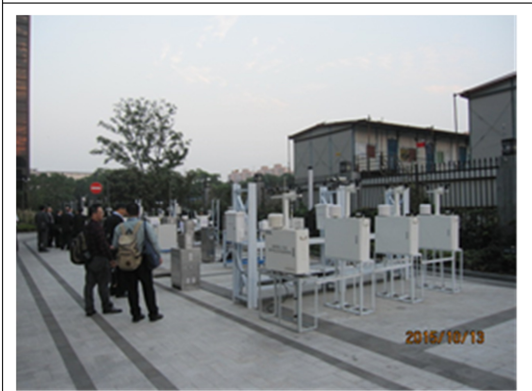
圖 12 上海市環境監測中心線上自動監測儀器