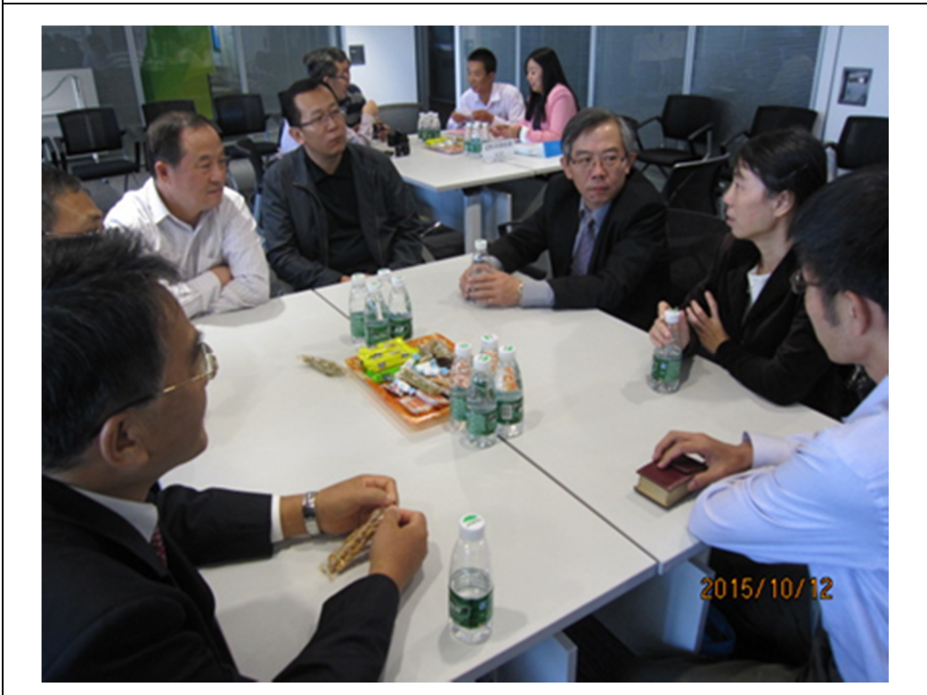
圖 5 天津研討會各分組討論情形