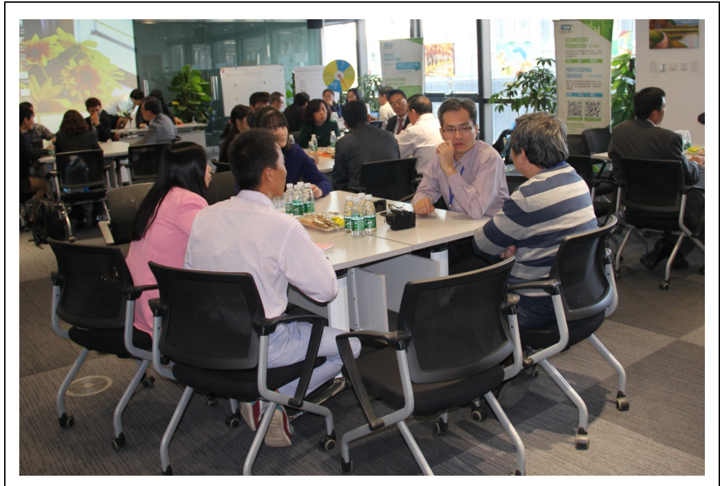
圖 6 天津研討會各分組討論情形