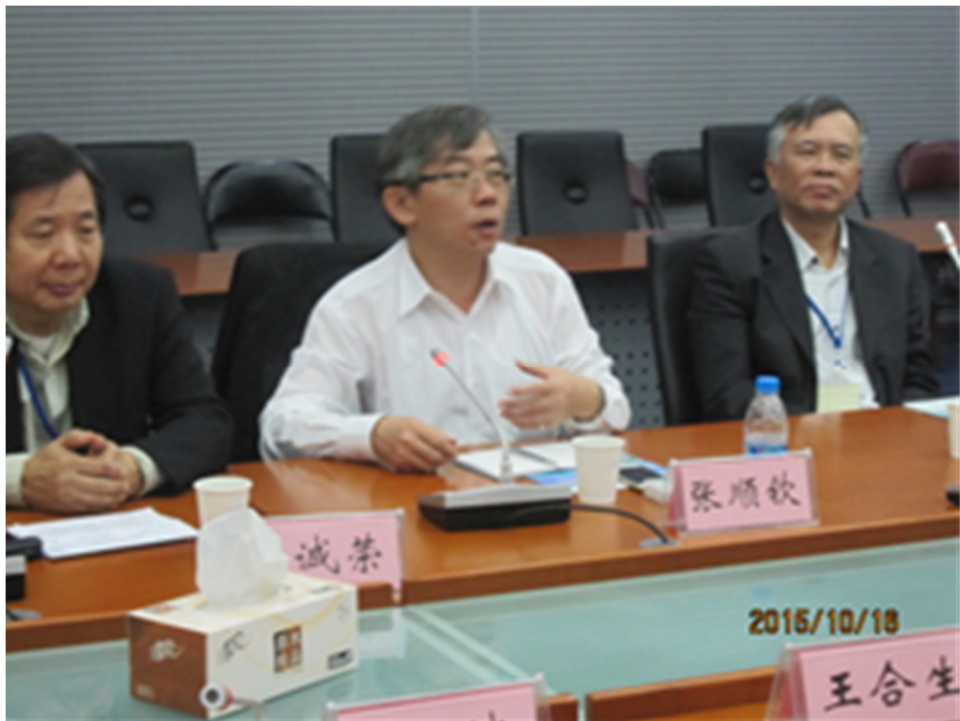
圖 23 環保署張順欽副處長發言