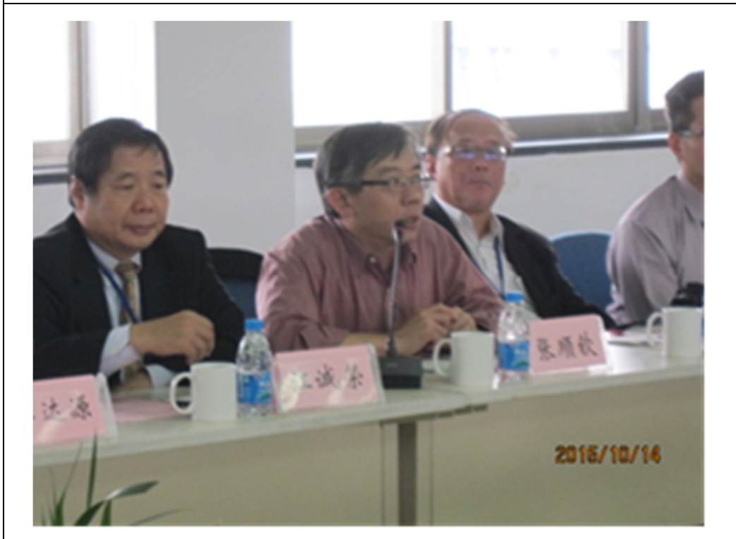
圖 15 環保署張順欽副處長致詞