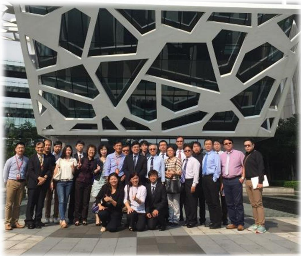
圖 2：全體團員於阿里巴巴總部濱江園區合影