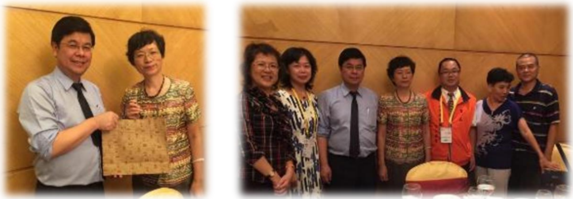
圖 34： 經濟部中小企業處長官、台灣業者與廈門業者交流