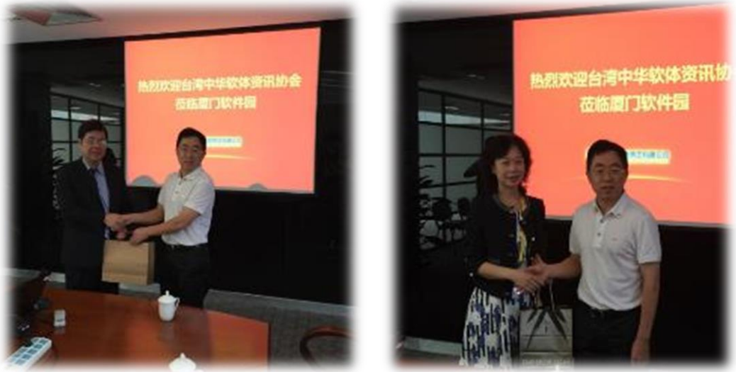
圖 32： 經濟部中小企業處長官與中華軟協秘書長致贈廈門信息集團感謝函