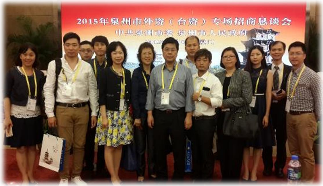
圖 26：本團全體團員於泉州活動合影