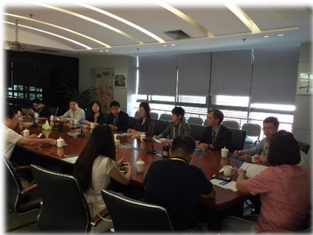
圖 31： 台灣業者與跨境電商業互相交流瞭解廈門軟件園區之特色