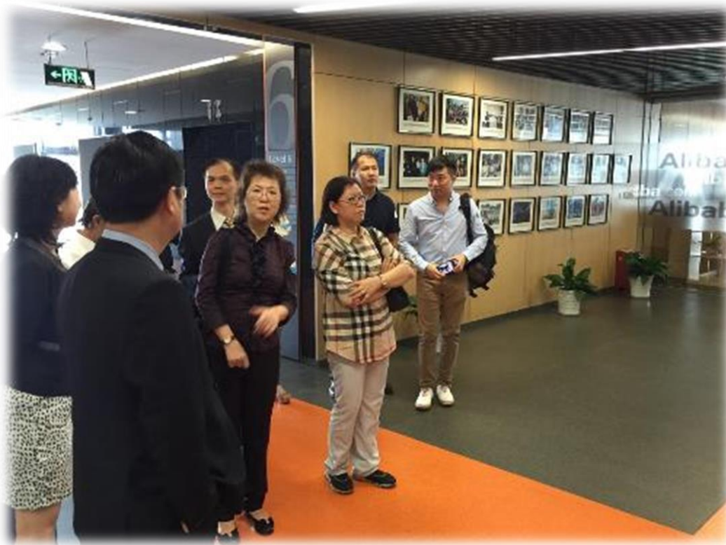
圖 4：團員聽取阿里巴巴說明公司文化