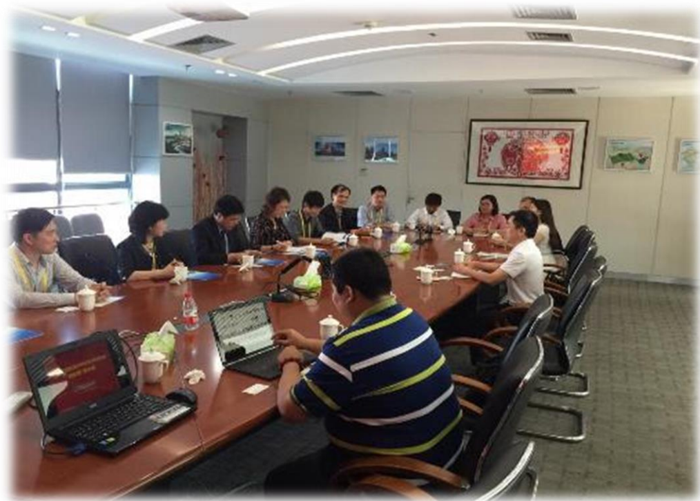
圖 30： 經濟部中小企業處率台灣業者與廈門信息集團交流