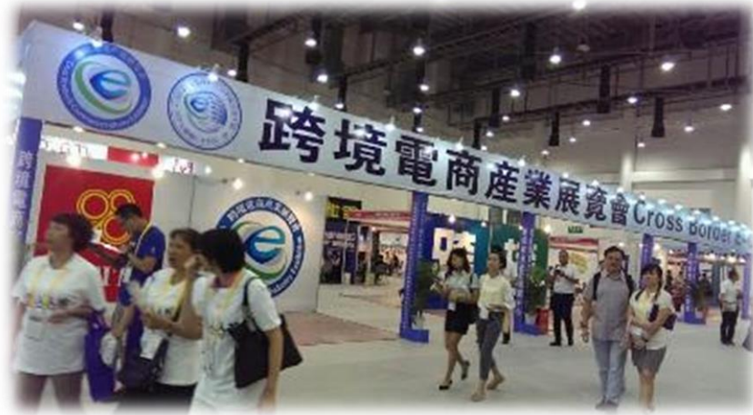
圖 17：大會跨境電商產業展覽區