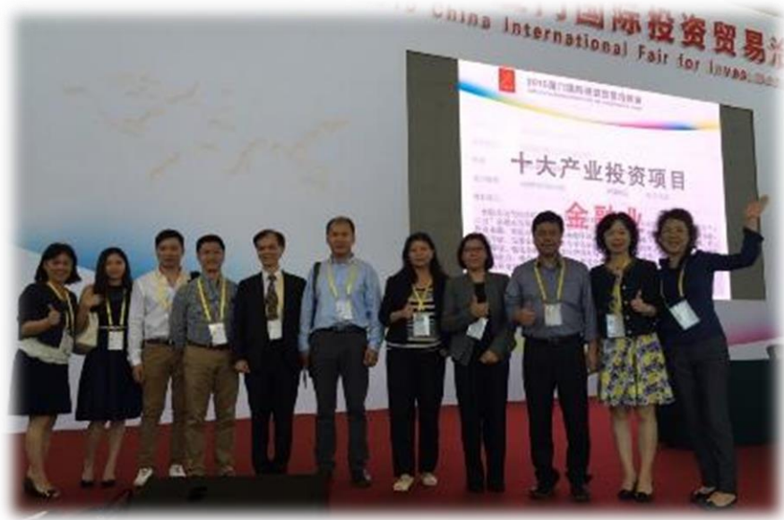
圖 15：全體團員於國際投資洽談會主場合影