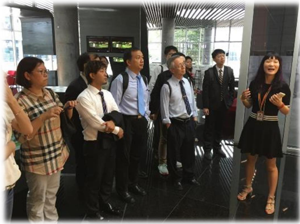
圖 6： 參觀阿里巴巴濱江園區總部之數據大屏與戰情室