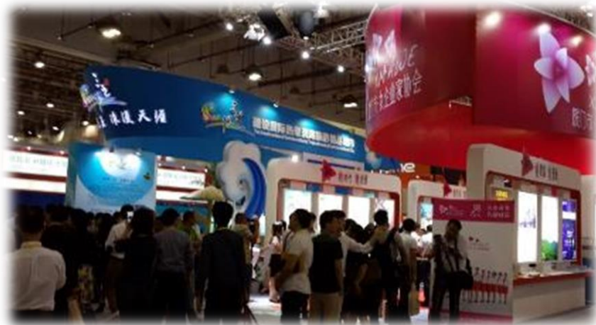
圖 18：大會各省專題展覽區