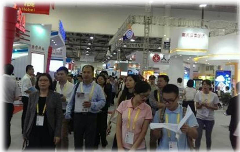
圖 16：由大會安排導覽人員協助團員展示區參觀