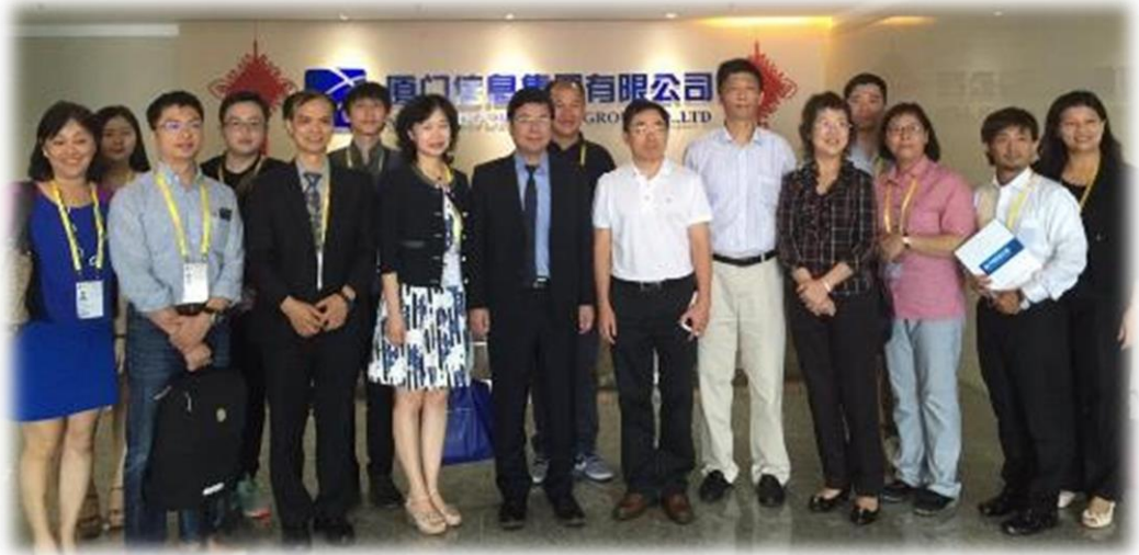
圖 33： 經濟部中小企業處長官、台灣業者與廈門信息集團交流於門口合影留念