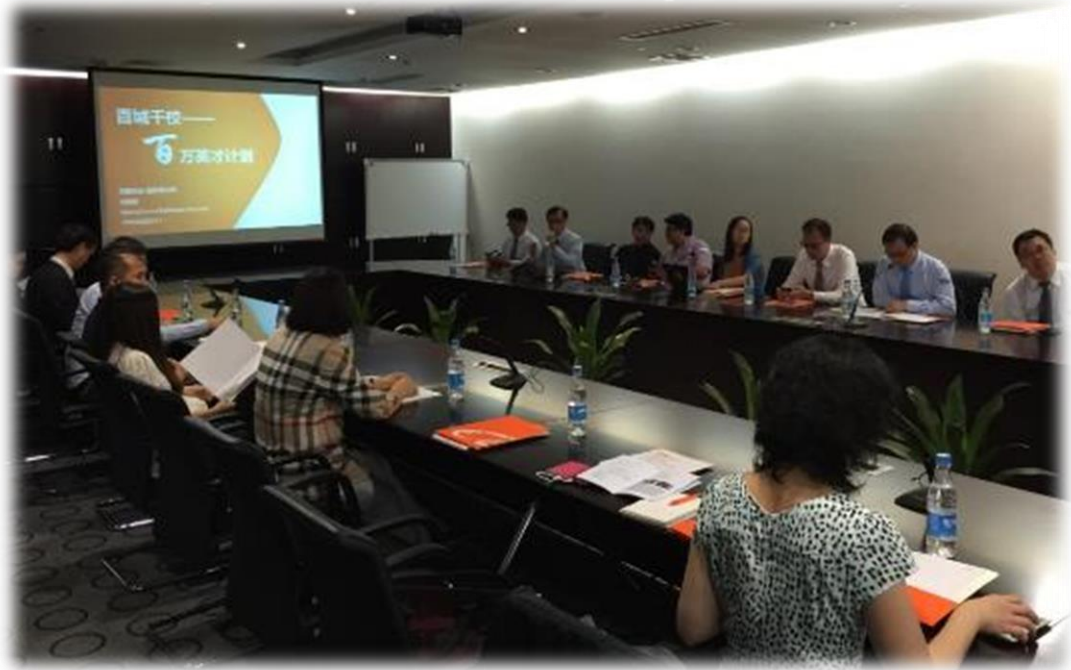
圖 8： 阿里巴巴 B2B 介紹與未來發展規劃