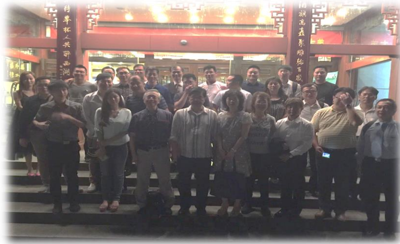
圖 1： 台灣團員與杭州網商業者合影