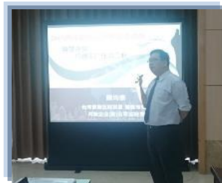
TMC 顏均泰提出智能方案