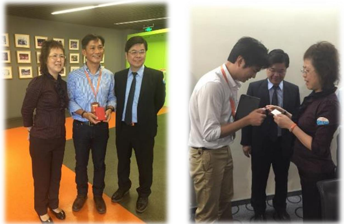
圖 10： 經濟部中小企業處長官與阿里巴巴台灣區及總裁特助交流合影