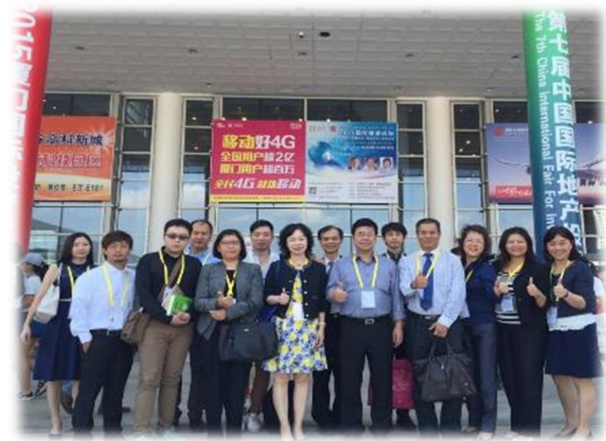
圖 14：台灣業者參與 2015 全球電子商務大會之場外合影照