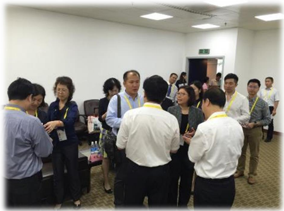
圖 20：參與團員與河北省信息化廳領導交談熱絡