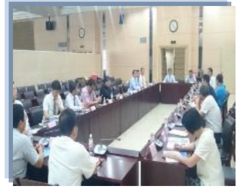
浙江省科技廳及產業代表與會