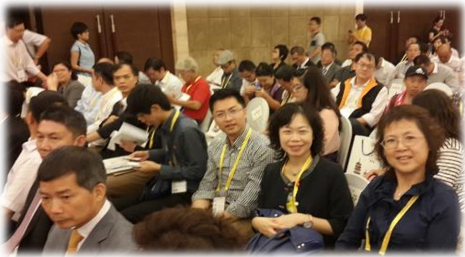
圖 25：本團團員參與泉州交流會合影