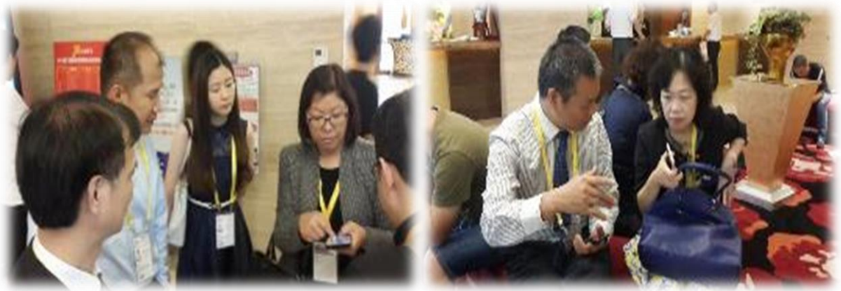
圖 27：本團團員與當地業者於會前進行交流洽談