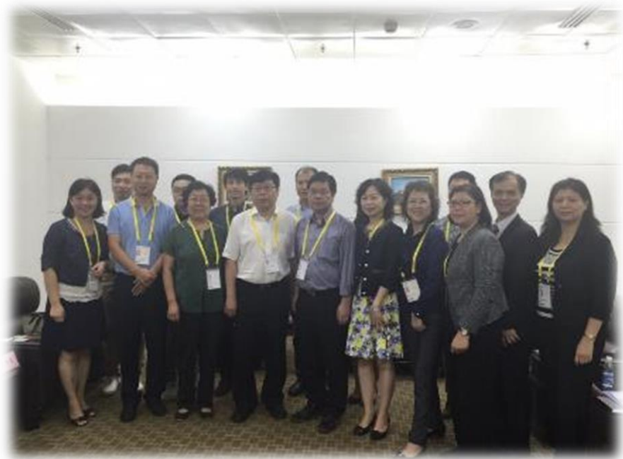
圖 21：經濟部中小企業處帶領台灣業者交流，並與中國河北工信廳合影