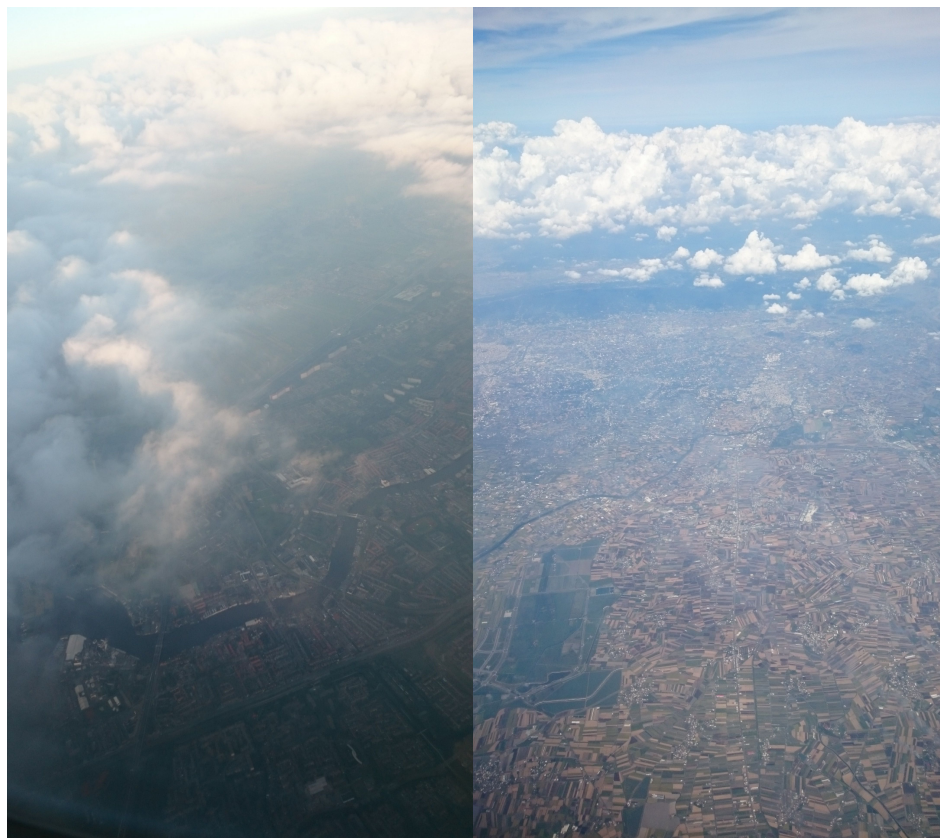
圖 參-9 荷蘭(左)以及台灣(右)空拍圖比對

但隨著在荷蘭停留的時間越長，我好像慢慢的了解其中決定性的差異所在，而在課程結束，由阿姆斯特丹史基浦機場搭機返回桃園機場時，在飛機上靠窗的座位，我鳥瞰了荷蘭及台灣的地景，這也讓我原本模糊的想法慢慢的成形了。