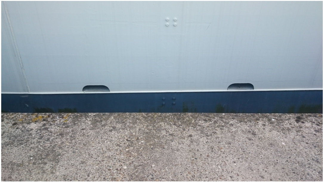
圖 貳-49 防浪牆正面中段之洩水孔

防浪牆區內有其獨立之發電廠，以確保自動運作正常，而另一個維持自動運作之重要設備是防浪牆底的控制閘室，其可於開啓或關閉時，帶動防浪牆頂的軌道(類似捲動履帶之方式)，使防浪牆緩慢的啓閉。