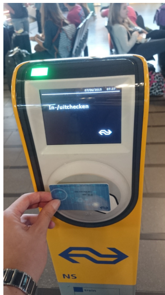
圖 參-5 OV-Chip 卡(可搭乘境內幾乎所有交通工具)

荷蘭是高度發展的國家，但在境內遊覽時，體會到的皆是”節約”以及”自然”的氛圍，相較於資本主義所推崇的成功特質，是不是就是因為荷蘭人這些”特別”的特質，才造就了如此高度發展的社會呢，我想，答案必然是肯定的。