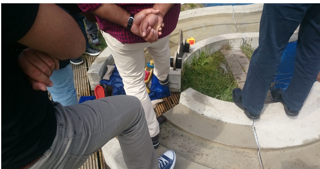
圖 貳-55 潰壩實務演練成果