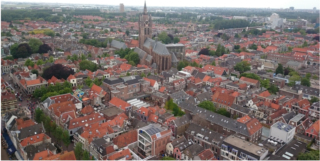
圖 參-6 代爾夫特遠眺