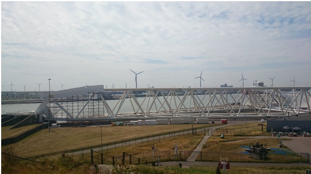
圖 貳-52 防浪牆及沿岸風力發電機遠眺

在園區教育館外，有一個模擬河道的遊戲區，河道上游及中游皆有地下水泵浦，可汲水打入河道內，模擬河流及支流匯入情形。課程學員們大家玩的不亦樂乎，甚至聯手建壩保護城市，再引洪水一口氣摧毀壩體及城市，足見水利人對水利設施的又愛又恨，也讓本次戶外參訪畫下一個最完美的句點。