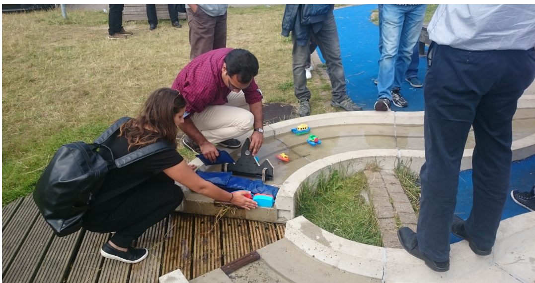
圖 貳-54 築壩攔水