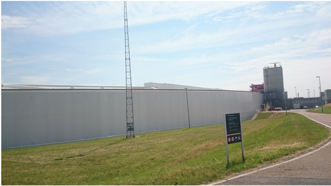
圖 貳-51 防浪牆正面及自動控制閘室