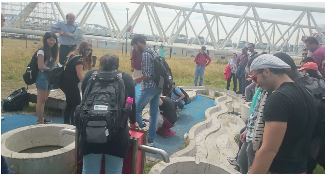
圖 貳-53 模擬河道遊戲區