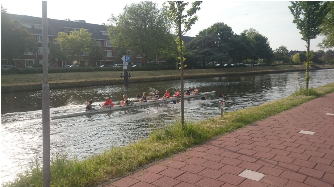
圖 參-7 運河上的划船隊

住在荷蘭的這三週內，因為這段不算短的異國居住經驗，也讓我了解到，若想要真正了解一個國家或是城市，一段時間的居住是有其必要性的，在生活的細節中，我們可以發現很多環境上、文化上或是地區上的一些差異，這些差異可能讓人無法想像，但在實際經歷過後也總讓我們感嘆，啊，原來世界上真的有這樣的事情發生！我想，這也是旅行中最有趣的地方了。