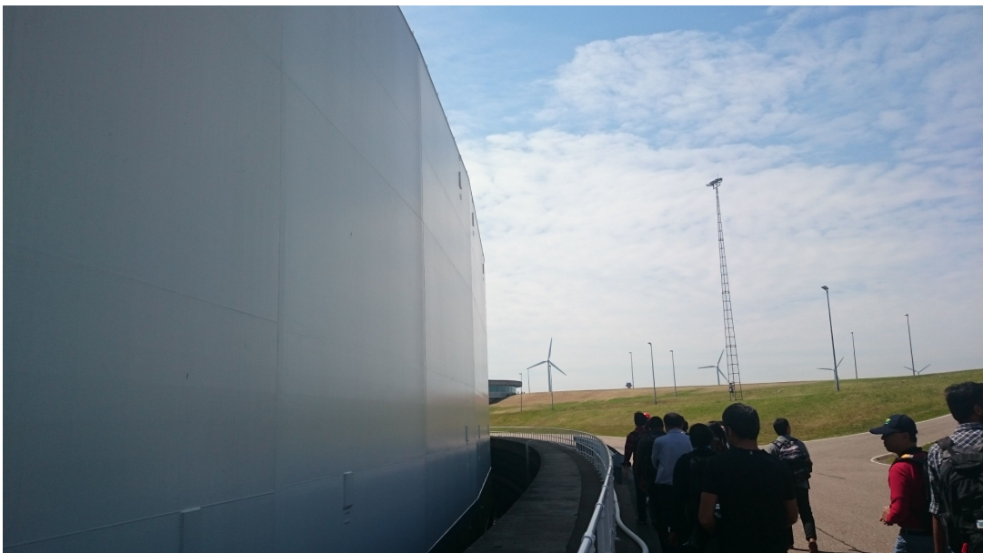
圖 貳-48 防浪牆正面