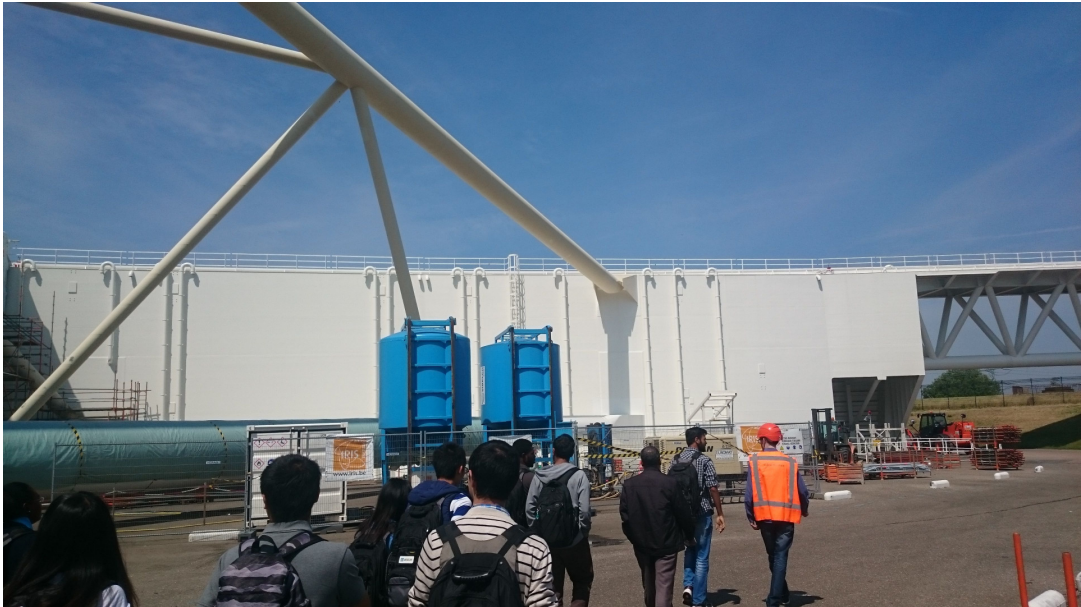
圖 貳-47 防浪牆背面(可看到抽水管)

接著步行至牆面區，在現地觀察時可以發現，在防浪牆的內部有許多抽水管，這是因為防浪牆在啓閉時，會先關閉至定位，並藉由將河(海)水導入牆體內部，增加防浪牆重量，再使防浪牆靠著自重緩慢下降至河床底上之混凝土護坦，達到密閉之效果，而所看到之抽水管及洩水孔，即是蓄水及排水時所用。