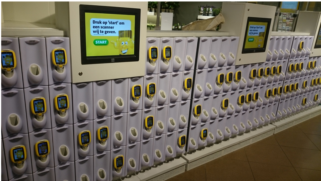
圖 參-8 荷蘭超市內的行動條碼機

是小型的條碼機，超市提供大量的行動條碼機讓顧客使用，不僅讓顧客可以隨時掌握自己的購物清單，也更提升了結帳時的效率。若不是親眼所見，還真難想像這種在台灣看不到的景象呢。