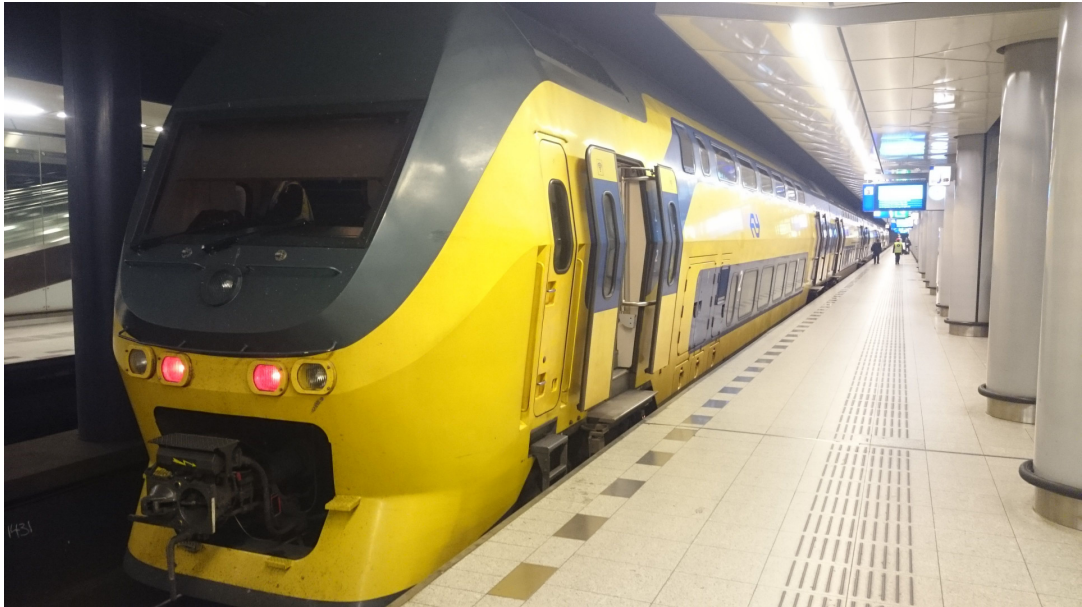
圖 參-4 荷蘭鐵路

荷蘭因為全境皆是平原，所以不僅便於騎乘腳踏車，大眾運輸工具也是方便又快捷，城市往來間有鐵路，各大城市也有各自的地鐵，其網路密布，相當複雜，但是因為有整合完整的手機 APP，還有類似悠遊卡的 OV-Chip 卡，除了本國人愛搭外，遊客也可以輕鬆的搭乘。