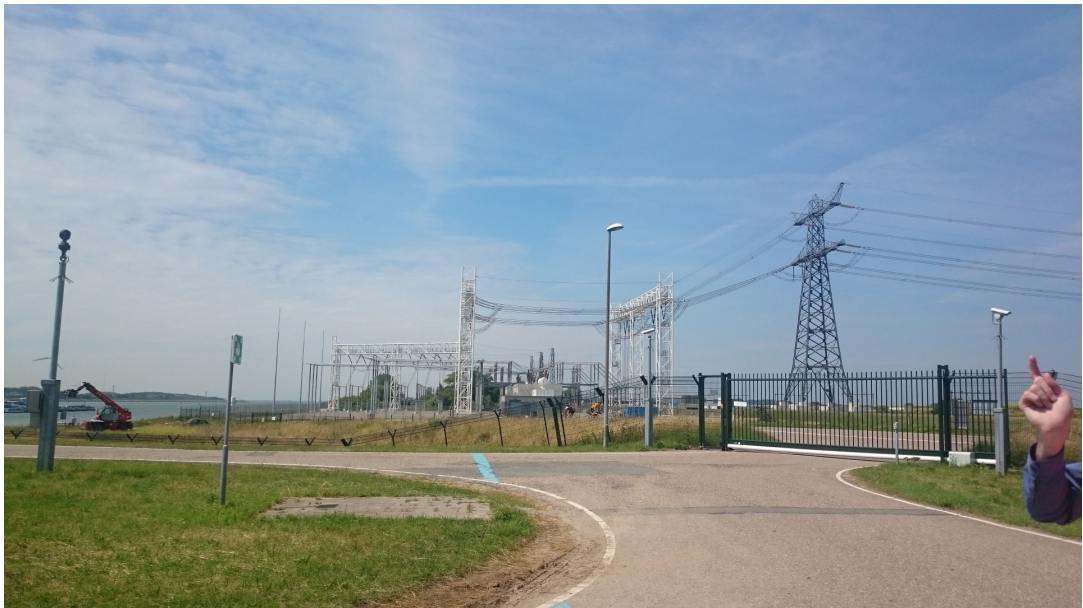
圖 貳-50 防浪牆區內電廠

防浪牆區內有其獨立之發電廠，以確保自動運作正常，而另一個維持自動運作之重要設備是防浪牆底的控制閘室，其可於開啓或關閉時，帶動防浪牆頂的軌道(類似捲動履帶之方式)，使防浪牆緩慢的啓閉。