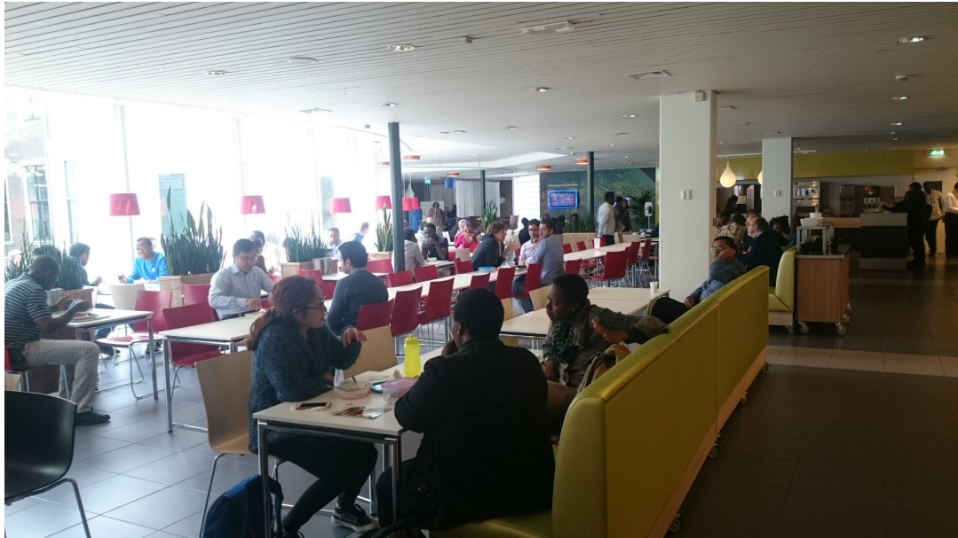
圖 參-3 水利學院內餐廳

經過這次實際與中國人相處之後，我相信政治議題就讓它們留在政治圈就好了，人與人之間的相處確實沒有想像中的這麼難。