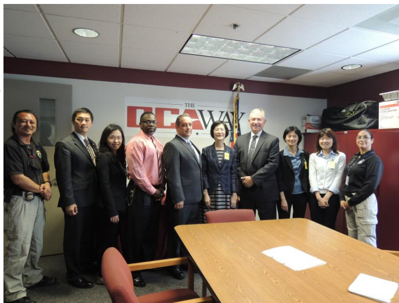
(上圖) 羅部長及訪團成員與 Otay 收容所官員合影，收容所內禁止攝影，圖為收容所會議室

此收容所係以接受違反移民法令之暫時收容人為主，包括由邊境管理局查獲持偽造證件入境，人口走私或沿美墨邊境山區地帶進入美國境內之非法入境者，然而，事實上超過九成以上 Otay 拘留所之收容人則是違反刑事法規而處於待遣返的階段。另就收