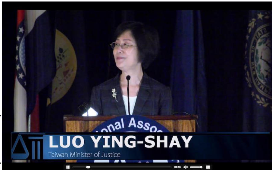
羅部長在 2015 NAAG 夏季年會大會致詞實況

技，通訊傳播更為發達，日常生活更為便捷，但同時也助長洗錢、毒品、人口販運等犯罪滋生。