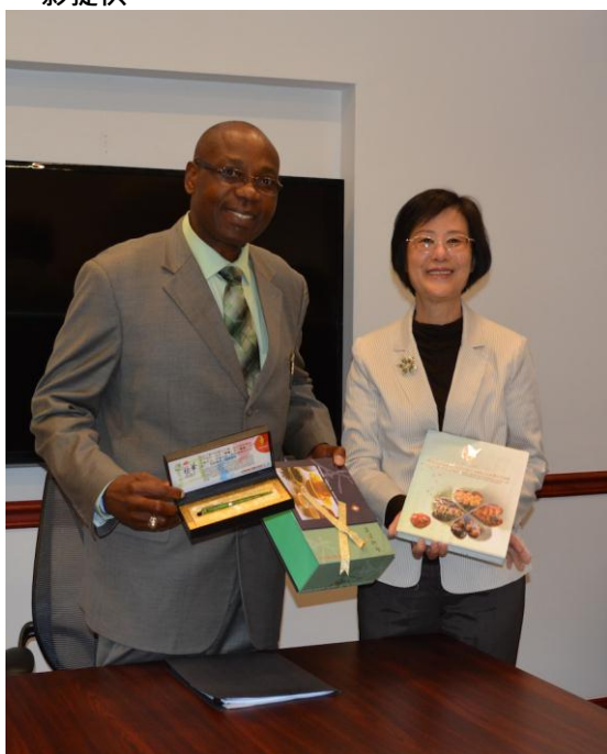
(左圖) 羅部長致贈我國受刑人所手工製作之漆藝筆，以及矯正機關工藝品簡介予典獄長等行政主管留念；典獄長對於我國受刑人製作漆藝筆之精緻極為讚賞。

另外，就受刑人日常所需的各項物品，獄方也設有販賣部提供商品販售，與一般小型超市無異，購物所需款項，則透過受刑人在獄中帳戶扣款。由於都柏林監獄的受刑人皆為女性，所以販賣部內亦販售化妝品，受刑人平時均可化妝打扮。獄方表示允許受刑人化妝打扮是可藉此提高