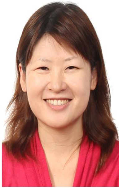
Prosecutor Tsai, Pei-Ling 蔡佩玲

Prosecutor, Department of Prosecutorial Affairs, Ministry of Justice 法務部檢察司調部辦事檢察官