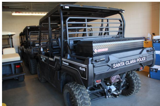
(左圖) 位於球場 1 樓臨時拘留所之女性酒醉恢復室 (上圖) 李維美式足球場 1 樓，平時即停放聖塔克拉拉警察局所屬的四輪驅動車輛，用以載送在球場遭逮捕的滋事分子或嫌犯來回警局與球場