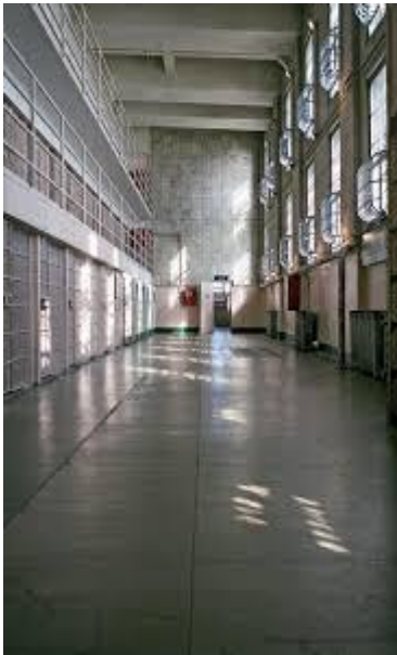
(左圖) 舊式直線式規劃獄所空間