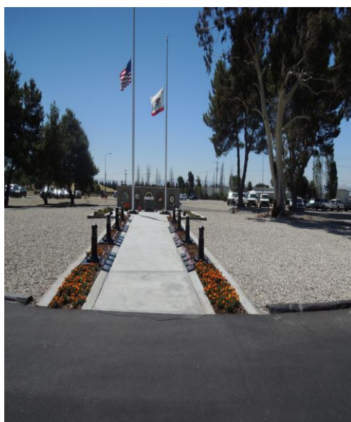
(上圖) 都柏林監獄大門外觀