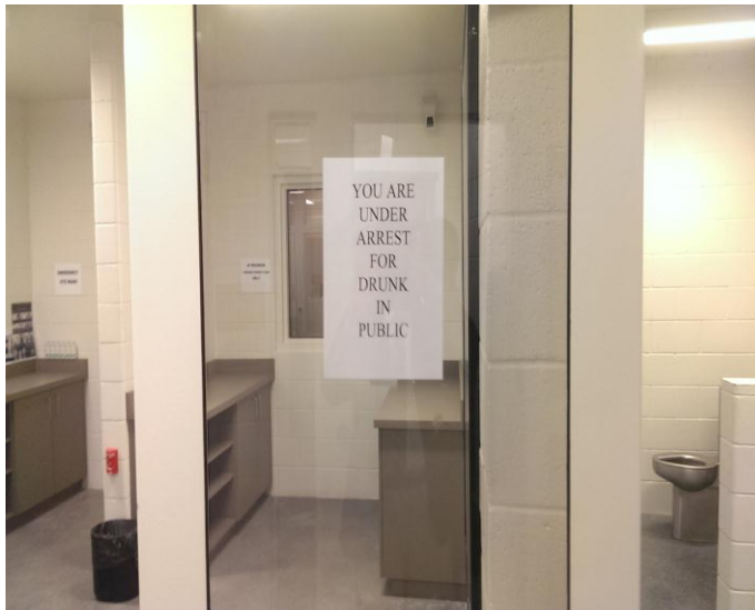
(左圖) 李維美式足球場臨時拘留室一隅。拘留室門上並揭示：「您因為在公共場合酒醉而遭到逮捕 (YOU ARE UNDER ARREST FOR DRUNK IN PUBLIC)」

察陪同，解送至聖塔克拉拉警局。由於被拘留者多半為酒醉鬧事分子，所以拘留所內另設有「酒醉恢復室(sober cell)」，讓無犯罪嫌疑的酒醉人士在恢復室恢復清醒之後，再行離開。此外，拘留室外另架設有電視螢幕，同步轉播場內賽事，讓被拘留者得以繼續專注關心球場賽事，於其情緒受到安撫之後，可避免進一步暴力行為產生。