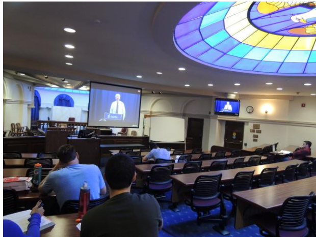
(上圖) 法學院畢業生於教室內參考教學錄影帶準備考試

此外，由於參訪時已是法學院暑假期間，法學院校區內也有許多在圖書館及各教室埋首苦讀準備律師考試的畢業生，法學院也不吝與補習班合作，就地提供教室予補習班業者播放教學錄影帶供學生進修。而在就業方面，聖地牙哥法學院有專門的就業輔導中心，該中心提供法學院學生各項就業諮詢服務，包括擇定事務所，履歷表修改以及模擬面試等，資訊相當充分，並且該中心服務對象不限於在學的聖地牙哥法學院學生，甚至已經畢業的校友，仍可回到該中心進行就業諮詢。而這樣的服務也是雙向的，校友如有徵才需求，也會回到該中心請求轉介。在參訪告一段落後，Furruolo 院長及相關職員引領參訪團前往會議室進一步做討論交流，羅羅部長並當場致贈我國受刑人繪製之山水畫軸一幅，Furruolo 院長欣喜地隨即掛置辦公室窗邊，與窗外景色共賞。