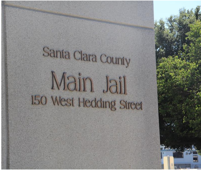
（上圖）聖塔克拉拉郡監獄外觀

Crawford 監獄官表示，總監獄南棟完成於 1950 年代，設計上屬於舊式直線風格（linear style），為間接監管（indirect supervision）型式，管理人員與囚犯互動較少，與一般現代監獄設計規範相異。北棟較為新穎，屬於第三代矯正設施，採用直接監督（direct supervision）囚犯的管理模式，最多可容納多達 919 名