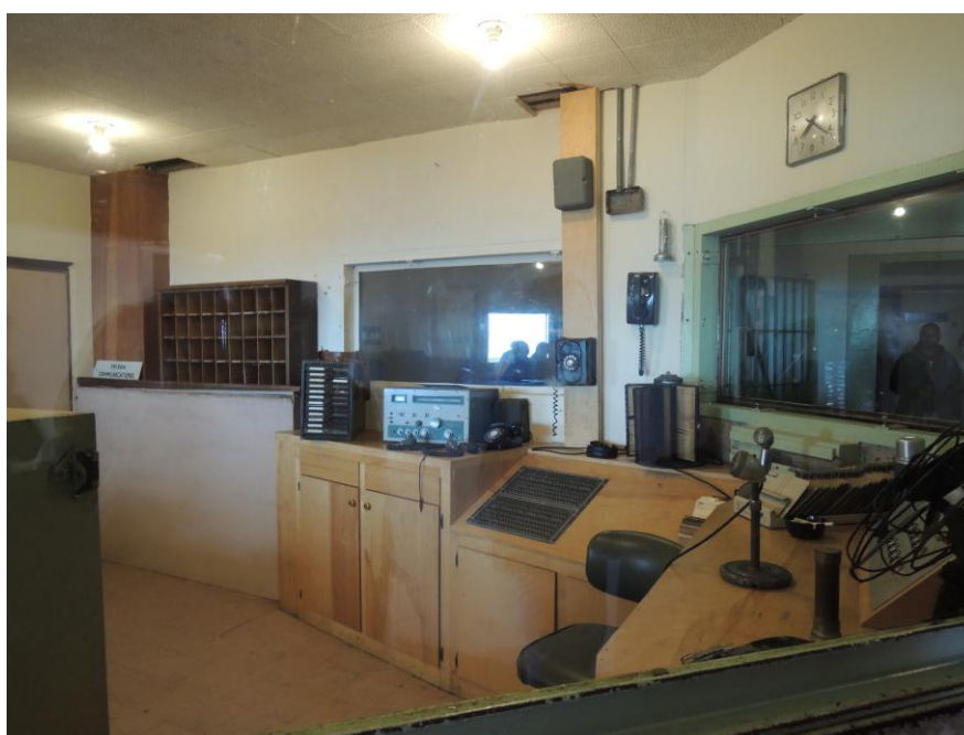
(下圖) 惡魔島內模擬往昔監控室情形