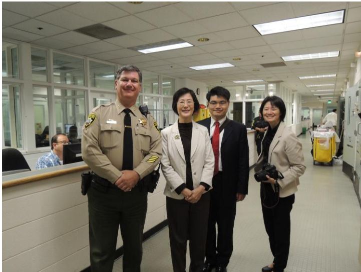
（左圖）羅部長及訪團成員於舊金山警局參觀時合影