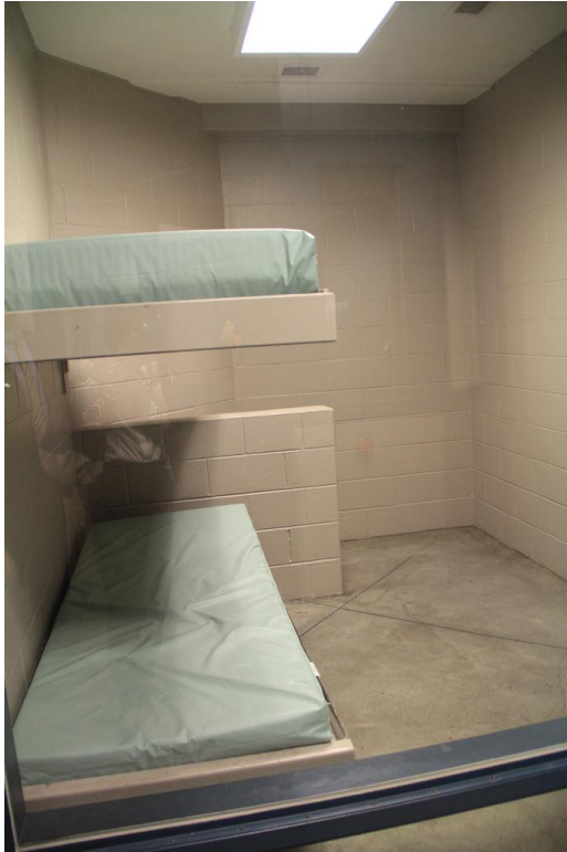
(上圖) 聖塔克拉拉警局拘留室一隅