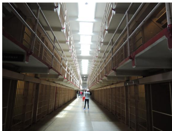
(左圖) 惡魔島內模擬往昔拘禁人犯情形