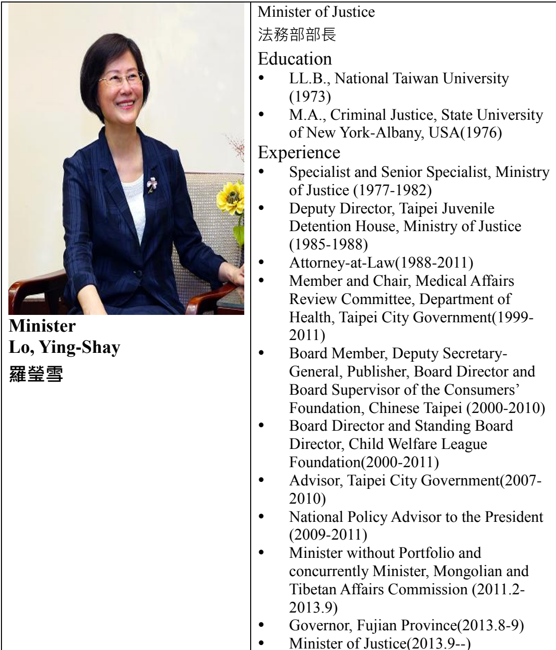
Minister Lo, Ying-Shay 羅瑩雪