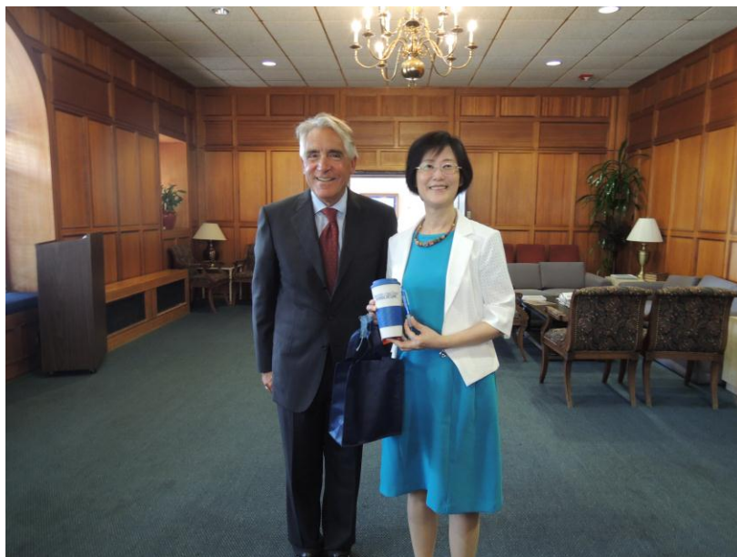
（上圖）羅部長與聖地牙哥法學院院長互贈禮品致意合影

聖地牙哥大學成立於 1949 年，是所相對年輕的校園，該校坐落在 Mission Bay 旁山丘上，自校園俯瞰可遠眺太平洋，其整體建築在設計之初，係以西班牙文藝復興式建築風格為主，在日後該校擴建改建時，也均盡量採取劃一的建築風格。該校法學院成立於 1954 年，其係以商事法、憲法、智慧財產法、國際比較法、稅法聞名全美，其教授發表於 SSDN 等級期刊下載篇數全美法學院排名 23，研究深度及廣度均相當傑出，以法學院規模而言，攻讀 JD(Juris Doctor)學位的在學學生約為 900 名，而目前在該校法學院深造的臺灣留學生 1 名。法學院主要建築共區分為三棟，分別為 Warren