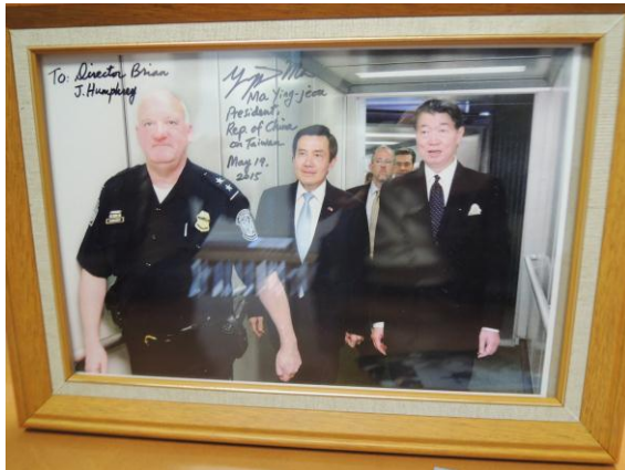
（上圖）羅部長與韓福瑞總監合影並交換紀念品

中午餐會結束後，參訪團步行前往韓福瑞總監位於舊金山市中心的辦公室，韓福瑞總監並就台美逃犯的追緝作為及現況簡要說明，隨後並與羅部長交換紀念品。