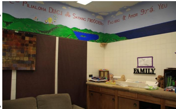
(上圖) 照片所示是監獄中的親子室，布置溫馨，並備有畫筆、玩偶、玩具供社工引導親子互動使用。此照片係經獄方同意進行拍攝。

監所監禁受刑人之自由，但從社會整體之角度以觀，社會之根本在家，受刑人與家庭之聯繫、互動，特別是與兒童之間之聯繫相當受重視。因此除安排固定的親子活動時間，由社工引導互動，空間上亦特別規劃，對於兒童可維持正向的親密聯繫，對受刑人則強化其為人父母之責。