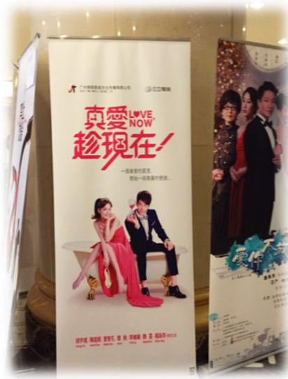
三立電視臺在新世紀日航飯店所設立之宣傳看板。