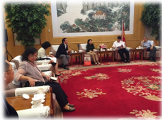
參訪人員拜會大陸國家廣電總局副總局長童剛先生。

廣電總局此次由副總局長童剛與我方參訪人員會面，雙方就有關中國大陸針對新媒體的管理措施、電視劇審批程序的簡化、促進兩岸影交流，及中國大陸網路劇是否得比照電視劇不將臺灣列為引進劇等議題，進行充分溝通與討論。童副總局長表示中國大陸現今影視市場的發展，內容品質已比政策更為關鍵，政策上兩岸可加強合作溝通，但市場推動力量等非政策因素對於臺劇是否得以進入中國大陸影響更大，中國大陸每年約產製電視劇 1 萬 5,000 小時、電影片 8,00 多部，在內容為王的趨勢下，希望政策可以為兩岸在市場流向及新媒體發展搭建更好的合作平臺。