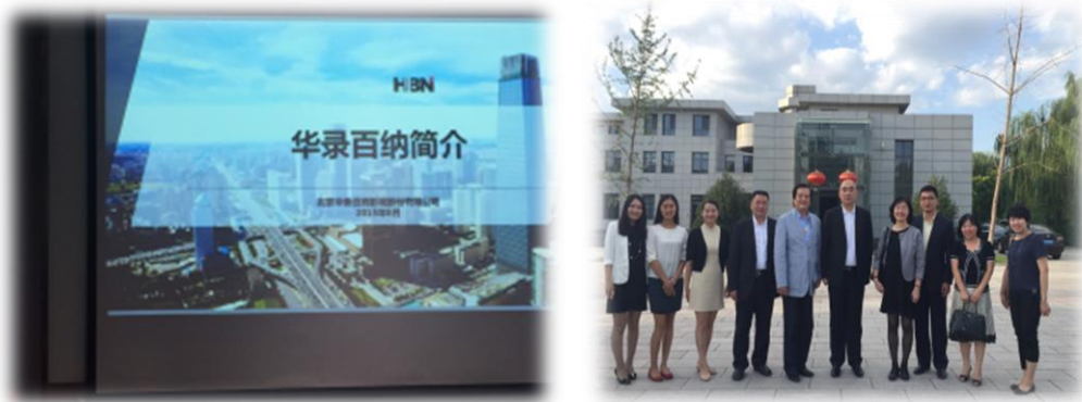
參訪人員在華納百錄總部前留影。

針對兩岸影視合作遭遇的課題與機會，劉總也明確表示，基於兩岸文化同文同種，加上臺灣優秀的人才創意，華納百錄一直尋求與臺灣影視業者合作的機會，依渠個人觀察，中國大陸電視劇製作規模大，目前中國大陸前五大衛星電視臺每個綜藝節目每季投入的製作費約為 2 億人民幣，每集電視劇的製作費亦達 150 萬元人民幣以上，而臺灣則在專業水平上較為領先，然臺灣過多的電視頻道需求，加上市場的侷限性，消磨臺灣影視製作的能量，他個人曾為與臺灣影視業者合作，多次來臺與業者洽談，惟臺灣製作人囿於市場考量，對於大規模投資較為怯步，轉而投資相對低成本的偶像劇，長期而往，低成本的製作考量對臺灣電視產業將產生較大的傷害。未來華納百錄仍期待與臺灣專業人才合作。