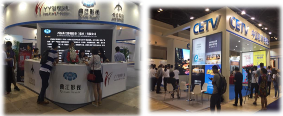
中國大陸參展商展位設計方式。

參展商外，亦有來自香港、澳門、法國、韓國、俄羅斯、奧地利等的公司參展。中國大陸大型電視臺及製作業者，在展位設計方面甚具變化性，更以大型螢幕及觀影空間推介其影視作品，讓與會者具有身歷其境的最佳影音臨場感受。