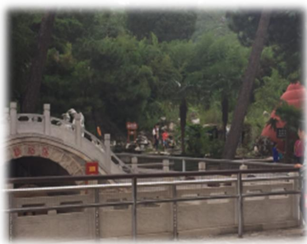
星美今晟影視城之江南建築。

星美今晟影視城建於 1995 年，隸屬星美集團，是中國大陸北部最大外景影視拍攝基地，影城包含中國各朝代街景及建築，影城規劃以一城之隔，區分為南方建築及北方建築，可方便劇組人員需求，許多知名電影及電視劇均在此取景。