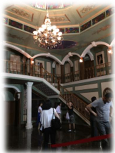
懷柔影視基地現代化攝影棚。