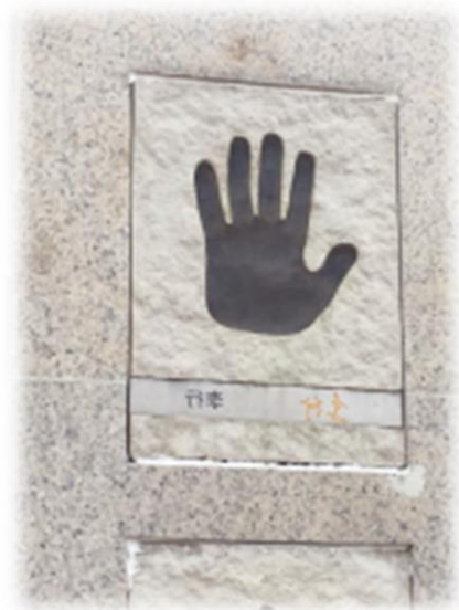
臺灣知名導演在星美今晟影視城留下手印。

影城規劃小而美，園區佔地雖無法與橫店影視基地相比，然充滿創意的設計，方便拍攝者使用，且毗鄰懷柔影視基地中影數位城，集聚成為影視中心，資源整合，有利未來發展。