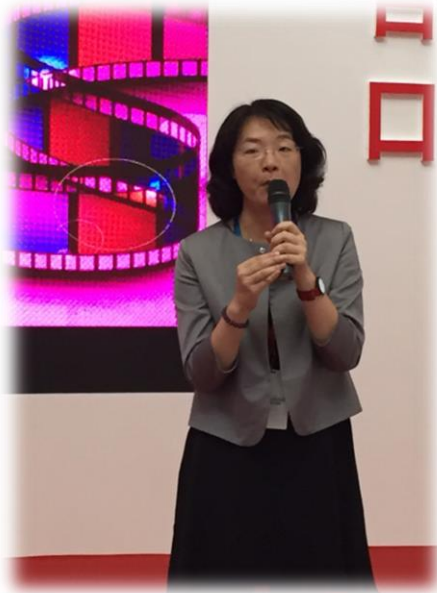
本司徐司長在節目發展會致詞情形。