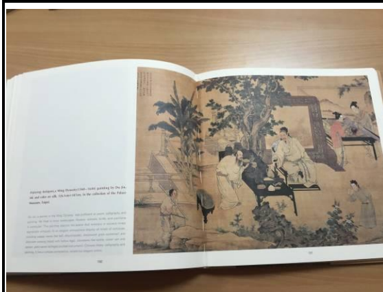
於本屆新加坡書展購得疑似盜版書籍

筆者於本屆書展其它展區參訪時，因發現不少中國大陸出版品疑似未經本院授權而使用本院圖像，但考量行李重量限制，恐無法逐一購回，於是筆者審慎挑選幾本較具代表性且不同類型的疑似侵權書籍，例如其中有一本為全英文書籍(五洲出版社)，整本書粗估似有超過 2/3 的圖片使用了本院圖像，經購置後返台旋即向主管報告並全數繳交至授權相關業務承辦人在案。