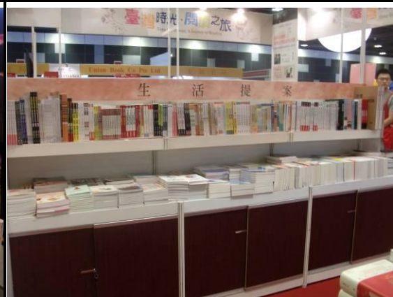
生活提案(旅遊保健)書區