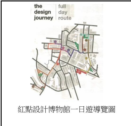
紅點設計博物館一日遊導覽圖