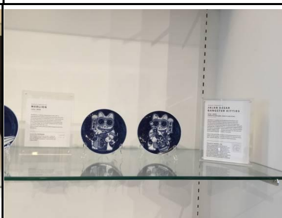
新加坡在地青年藝術家開發的設計商品 (新加坡藝術博物館)