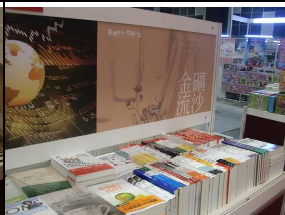
金礦流沙(商業理財)書區