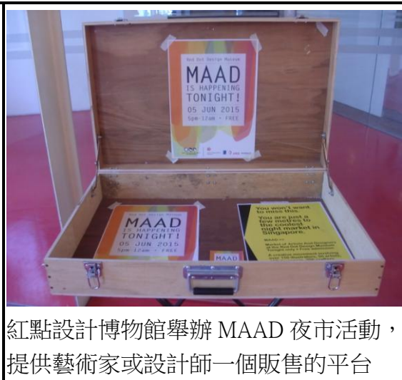
紅點設計博物館舉辦 MAAD 夜市活動，提供藝術家或設計師一個販售的平台