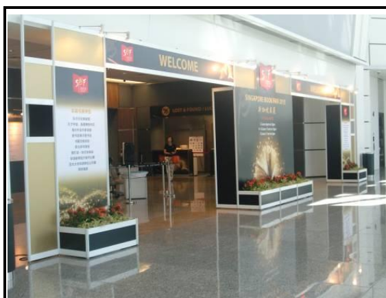
新加坡書展會場入口處

周邊活動的亮點項目包括：設置東方文化體驗館、孔子學堂、魚尾獅創作區(創意魚尾獅)、海內外名作家講座、新書發表與簽書會、書籍交換、英文拼字遊戲、猜燈謎—知識加油站、華語新聞短片製作比賽、第七屆亞太太專華語辯論公開賽、即時抽獎等，以吸引民眾參與。