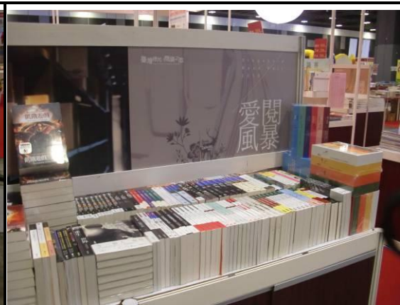
愛閱風暴(臺灣年度暢銷書)書區