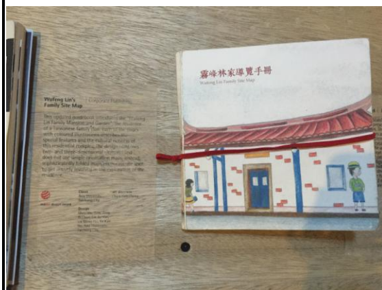
獲得紅點設計獎之臺灣出版品—霧峰林家導覽手冊