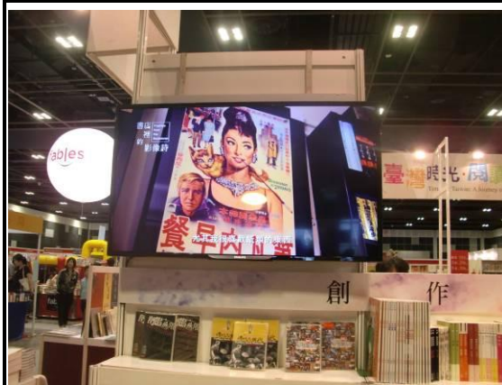
大型螢幕播放著影片