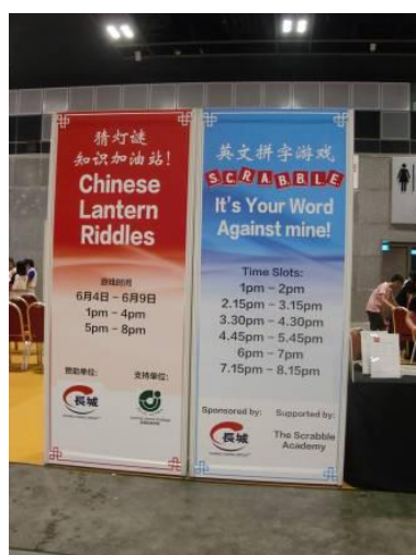
猜燈謎與英文拼字遊戲區