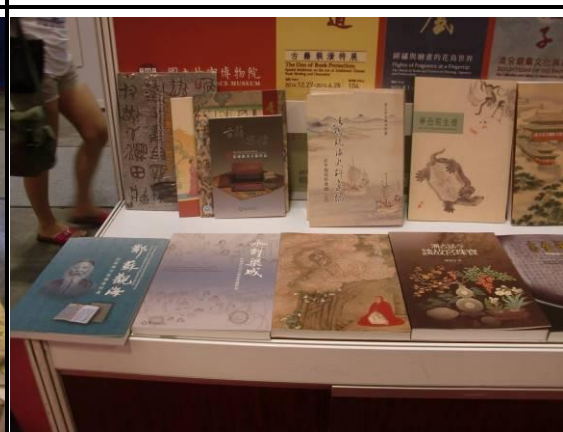
本院出版品展示情形