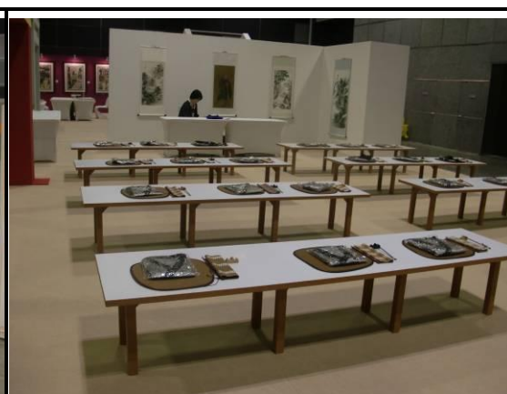
孩童可穿上古代書生的長褂，在老師帶領下朗誦三字經等儒家經典