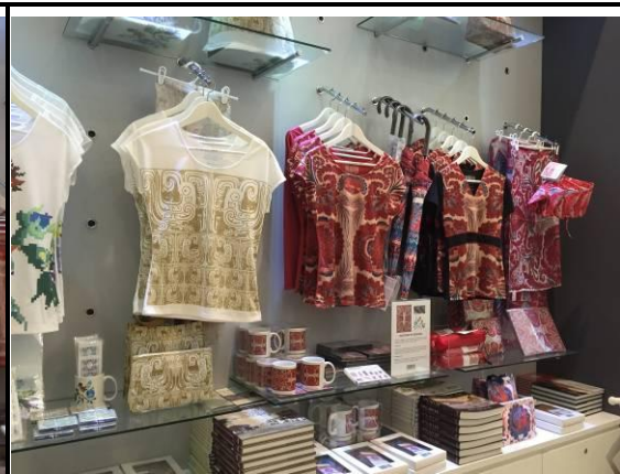
Patterns of Heritage 商品 (新加坡國立博物館)