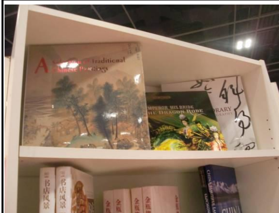
疑似侵犯本院智財權的英文書籍