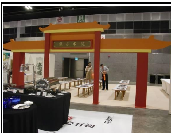
孔子書院示範儒家教育