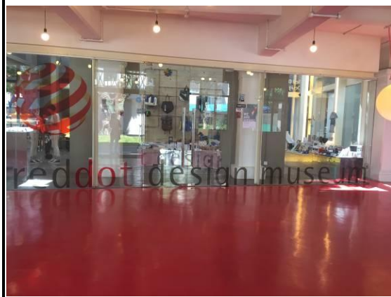
紅點設計博物館商店