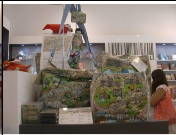
Museum Label 商品(以新加坡地圖為設計元素的書包、雨傘、吊牌等系列商品)

「Museum Label」商品開發設計極重視文化的教育與傳承意義，也會將同樣圖騰元素系列的產品擺放在一起，並附上清楚的說明牌，以利觀眾瞭解，例如「Patterns of Heritage」，將各亞洲文化圖騰元素開發成系列商品。