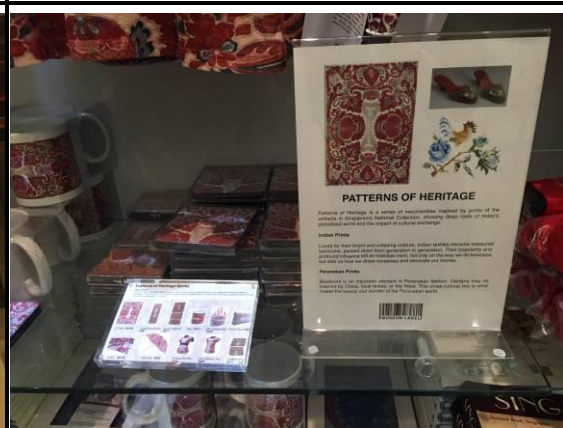
娘惹系列(新加坡國立博物館)