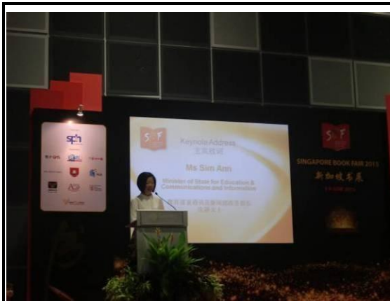
新加坡教育部兼通訊及新聞部政務部長沈穎致詞

今天新加坡書展也如往年一樣頒發全國模範華文教師獎，來肯定華文老師的貢獻。這八位得獎的教師在課堂上用生動、創新的方式教授華文，其中有一些還利用網路上的視頻和社交媒體與學生進行討論和交流，讓華文走入學生的生活。希望模範華文教師獎的這份榮耀和肯定，能激勵著我們的華文教師繼續通過種種靈活有趣的教學方式，讓學生接觸華文、喜歡華文。