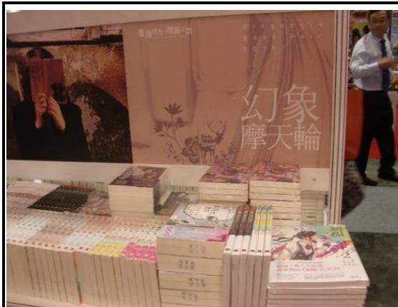
幻象摩天輪(輕小說)書區