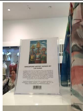
新加坡藝術家系列商品：劉抗(Liu Kang) (新加坡國立博物館)