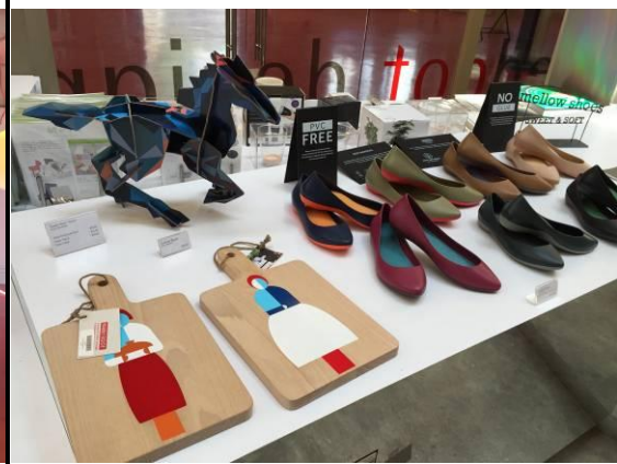
紅點設計博物館商店販售之設計商品