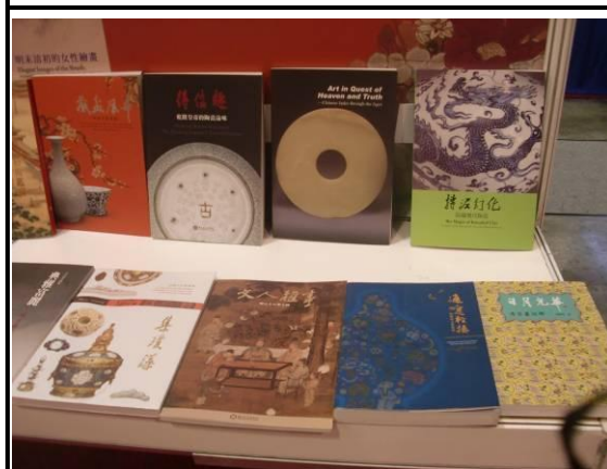
本院出版品展示情形