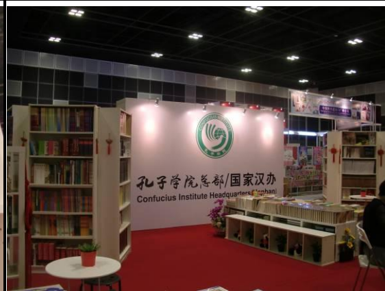
左邊的英文書是在孔子學院總部發現的