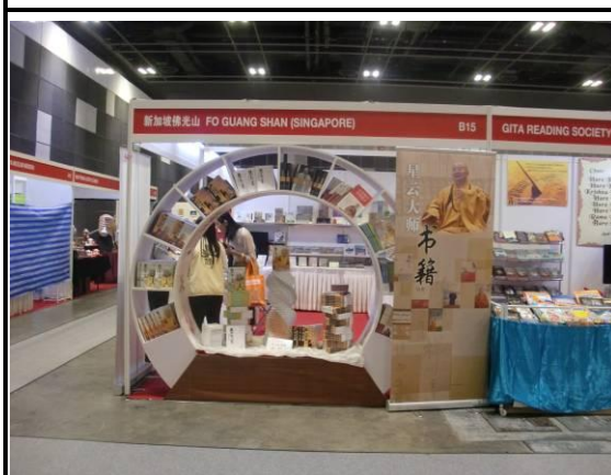
新加坡佛光山展區