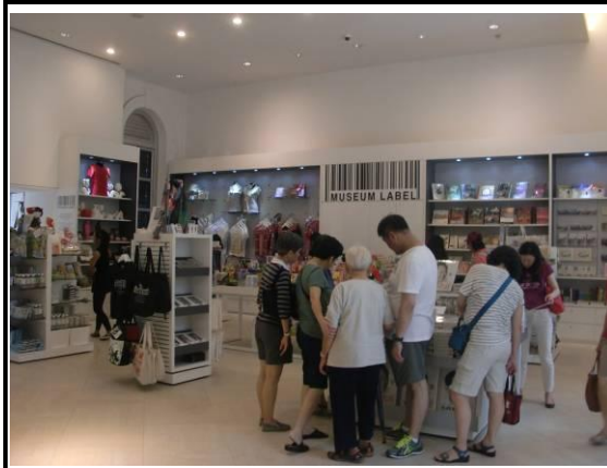
Museum Label 商店(新加坡國立博物館)