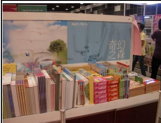
奇幻之森(童書繪本)書區