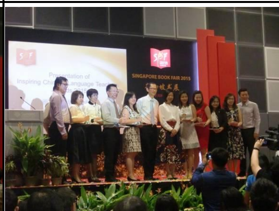
華文模範教師頒獎