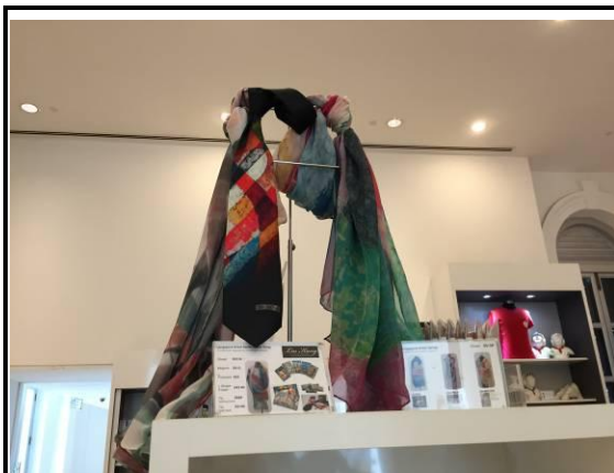
新加坡藝術家系列商品：劉抗(Liu Kang) (新加坡國立博物館)

在開發博物館商品方面，頗多與在地新加坡藝術家或設計師合作的例子，不僅注重設計感，更有展現、推動及提升在地設計師或藝術家知名度、強調文化典藏價值與藝術生活化的企圖。