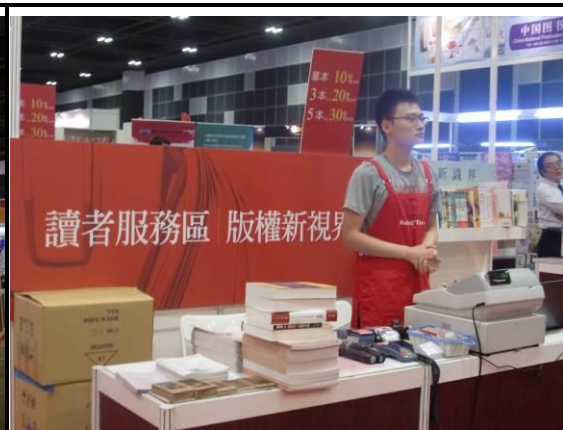
臺灣館讀者服務區