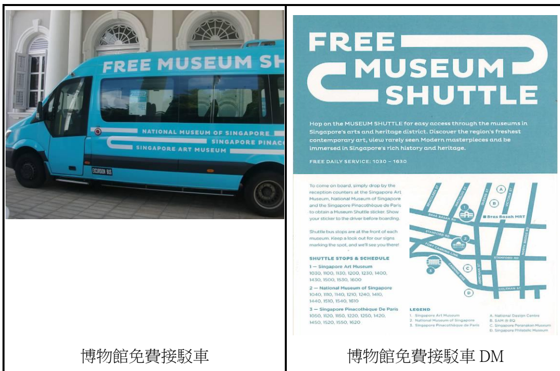
博物館免費接駁車