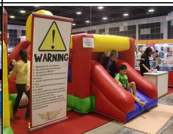
童書出版社展區附設遊戲器材，以吸引兒童的關注