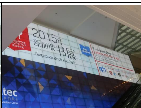
新達城書展會場巨型廣告燈箱