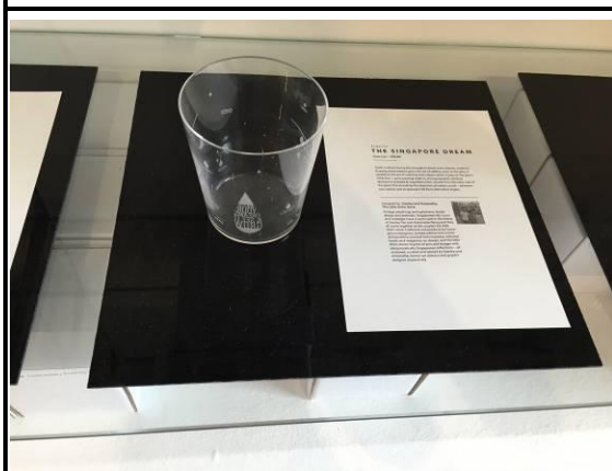
新加坡在地青年藝術家開發的設計商品 (新加坡藝術博物館)