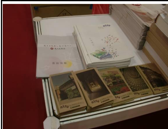
各參展單位所提供的圖書目錄或書卡