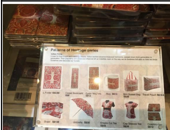
娘惹系列商品說明(新加坡國立博物館)