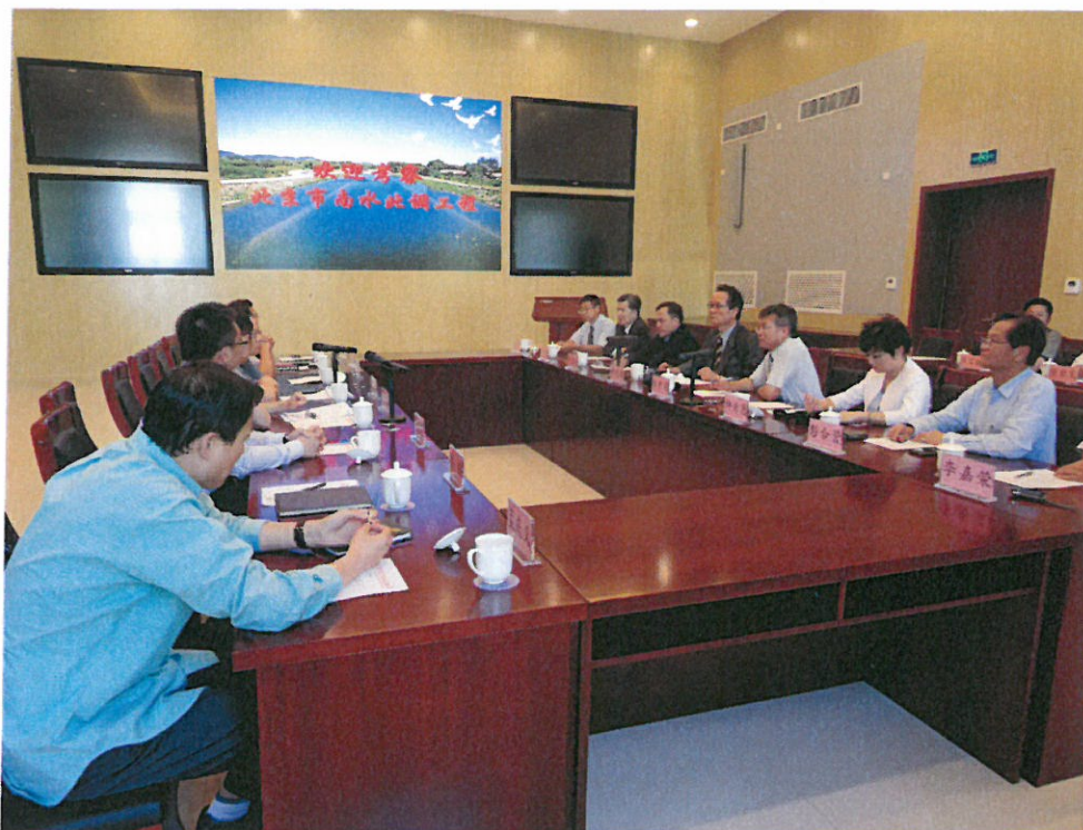
圖 6：參訪北京市南水北調工程建設委員會辦公室