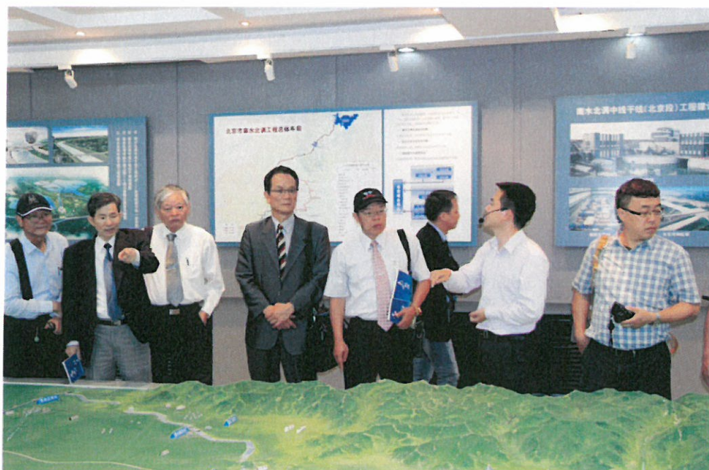
圖 7：參觀南水北調工程展覽室