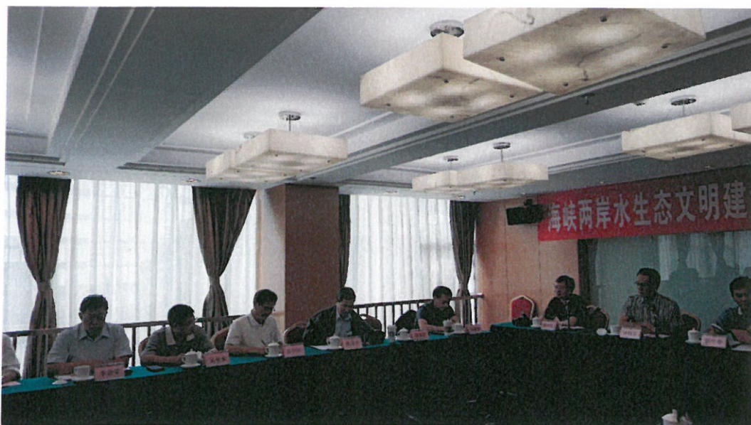
圖 15：參訪廣西壯族自治區水利廳及進行交流討論