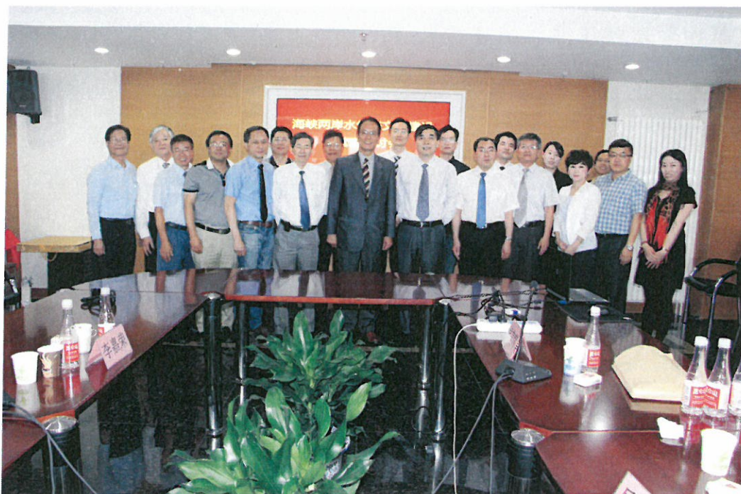
圖 5：雙方代表團合影