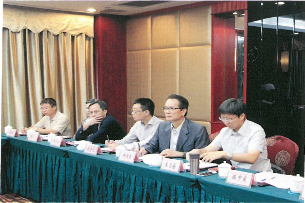
圖 13：參訪團與柳州市水利局代表人員意見交流