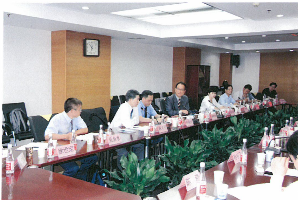
圖 4：我方代表團發言及提問