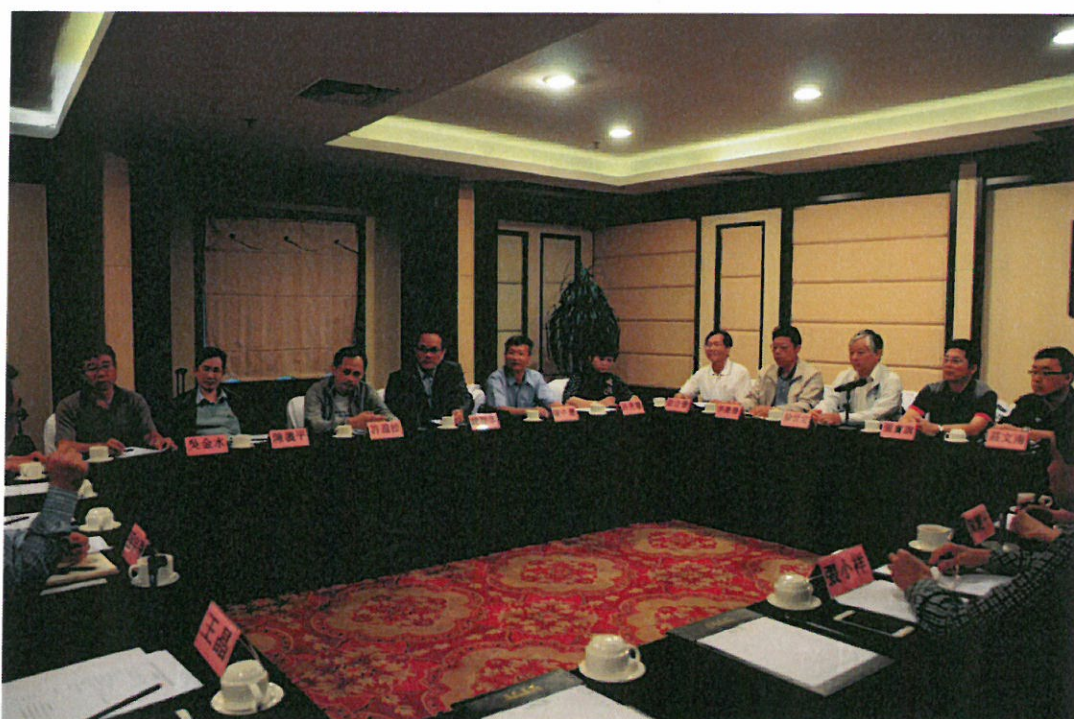
圖 10：與桂林市水利局代表人員意見交流

讓桂林山水甲天下之觀光得以發展，有效聯合運用水資源及設會貢獻極大，另外桂林市自來水價每度為人民幣 2.6 元(約新台幣 13 元)，其水價含污水處理費，自來水是由城市建設局主管監督之自來水公司供應，原水則由水庫管理單位免費調配供應。