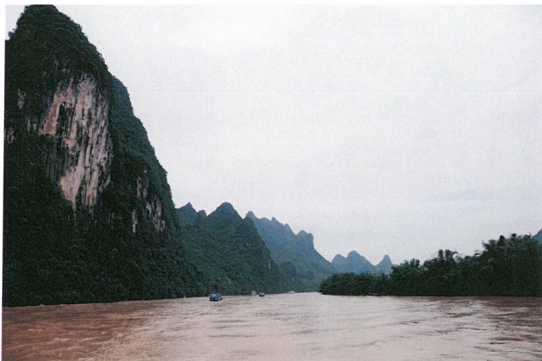
圖 12：灕江有世界級景觀，灕江補水工程確保生態及通航流量