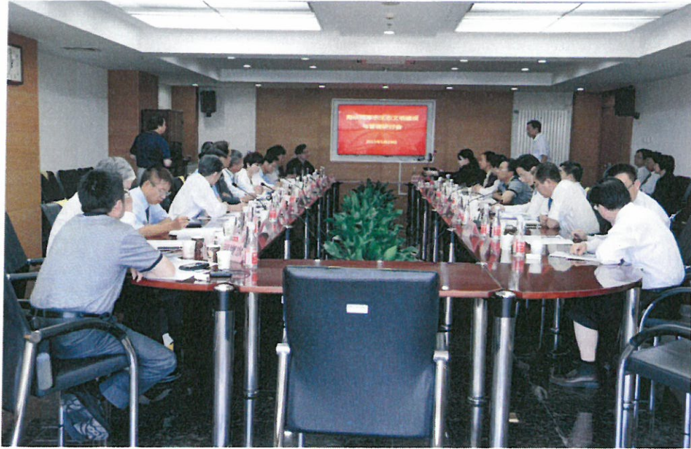
圖 1：至水利部發展研究中心參訪交流