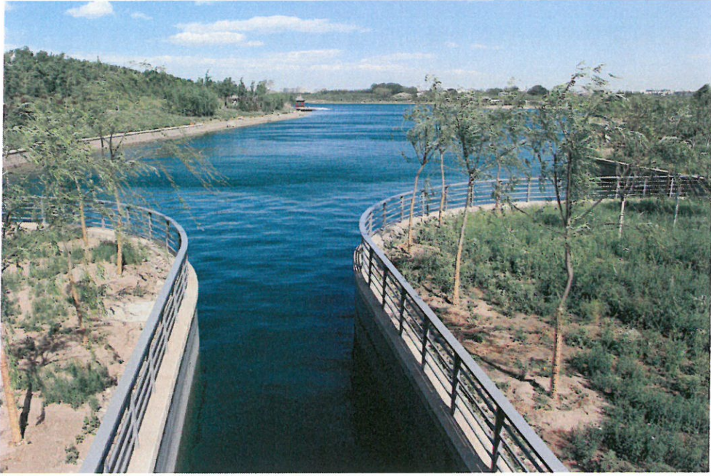
圖 8：團城湖調節池實地景觀