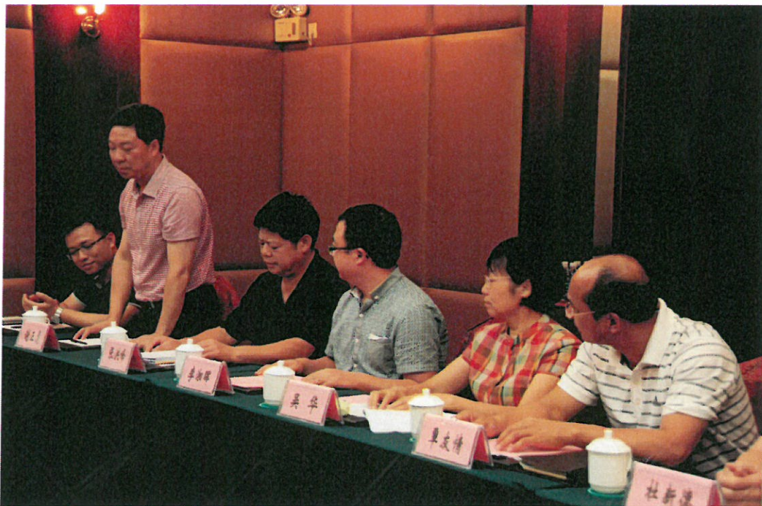
圖 14：柳州市水利局介紹防洪、水資源管理工作