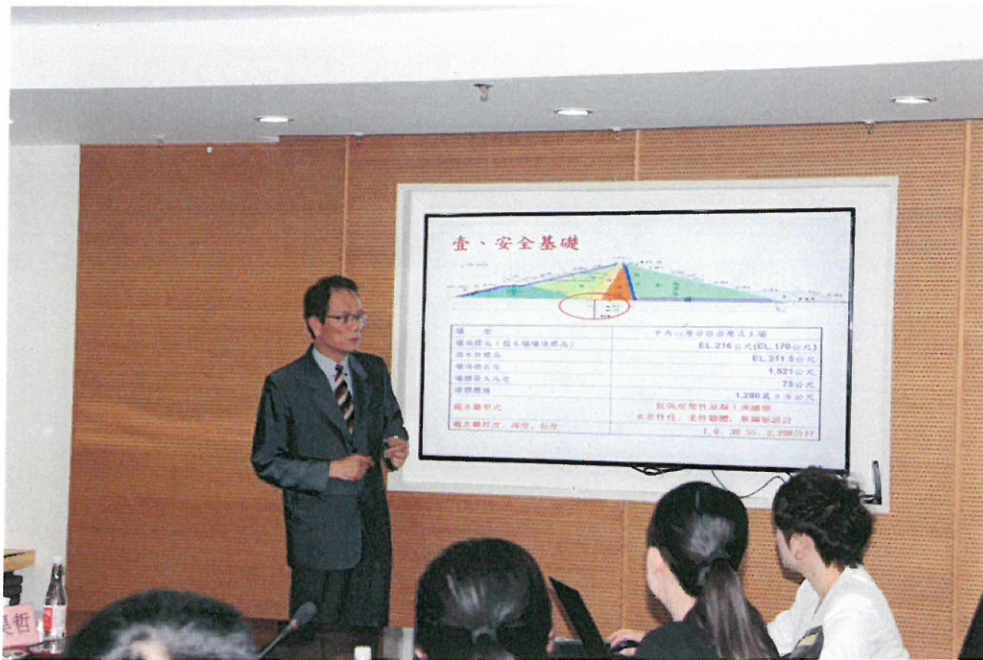
圖 3：鍾朝恭總工程司演講「建構健康生態園區水庫」