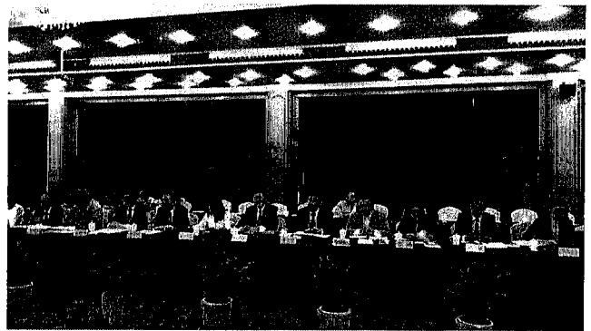
圖二：我方共有 15 位產官學研代表出席