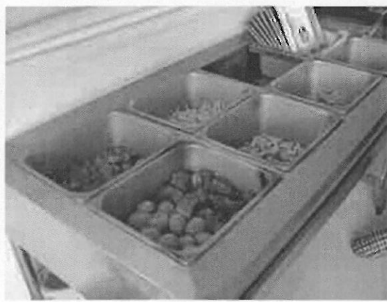
實習學生日常餐飲(台幹餐廳，自助式加水果)