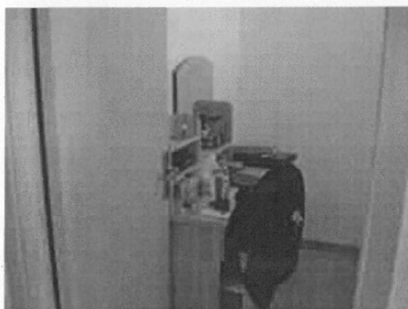
實習學生工作宿舍(單人房兩人共用衛浴)